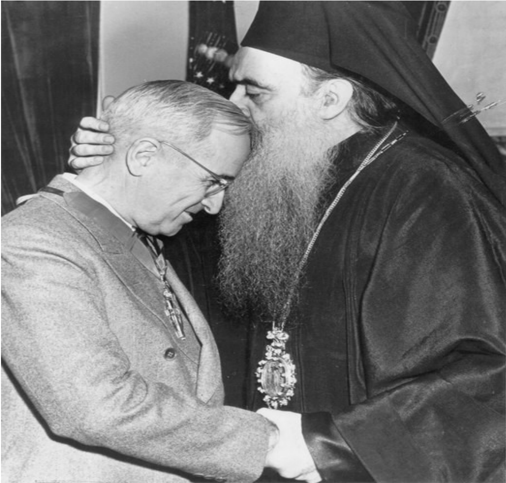
Ὁ Οἰκουμενικός Πατριάρχης Ἀθηναγόρας μέ τόν Πρόεδρο τῶν Η.Π.Α. Χάρυ Τρούμαν. Ἡ ἐκλογή του στόν Οἰκουμενικό Θρόνο ὑπῆρξε ἐπιλογή καί ἐπιβολή τοῦ Ἀμερικανοῦ Προέδρου, ὁ ὁποῖος καί τοῦ παραχώρησε τό προεδρικό ἀεροσκάφος γιά τήν μετάβασή του στό Φανάρι.

Στό πλαίσιο αὐτό, οἱ δυτικές Κυβερνήσεις ὑποστηρίζουν καί ἐνισχύουν τόν «οἰκουμενικό διάλογο», τίς προσπάθειες γιά τήν «σύσφιγξη τῶν σχέσεων μεταξύ τῶν Ἐκκλησιῶν Ἀνατολῆς καί Δύσεως» καί γενικώτερα τήν σύγκλιση μεταξύ τῶν θρησκευτῶν.