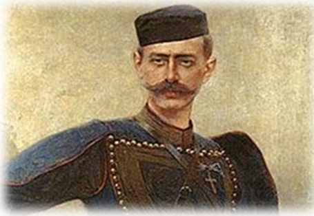
Ο Παύλος Μελάς με στολή Μακεδονομάχου.

Το ηθικό αποτελεί το αναντικατάστατο συστατικό του στρατιωτικού προσωπικού, δεν αποτελεί προϊόν προς πώληση, αλλά «κτίζεται» με το χρόνο. Η αποδοχή εκ μέρους της μεγάλης πλειοψηφίας των Ελλήνων, ότι θα πρέπει προς υπεράσπιση της πατρίδος, να θυσιάσουν εάν απαιτηθεί και τη ζωή τους, αποτελεί το θεμέλιο της προς πόλεμο προπαρασκευής και της επιβιώσεως του έθνους. Ο Παύλος Μελάς [5] (1870-1904), παρότι τόσο αυτός, όσο και η σύζυγος του Ναταλία Δραγούμη, προέρχονταν από ισχυρές και εύπορες οικογένειες, χωρίς να διαταχθεί, προσφέρθηκε εθελοντικά να πολεμήσει και θυσιάσθηκε για τη υπεράσπιση της ελληνικότητας της Μακεδονίας. Ήσαν πολλοί οι εμφορούμενοι από το ίδιο πνεύμα, με αποτέλεσμα να διπλασιασθεί η Ελλάδα, χάριν της θυσίας αγνών πατριωτών και εντίμων ανθρώπων.