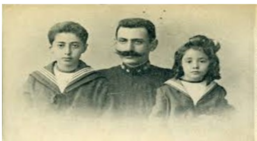
Ο Παύλος Μελάς με τα παιδιά του.

[5] Τις νυκτερινές ώρες της 13 ης Οκτωβρίου του 1904, ο Ανθυπολοχαγός πυροβολικού Παύλος Μελάς, σε ηλικία 34 χρονών, άφησε την τελευταία του πνοή στη Στάτιστα (σημερινός Μελάς) της Μακεδονίας. Ο θάνατος του προήλθε από θανάσιμο τραυματισμό στην οσφυϊκή χώρα, συνεπεία πυροβολισμού, μετά από συμπλοκή με τουρκικό στρατιωτικό απόσπασμα. Τόσον ο Μελάς, όσο και η σύζυγός του Ναταλία (θυγατέρα του Στέφανου Δραγούμη), προέρχονταν από επιφανείς και εύπορες οικογένειες. Από το γάμο του ο Μελάς απέκτησε δύο τέκνα τον Μιχάλη(Μίκης) και την Ζωή(Ζέζα).