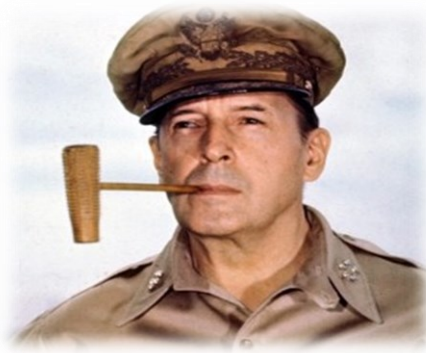
Ο Αμερικανός Στρατηγός Ντάγκλας Μακ Άρθουρ.

και δεν μπορεί να τα εμφυσήσεις, ή να τα ενστερνισθείς εάν δεν τα πιστεύεις.