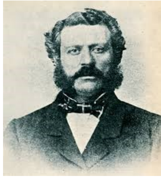
Ο Αριστοτέλης Βαλαωρίτης.

[12] Απόσπασμα Συνεντεύξεως Κ. Μητσοτάκη στο Ρ/Σ TALK της 12ης Σεπ 2024.