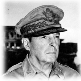
Ο Αμερικανός Στρατηγός Ντάγκλας Μακ Άρθουρ.

[10] Ο Αμερικανός Στρατηγός 5 αστέρων (αντίστοιχος βαθμός του Στρατάρχη) Ντάγκλας Μακ Άρθουρ [Douglas MacArthur, (1880-1964)]. Υπήρξε ο πλέον διαφημισμένος αλλά και αντιφατικός στρατιωτικός των ΗΠΑ του 20ού αιώνα. Πρωτοστάτησε στον Β΄ Παγκόσμιο Πόλεμο (1939-1945) στον Ειρηνικό Ωκεανό, στις επιχειρήσεις κατά του αυτοκρατορικού στρατού. Διετέλεσε κατοχικός διοικητής και μεταρρυθμιστής της Ιαπωνίας (1945-1950). Ανέλαβε διοικητής των δυνάμεων του ΟΗΕ κατά τον Πόλεμο της Κορέας (1950-1953), πριν το τέλος του οποίου απαλλάχτηκε των καθηκόντων του εξαιτίας διαφωνιών με τον Αμερικανό Πρόεδρο Χάρρυ Τρούμαν.