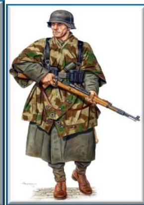
Το γερμανικό άρμα μάχης "Πάνθηρας" Γερμανός αρματιστής και πεζικάριος.

Το άρμα μάχης Τίγρης I (54 τόνοι και πυροβόλο 88 χιλ), ήταν γερμανικό βαρύ άρμα μάχης του Β΄ΠΠ, που έδρασε από το 1942 στην Βόρειο Αφρική και στη Σοβιετική Ένωση, Μετά τον Αύγουστο του 1944, η παραγωγή του Τίγρη I καταργήθηκε σταδιακά υπέρ του Τίγρη II. Είχε