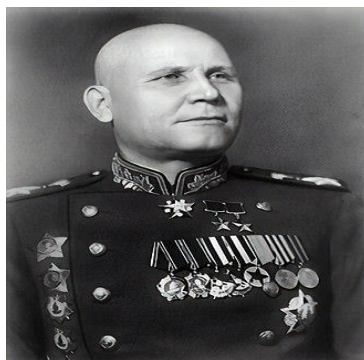
Ο Στρατάρχης Ιβάν Κόνιεφ.

[9] Ο Στρατάρχης Ιβάν Στεπάνοβιτς Κόνιεφ (1897-1973) ηγήθηκε των δυνάμεων του Κόκκινου Στρατού κατά τη διάρκεια του Β΄ΠΠ, και κατέλαβε το μεγαλύτερο μέρος των εδαφών της Ανατολικής Ευρώπης. Εισήλθε πρώτος στο Βερολίνο. Αντικατέστησε τον Ζούκοφ ως διοικητή των σοβιετικών επίγειων δυνάμεων το 1946. Το 1956 διορίστηκε διοικητής των ενόπλων δυνάμεων του Συμφώνου της Βαρσοβίας και ηγήθηκε της βίαιης καταστολής της Ουγγρικής Επανάστασης. Κατά την διοίκησή του κατασκευάσθηκε το τείχος του Βερολίνου το 1961.