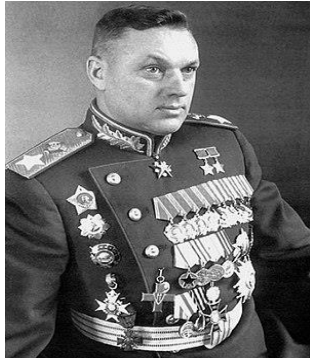
Ο Στρατάρχης Κωνσταντίν Ροκοσόφσκυ.

[11] Ο Στρατάρχης Κωνσταντίν Ροκοσόφσκυ (1896-1968), ως διοικητής της 16ης Στρατιάς συνέβαλε στην απώθηση των Γερμανών από τη Μόσχα. Τον Ιούλιο του 1942, ο Στάλιν αποφάσισε να τον ορίσει επικεφαλής του Μετώπου του Ντον, απ' όπου συμμετείχε στην εκμηδένιση της 6ης Στρατιάς στο Στάλινγκραντ. Ο Ροκοσόφσκυ άφησε τη σφραγίδα του σε όλες τις μεγάλες μάχες του που ακολούθησαν, στο Κούρσκ, στη Λευκορωσία, στη γεννέτειρά του Πολωνία και στη κατάληψη του Βερολίνου.