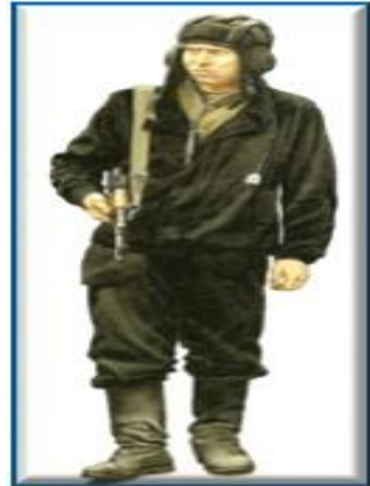
Το σοβιετικό μέσο άρμα μάχης "T-34", Ρώσος αρματιστής.

[13] Το άρμα μάχης Πάνθηρας, (Panzerkampfwagen V Panther), ήταν ένα γερμανικό μέσο άρμα μάχης(44 τόνοι, πυροβόλο 75 χιλ)του Β΄ΠΠ. Χρησιμοποιήθηκε στο Ανατολικό και Δυτικό Μέτωπο από τα μέσα του 1943 έως το τέλος του πολέμου τον Μάιο του 1945. Το Panther προοριζόταν να αντιμετωπίσει το σοβιετικό μεσαίο άρμα T-34 και να αντικαταστήσει τα Πάντσερ II και IV. Θεωρείται ένα από τα καλύτερα άρματα μάχης του Β' Παγκοσμίου Πολέμου για την εξαιρετική δύναμη πυρός, την προστασία και την ευκινησία του.