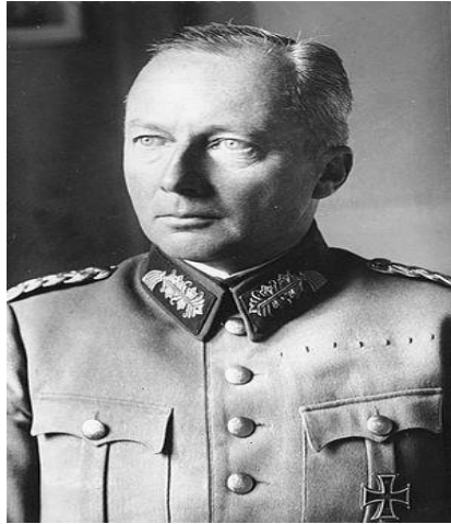
Ο Στρατάρχης Γκύντερ φον Κλούγκε.

[2] Ο Στρατάρχης Μανστάιν[Erich Eduard von Manstein (1887-1973)], υπήρξε ο πλέον ικανός και ευφυής στρατηγός του Γερμανικού Στρατού και ίσως ο καλύτερος όλων που συμμετείχαν στον Β΄ Παγκόσμιο Πόλεμο. Υπήρξε ο εμπνευστής του σχεδίου «SICKLE CUT» της εισβολής κατά της Γαλλίας τον Μάιο του 1940. Διεύθυνε την πολιορκία της Σεβαστούπολης και της Χερσονήσου του Κέρτς και συμμετείχε στην πολιορκία του Λένινγκραντ. Μετά την καταστροφική ήττα στο Στάλινγκραντ(1942), στην τρίτη μάχη του Χαρκόβου(Μάρτιος 1943) ανέκτησε σημαντικά εδάφη και κατέστρεψε 3 ρωσικές στρατιές. Οι συνεχιζόμενες διαφωνίες του με τον Χίτλερ για τη διεξαγωγή του πολέμου οδήγησαν στην απόλυσή του τον Μάρτιο του 1944. Δεν απέκτησε ποτέ άλλη διοίκηση και αιχμαλωτίστηκε από τους Βρετανούς τον Αύγουστο του 1945, τρεις μήνες μετά την ήττα της Γερμανίας. Το 1949, καταδικάσθηκε από βρετανικό στρατοδικείο για εγκλήματα πολέμου σε 18 ετών φυλάκιση. Πολλοί επώνυμοι Βρετανοί που τον συμπαθούσαν, διαμαρτυρήθηκαν έντονα με αποτέλεσμα η ποινή να μειωθεί στα 12 έτη. Τελικά αποφυλακίστηκε στις 6 Μαΐου 1953 για λόγους υγείας. Στα μέσα της δεκαετίας του 1950, βοήθησε στη αναδιοργάνωση του γερμανικού στρατού, ως στρατιωτικός σύμβουλος της κυβερνήσεως της Δυτικής Γερμανίας. Στα απομνημονεύματά του, μεταφρασμένα στα αγγλικά με τον τίτλο «Νίκες Απολεσθείσες», ήταν ιδιαίτερα επικριτικός για τον Χίτλερ.