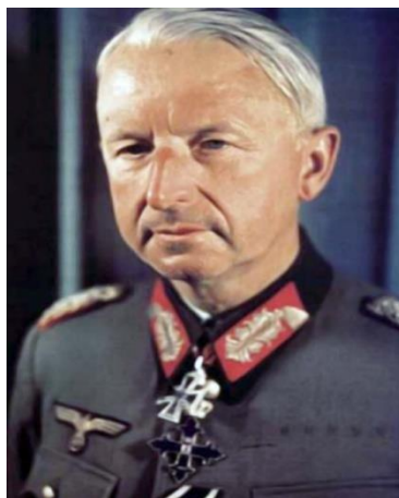
Ο Στρατάρχης Έριχ Φον Μάνσταϊν.

Το ρωσικό μέτωπο σχημάτιζε γύρω από το Κούρσκ μία εξέχουσα, 250 χλμ. από βορρά προς νότο και 160 χλμ. από δυσμάς προς ανατολάς, συνολικής εκτάσεως 42.000 χλμ 2 , η οποία αποτελούσε μια διαρκή απειλή για την διάσπαση της γερμανικής παρατάξεως. Η γερμανική Ομάδα Στρατιών του Κέντρου και του Νότου υπό τους Στρατάρχες Γκύντερ φον Κλούγκε (Günther Von Klouge) [1] και Έριχ φον Μάνσταϊν (Erich von Manstein) [2] ήσαν ανεπτυγμένες στην εξέχουσα του Κούρσκ. Την ίδια εποχή οι αγγλοαμερικανικές δυνάμεις είχαν καταλάβει την Βόρεια Αφρική και ετοιμάζονταν να αποβιβασθούν στην Νοτιοανατολική Ευρώπη. Το γερμανικό επιτελείο εκτιμούσε το σύνολο των νεκρών, αιχμαλώτων και μη ανακτήσιμων τραυματιών του σοβιετικού στρατού σε 11(ένδεκα) εκατομμύρια. Ο Μανστάιν εισηγήθηκε στον Χίτλερ την πραγματοποίηση επιχειρήσεως με την επωνυμία «CITADELLE (Ακρόπολη)», με σκοπό την εξάλειψη της εξέχουσας του Κούρσκ και την όσο το δυνατό μεγαλύτερη καταστροφή των σοβιετικών δυνάμεων. Μ' αυτό τον τρόπο εκτιμούσε ότι θα εξανάγκαζαν τον Στάλιν σε υπογραφή ξεχωριστής ειρήνης [3] . Οι Ρώσοι αιχμάλωτοι θα χρησιμοποιούντο στις γερμανικές βιομηχανίες ως άμισθοι εργάτες.