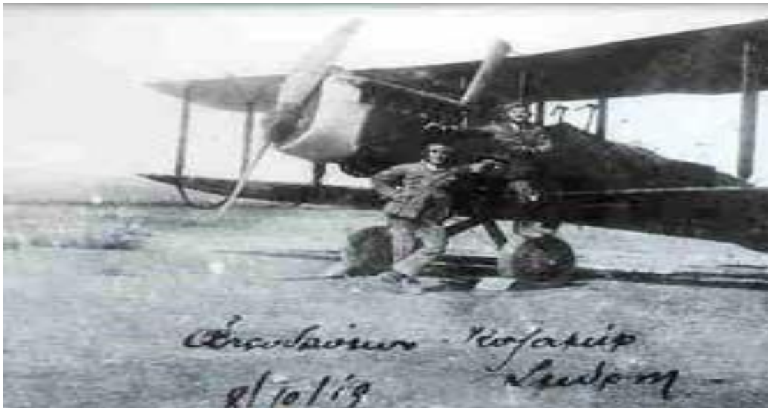
AIRCO DE HAVILLANT D.H.9 .

καταδιωκτικών SOPWITH CAMEL 1F.1, που επιχειρούσε κυρίως από τα αεροδρόμια Καζαμίρ Σμύρνης, Μαγνησίας και Ουσάκ με τα «Προκεχωρημένα Σμήνη Μετώπου», σε συνεργασία με την 533 Μοίρα της ΣΑ που διέθετε Α/Φ τύπου BREGUET 14A2/B2. Αργότερα, στις 20 Δεκ. 1919 του ιδίου έτους, η Στρατιά οργάνωσε και λειτούργησε την «Διεύθυνση Αεροπορικής Υπηρεσίας Στρατιάς» (ΔΑΥΣ), που ενσωμάτωσε και συντόνιζε όλες τις αεροπορικές δυνάμεις στην Μ. Ασία.