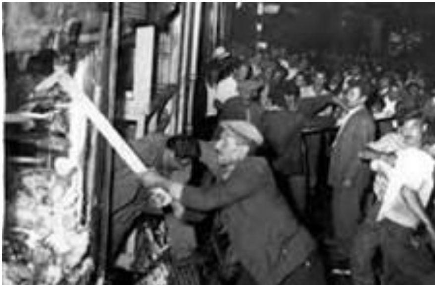
Ο τουρκικός όχλος επί το έργον.

Την 6 η Σεπτεμβρίου 1955, ο «οργανωμένος» τουρκικός όχλος προέβη σε συστηματικές καταστροφές και λεηλασίες σε βάρος του ελληνικού πληθυσμού της Κωνσταντινουπόλεως. Οι καταστροφές άρχισαν την 18:30 και διήρκεσαν όλη την νύχτα, με την αστυνομία απύσχα. Ο τραγικός απολογισμός της φρενίτιδας, η οποία εκπορεύτηκε από το επίσημο κράτος ήταν: 16 νεκροί (ανάμεσα τους 2 μητροπολίτες) και 32 βαριά τραυματισμένοι. Οι υλικές ζημιές ήταν τεράστιες και υπολογίσθηκαν σε πάνω από 200 εκατομμύρια δολάρια. Καταστράφηκαν 73 εκκλησίες, 26 σχολεία, 2 νεκροταφεία, 1.004 κατοικίες, 4.348 καταστήματα, 21 βιοτεχνίες, 12 ξενοδοχεία και 97 εστιατόρια. Ως πρόσχημα των διωγμών χρησιμοποιήθηκε η ρίψη βόμβας στο Τουρκικό Προξενείο στην Θεσσαλονίκη, λίγο μετά τα μεσάνυχτα της 6 ης Σεπτεμβρίου 1955. Η έρευνα της Ελληνικής Αστυνομίας οδήγησε στη σύλληψη του θυρωρού του προξενείου και ενός μουσουλμάνου φοιτητού από την Κομοτηνή. Η βομβιστική ενέργεια προκλήθηκε από τους Τούρκους. Ο αγώνας των Κυπρίων κατά των Άγγλων αποτελούσε την αιτία του δράματος των Ελλήνων της Πόλης.