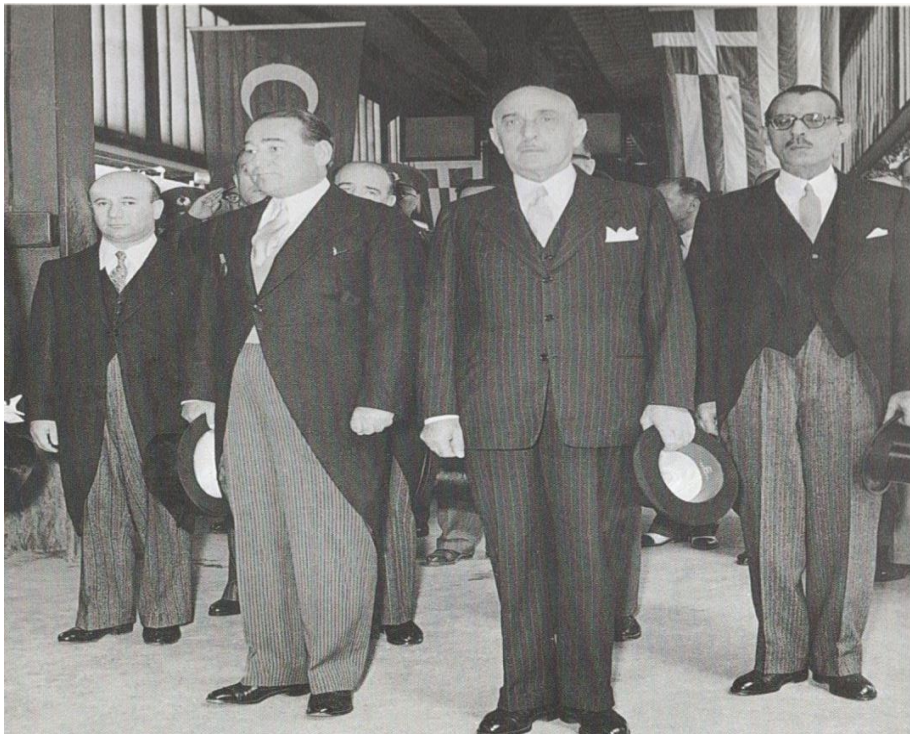
Ο Αλέξανδρος Παπάγος και ο Αντνάν Μεντερές κατά την τελετή εντάξεως των δύο χωρών στο NATO(1953).

στην Κύπρο από εκλεγμένους εκπροσώπους των δύο κοινοτήτων, υπό αγγλική πάντα διοίκηση. Ο πραγματικός σκοπός όμως ήταν η ανάδειξη των αγεφύρωτων διαφορών της Ελλάδος και της Τουρκίας και η προβολή της Αγγλίας ως εγγυήτριας της ομαλότητας και της ειρήνης στο νησί. Οι Έλληνες ζήτησαν την αυτοδιάθεση της Κύπρου, ενώ οι Τούρκοι δήλωσαν ότι δεν επιθυμούσαν να αλλάξει η υφιστάμενη κατάσταση. Σε περίπτωση όμως που κρίνονταν αυτό αναγκαίο, η Κύπρος έπρεπε να επιστρέψει στην Τουρκία, η οποία την εκχώρησε στην Αγγλία το 1878. Από την 13 η Αυγούστου ο Φαζίλ Κιουτσούκ, πρόεδρος του μοναδικού τουρκοκυπριακού κόμματος «Η Κύπρος είναι τουρκική», προειδοποίησε για επικείμενες σφαγές Τουρκοκυπρίων από Ελληνοκύπριους. Το θέμα προβλήθηκε έντονα από τις Τουρκικές εφημερίδες, ενώ οι πιο εξωφρενικοί ισχυρισμοί δημοσιεύονταν, χωρίς την παραμικρή τεκμηρίωση. Την 28 η Αυγούστου ο πρωθυπουργός της Τουρκίας Αντνάν Μεντερές, κατά τον αποχαιρετισμό της αντιπροσωπείας για την τριμερή διάσκεψη, δήλωσε ότι θα εμπόδιζε την σφαγή του τουρκικού πληθυσμού στην Κύπρο. Την επομένη μοιράστηκαν σε Τούρκους καταστηματάρχες της Πόλης 20.000 αφίσες, με την εντολή να τοποθετηθούν στις βιτρίνες τους, για να διακρίνονται από τα καταστήματα των Ελλήνων.