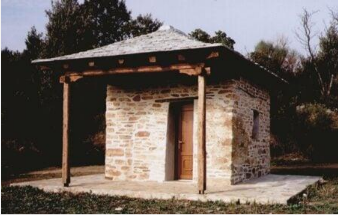
Τό έρημοκάλυβο τοῦ Ἁγίου Νικοδήμου στό Ραχώνι τοῦ Θεωνά στήν Καψάλα πού ἀνακαίνισε ὁ π. Νικόδημος λίγα ἔτη πρὶν τήν κοίμησή του.

Ὀλίγον πρό τῆς κοιμήσεώς του ἐπιμελήθηκε τήν ἔκδοση -μέ πρόλογο, σημειώσεις καί παράρτημα- τῆς βιογραφίας τοῦ μακαριστοῦ θείου του π. Σπυρίδωνος, μέ τίτλο: «† Ἀρχιμανδρίτης Σπυρίδων Σπυρίδ. Μπιλάλης, 1918-1974, Συνοπτική βιογραφία», καθώς καί τήν ἐπανέκδοση τοῦ ἐξαντλημένου μνημειώδους 2τόμου ἔργου τοῦ π. Σπυρίδωνος, «Ὁρθοδοξία καί Παπισμός» (μέ ὑπότιτλους: τόμος Α΄, «Κριτική τοῦ Παπισμοῦ», καί τόμος Β΄, «Ἡ Ἑνωσις τῶν Ἐκκλησιῶν»). Δυστυχῶς, τά βιβλία αὐτά δέν πρόλαβε νά τά δεῖ ἐκτυπωμένα.