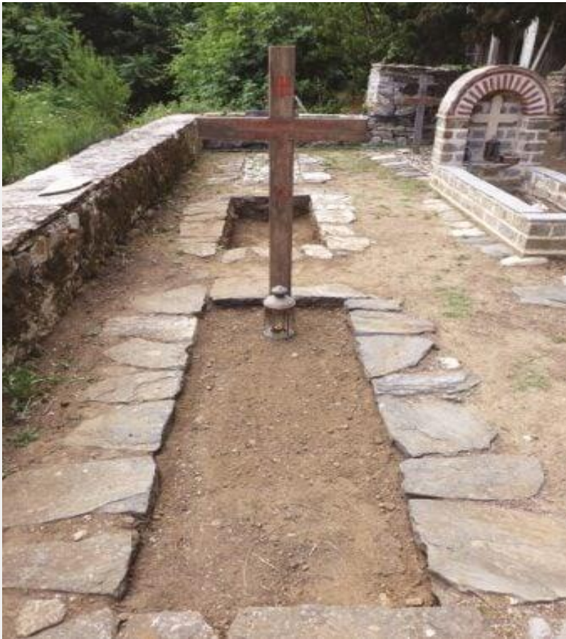
Ὁ τάφος τοῦ μακαριστοῦ Γέροντα Νικοδήμου Μπιλάλη.

Ἔζησε ὡς πραγματικός μοναχός, τιμώντας στό ἔπακρο τίς μοναχικές του ὑποσχέσεις. Ὑπῆρξε ἄνθρωπος ὑπακοῆς, ταπεινός, καθαρός στό σῶμα καί στήν ψυχή καί ἀκτήμων, δέν εἶχε, οὔτε ἐπεδίωξε νά ἔχει ποτέ δικά του χρήματα καί περιουσία. Ἡ ἀπαράβατη καί αὐστηρή νηστεία, ἡ ὑπερβάλλουσα ἀγρυπνία, ἡ ἔντονη καρδιακή προσευχή καί ἡ μελέτη τῶν Πατερικῶν Ἔργων ἦσαν τά καθημερινά πνευματικά του παλαίσματα. Συνεδύαζε μέ μοναδικό καί ἀξιοθαύμαστο τρόπο τό μοναχικό βίο καί τήν ἱεραποστολική δραστηριότητα, ἐργαζόμενος νυχθημερόν γιά τό καλό τῆς Ἐκκλησίας καί γιά τούς ἀγαπημένους του πολυτέκνους.