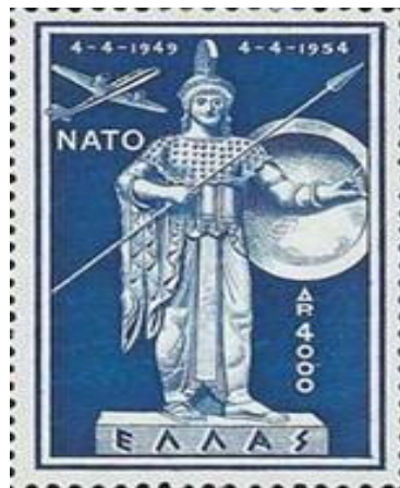
Αντιστράτηγος ε.α. Ιωάννης Κρασσάς.

Δεν είναι αρκετό να ζητάμε από τους εταίρους μας στην ΕΕ και το ΝΑΤΟ, να καταδικάσουν την Τουρκία κάθε φορά που μας απειλεί. Πρέπει να σκεφθούμε τι είναι αυτό που δεν κάνουμε ώστε να «κόψουμε την όρεξη» του αρπακτικού μας γείτονα. Κάθε Ελληνίδα και Έλληνας οφείλει να ενστερνισθεί ότι η υπεράσπιση της πατρίδος συνιστά το ανώτατο καθήκον μας και να το εννοήσουν εχθροί και φίλοι. Αυτό δεν δημιουργείται από μόνο του, απαιτεί μεγάλη προετοιμασία και σκληρή προσπάθεια. Μετά όμως όλα γίνονται εύκολα και απλά.