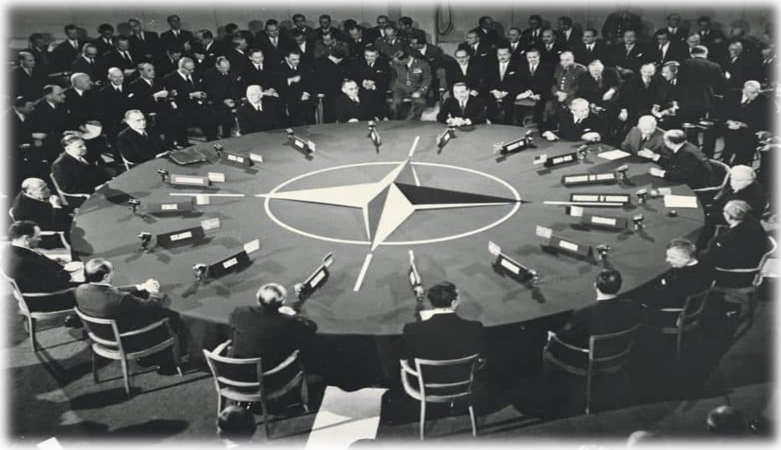
Υπογραφή της ιδρυτικής Συνθήκης του ΝΑΤΟ.