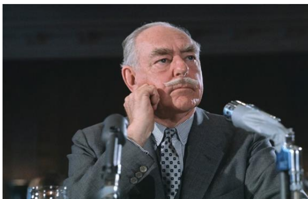
Ο Ντιν Άτσεσον.