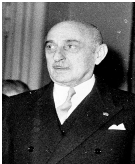
Ο Στρατάρχης Αλέξανδρος Παπάγος (1952).

Ο Αρχηγός της Αξιωματικής Αντιπολιτεύσεως Στρατάρχης Αλέξανδρος Παπάγος[4] εξήρε την σημασία του γεγονότος υπογραμμίζοντας: «Αΐσθημα πλήρους ικανοποιήσεως μέ κατέχει διά τήν αποδοχήν τῆς Ἑλλάδος ὡς ἰσοτίμου μέλους εἰς τόν Ὅργανισμόν τοῦ Βορειοατλαντικοῦ Συμφώνου. Ἡ συμμετοχή μας εἰς τό ΝΑΤΟ ἀποτελεῖ τήν καλυτέραν πιστοποίησην ὅτι αἱ ΗΠΑ καί τά ἄλλα κράτη, μέλη τοῦ Συμφώνου πανηγυρικῶς ἀνεγνώρισαν τήν μεγάλην συνδρομήν τήν ὁποίαν προσέφεραν ἡ Πατρίς μας εἰς τούς κοινούς ἀγῶνας διά τήν ἐλευθερίαν καί τήν δημοκρατίαν». Στην ψηφοφορία ψήφισαν αρνητικά οι 8 βουλευτές της ΕΔΑ και ο ανεξάρτητος αριστερός βουλευτής Μιχάλης Κύρκος[5].