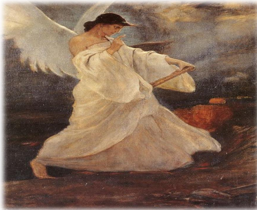
Η Δόξα των Ψαρών του Νικηφόρου Λύτρα.

Για να αντιμετωπίσουμε τις απειλές κατά της χώρας μας που προέρχονται από την Τουρκία[12], πέρα από τις αμυντικές συμφωνίες με τους παραδοσιακούς μας συμμάχους, οφείλουμε να επιδιώξουμε πάση θυσία την ποιοτική αναβάθμιση των ΕΔ, η οποία μπορεί να επιτευχθεί με την εφαρμογή αυστηρών κριτηρίων αξιολογήσεως. Στις ΗΠΑ στην Σχολή Αξιωματικών του Στρατού (West Point), αποφοιτούν οι 1.000 από του 1.300 που εισέρχονται, ενώ το 15% των νεοσυλλέκτων αποτυγχάνει να περατώσει την βασική εκπαίδευση. Ο Μέγας Αλέξανδρος ο οποίος κατέστησε την Ελλάδα υπερδύναμη για μοναδική φορά στην ιστορία της και προσέδωσε οικουμενικότητα στον ελληνικό πολιτισμό, ήταν υποστηρικτής της αριστείας. Οι αμοιβές των ανδρών του συνδέονταν με το προσφερόμενο έργο. Οι οπλίτες στα άκρα της μακεδονικής φάλαγγος ελάμβαναν μεγαλύτερο μισθό από τους υπόλοιπους, γιατί ήσαν υπεύθυνοι για την στοίχιση των ζυγών και τον ρυθμό προχωρήσεως. Βλέπε σχετικό άρθρο: 'Η Στρατιά του Μεγάλου Αλεξάνδρου'.