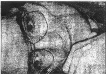
PIŠE: Kleanthis Grivas

Neizmerna ljudska tragedija tiče se kako Srba, tako i albanskih izbeglica čiji je masovni egzodus izazvan NATO bombardovanjem. Svi će platići ogromnu cenu, pre svega u ljudskim