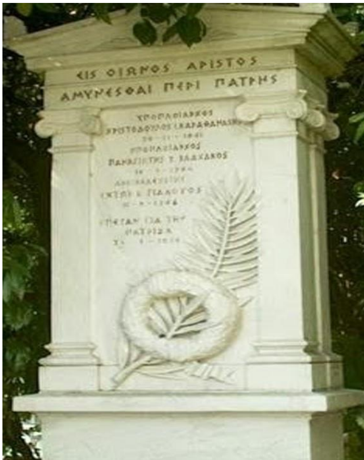
Το μνημείο των τριών πεσόντων στην Πλατεία Ρηγίλλης.