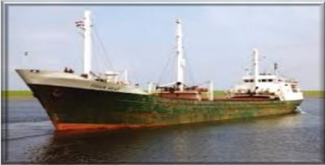
Το Φιγκεν Ακάτ.

ελληνικού εδάφους[3], επισημαίνοντας ότι οι τουρκοί ισχυρισμοί θα επηρεάσουν δραματικά τις σχέσεις των δύο χωρών. Τον νοσηλευόμενο στο Ωνάσειο Πρωθυπουργό της Ελλάδος Ανδρέα Παπανδρέου διαδέχθηκε την 19 η Ιαν ο Κώστας Σημίτης, μετά από σκληρές εσωκομματικές διαμάχες. Την 22 α Ιαν 1996 ορκίσθηκε νέα κυβέρνηση με πρωθυπουργό τον Κωνσταντίνο Σημίτη.