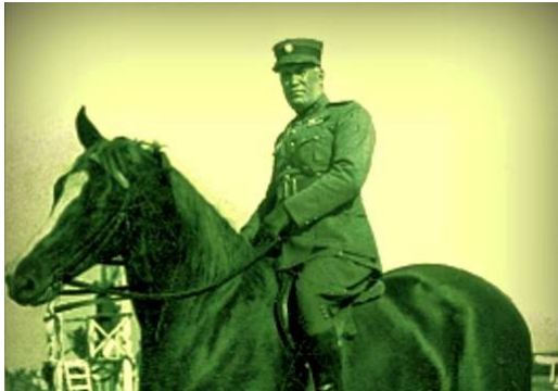
Εικόνα 6 Υπτιγος Στενωτάς Γεώργιος

Ωστόσο ο Βραχνός δεν είχε στρατεύματα. Η μεραρχία του δεν είχε επιστρατευθεί. Έτσι αναγκάστηκε να ρίξει στον αγώνα ότι είχε στη διάθεση του, όχι όμως για να αμυνθεί, αλλά για να επιτεθεί.