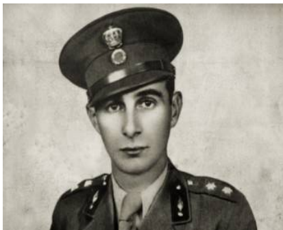
Εικόνα 8 Υπίλγος Διάκος Αλέξανδρος

Τάγματος Πεζικού, με επικεφαλής έναν υπολοχαγό, από τη σκλαβωμένη τότε Χάλκη των Δωδεκανήσων, τον Αλέξανδρο Διάκο.