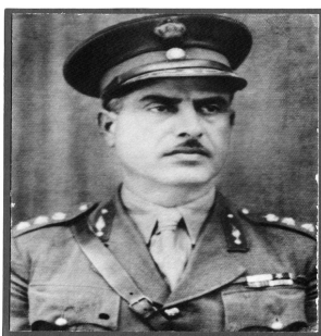
Εικόνα 7 Ανχης Μυσίρης Δ.

Έτσι την 31η Οκτωβρίου, ουσιαστικά στην Πίνδο είχαν φτάσει οι διοικήσεις των δύο σχηματισμών του ιππικού, η μεν της ΜΙ στο Μέτσοβο, η δε ΤΙ στο Δούτσικο Γρεβενών.