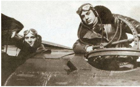
Εικόνα 10 Ανθσγος Γιάνναρης Ε.υάγγελος

Ήταν οι πρώτοι νεκροί Έλληνες αξιωματικοί του Ελληνικού Στρατού που σκοτώθηκαν στην Αλβανία.