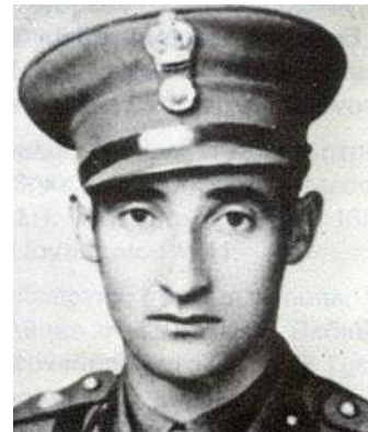
Εικόνα 9 εφ, Ανθλγος Ντάσκας Ελ.

Οι Ιταλοί όμως αντέταξαν λυσσαλέα αντίσταση. Ωστόσο η ελληνική λόγχη έκανε θαύματα και η Τσούκα καταλήφθηκε.