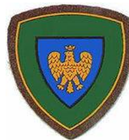
Εικόνα 1 Θυρεός Αλπινιστών Τζούλια

Στις 04.00 τα ξημερώματα της 28ης Οκτωβρίου μια επίλεκτη ιταλική μεραρχία, η 3η Μεραρχία Αλπινιστών (ΜΑ), η «Τζούλια», που έλαβε το όνομα της από τις Ιουλιανές Άλπεις, εισέβαλε στο ελλη-