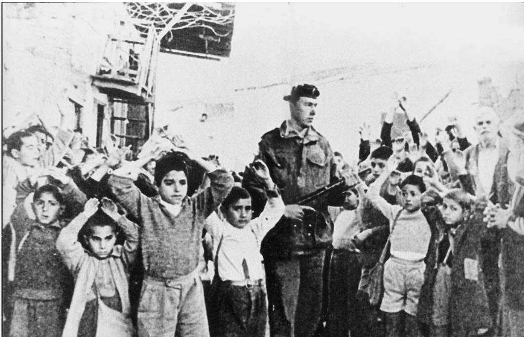
Ο Άγγλος στρατιώτης δεν μπορεί να τρομάξει με το όπλο του τα μικρά ελληνόπουλα του νησιού. Τα παιδάκια τον αντιμετωπίζουν με τα χέρια ψηλά και όρθια την ψυχή.