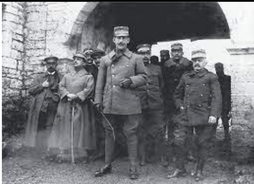
Χάρτης της Μάχης του Μπιζανίου. Ο Κωνσταντίνος στην Ήπειρο, στα αριστερά του ο Μεταξάς(με το ξίφος) και στα δεξιά του ο Δαγκλής.