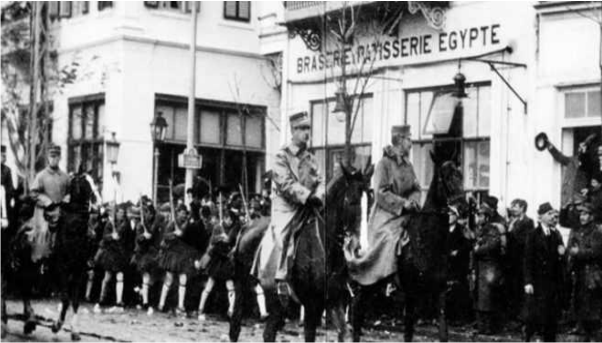
Η Είσοδος του Γεωργίου Α΄ με τον Κωνσταντίνο στην Θεσσαλονίκη.

Ο Τούρκος Στρατηγός Ταζίν Πασάς διοικητής του 8ου Σώματος Στρατού, αποδέχθηκε τελικά τους όρους που πρότεινε ο Κωνσταντίνος για την παράδοση της πόλεως. Την 26η Οκτωβρίου 1912, στις 23:00 υπογράφηκε το πρωτόκολλο παραδόσεως [8] της Θεσσαλονίκης. Οι παραδοθέντες ανέρχονταν σε 1.000 αξιωματικούς και 25.000 στρατιώτες με όλο τον οπλισμό τους [9] . Μετά από 482 χρόνια οθωμανικής δουλείας [10] , ο Λοχαγός του Μηχανικού Εξαδάκτυλος Αθανάσιος μαζί με τον Ίωνα Δραγούμη, ύψωσαν την γαλανόλευκη στο Ελληνικό Προξενείο στην παραλία. Την 28η Οκτ. την 11:00 ο Κωνσταντίνος με όλο το επιτελείο και την 1η ΜΠ, παρέλασε στην απελευθερωμένη Θεσσαλονίκη μέσα σε παραλήρημα χαράς των χριστιανών κατοίκων της. Την επομένη αφίχθηκε ο Βασιλέας Γεώργιος. Ο Ε.Σ πρόλαβε τον βουλγαρικό, ο οποίος έφθασε στην Θεσσαλονίκη με μία ημέρα καθυστέρηση [11] . Την 1η/13η Νοε. ο Ε.Σ αποβιβάσθηκε στην χερσόνησο του Άθως(Άγιον Όρος).