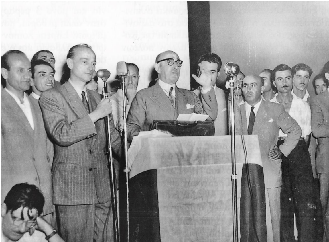
Ελληνικός Συναγερμός. Ο Αλ. Παπάγος με τον Κανελλόπουλο το 1952.

θήσε μαθήματα στο Σχολείο Ανωτέρων Σπουδών της Γαλλικής Στρατιωτικής Αποστολής, από όπου αποφοίτησε πρώτος.