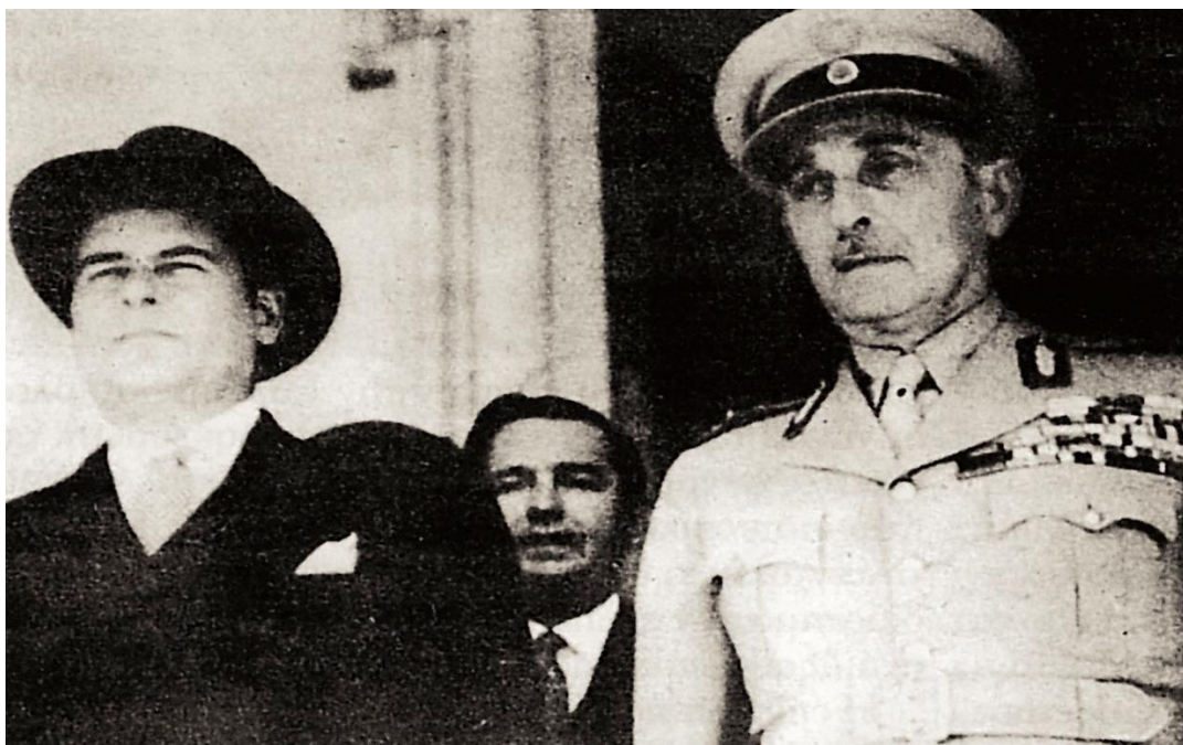
Με τον Αμερικανό πρέσβη Πιουριφόνι.

Ηπειρού. Όταν άρχισαν οι φήμες για ετοιμαζόμενη γερμανική εισβολή στην Ελλάδα, γεννήθηκε αμέσως το πρόβλημα τι θα γινόταν στο αλβανικό μέτωπο αν οι Γερμανοί χτυπούσαν τα βόρεια σύνορα της Μακεδονίας. Διαφωνεί με τους Άγγλους... Ήδη τον Φεβρουάριο του 1941 είχε φτάσει στην Αθήνα μια ομάδα Βρεταννών επισήμων: Ο υπουργός Εξωτερικών της Αγγλίας (και δεξί χέρι του Τσώρτσιλ) Άντονι Ηντεν, ο αρχηγός του Αυτοκρατορικού Γενικού Επιτελείου στρατηγός Ντιλ, ο αρχηγός των αεροπορικών δυνάμεων Μέσης Ανατολής στρατάρχης Λόνγκμορ και ο πλοίαρχος Ντίκυ, που εκπροσωπούσε τον βρετανικό στόλο της Μεσογείου.