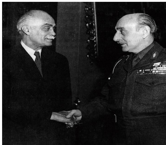
Με τον Πλαστήρα.

αναφέρει ότι η άρνηση του Παπάγου οφείλεται στην ελπίδα που είχαν οι Έλληνες στρατιωτικοί ότι, αν ο πόλεμος τελείωνε με νίκη των συμμάχων, η Ελλάδα θα μπορούσε να διεκδικήσει ένα μέρος της Αλβανίας, δηλαδή τη Βόρειο Ηπειρο. Αλλωστε, και σε μια έκθεση που είχε κάνει ο Παπάγος, στις 13 Μαρτίου 1940, έξι μήνες πριν από την ιταλική επίθεση, ζητούσε την «εκκαθάριση» της Αλβανίας σε περίπτωση πολέμου και βαλκανικής εκστρατείας των συμμάχων. Η προέλαση των Ελλήνων στην Αλβανία είχε αναζωπυρήσει αυτή την ελπίδα, αλλά η ανάσχεση της προέλασης και η εισβολή των Γερμανών έκαναν πολύ απίθανη μια τέτοια προοπτική. Ας σημειωθεί πως και ο ίδιος ο Μεταξός είχε αντιταχθεί, πριν από την ιταλική επίθεση, στο αγγλικό σχέδιο βρετανικής επιχείρησης στην Αλβανία με επικεφαλής τον εξόριστο βασιλέα της Αχμέτ Ζώγου και σχηματισμού προσωρινής αλβανικής κυβέρνησης, γιατί η αποκατάσταση του παλαιού καθεστώτος θα σήμαινε την απόδοση των βορειοηπειρωτικών εδαφών στη μεταπολεμική Αλβανία. Η στάση του Παπάγου έναντι των Βρεταννών δυσάρεστησε τον βασιλέα Γεώργιο Β', ο οποίος ήταν φυσικά αγγλόφιλος. Στις 21 Απριλίου 1941, δυο μέρες μετά την αυτοκτονία του πρωθυπουργού Κορυζή και την ανάληψη της πρωθυπουργίας από τον Εμ. Τσουδερό, ο βασιλιάς και η κυβέρνηση άρχισαν τις προετοιμασίες για την αναχώρησή τους από την Ελλάδα, και ταυτόχρονα η κυβέρνηση ενημέρωσε τον Ουίλσον για την επικείμενη παραίτηση του αρχιστρατήγου Παπάγου από το αξίωμά του και τη διάλυση του Γενικού Στρατηγείου.