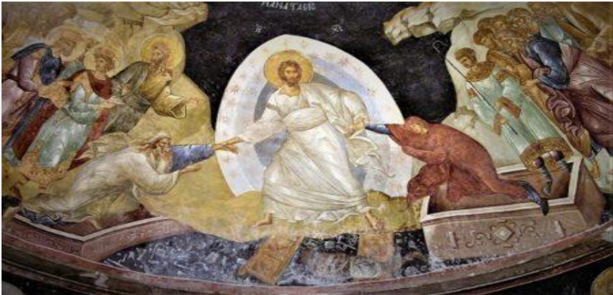
«Η Ανάστασις», (τοιχογραφία), Μονή της Χώρας, Κωνσταντινούπολη.

Και να που η δεινή τουρκική δύναμη πυρός επανακατάλαβε το «δικό της» μνημείο! Αυτήν την φορά με γυψοσανίδες και λοιπές πιο σύγχρονες τεχνικές για να κρύβονται τα πανέμορφα μωσαϊκά και οι τοιχογραφίες!