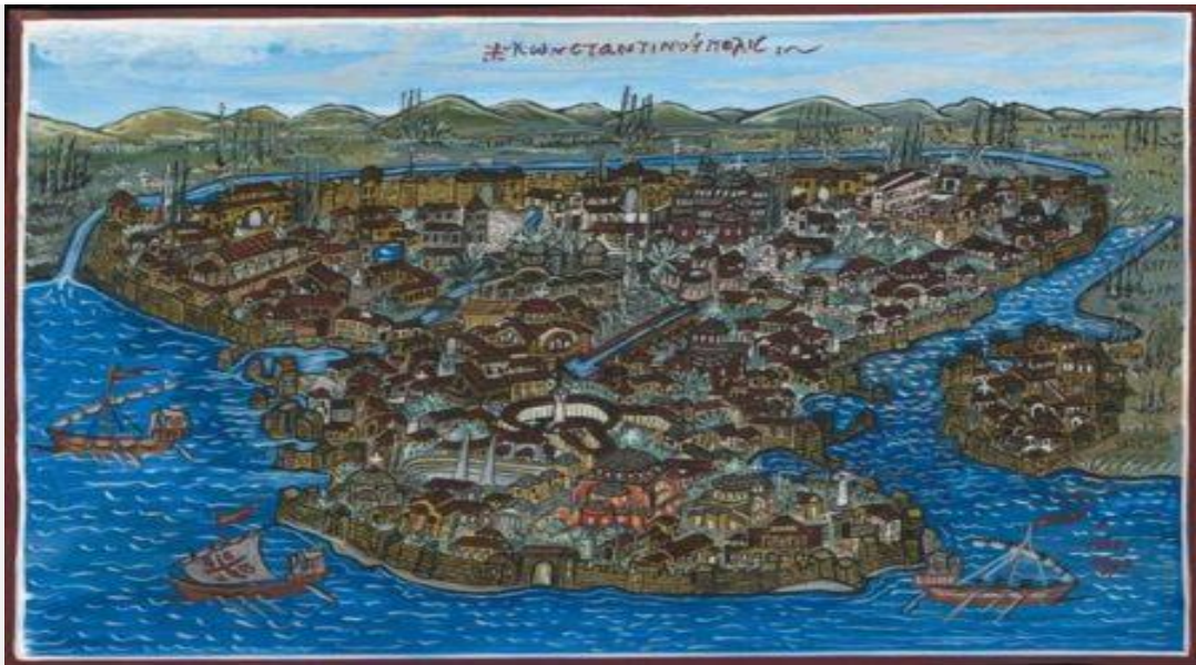
Ιερομόναχος Αναστάσιος: Κωνσταντινούπολις.

Άλλωστε σε ένα κράτος το οποίο μόνον Τούρκους δεν έχει, αλλά αποτελείται από μερικές δεκάδες εθνότητες και με Έλληνες Πόντιους κρυπτοχριστιανούς και Αρμένιους αντίστοιχους, αλλά και ντονμέδες, δηλαδή εξισλαμισθέντες Εβραίους τα πράγματα γίνονται ακόμη πιο δύσκολα! (Πριν από λίγα χρόνια ένα άρθρο σε τουρκική εφημερίδα υποστήριζε πως οι Θεσσαλονικείς ντονμέδες ελέγχουν την Τουρκία)! Και, έτσι, ο καθένας όταν θέλει να ανέβει ή να παραμείνει στην εξουσία θα πρέπει να πλειοδοτεί σε πατριωτισμό και οθωμανισμό ως καλός γενίτσαρος!