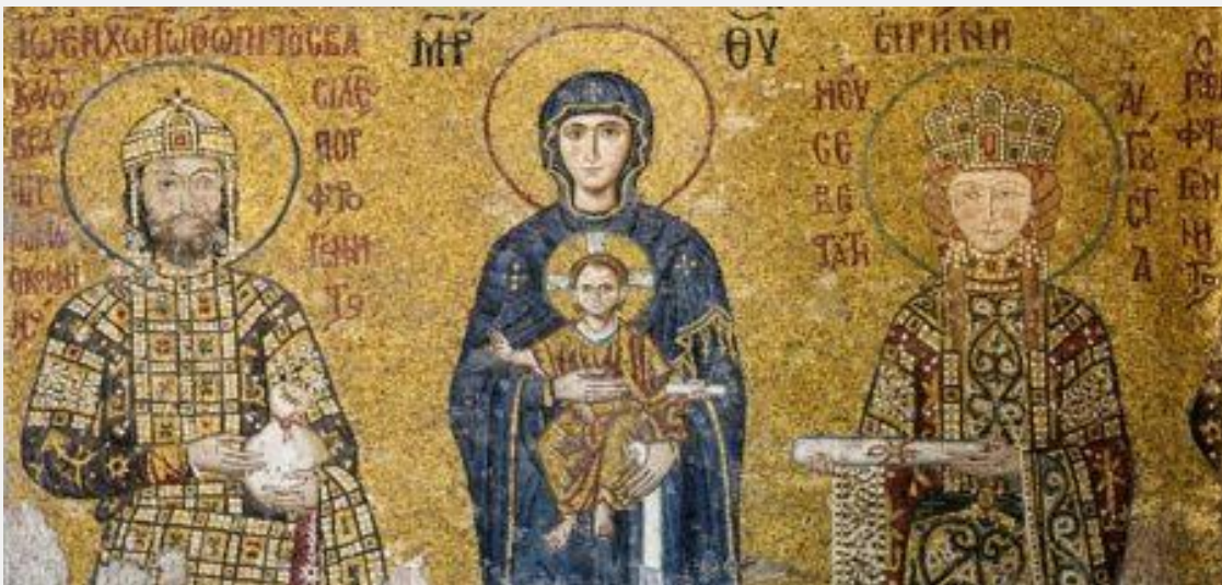
Η Υπεραγία Θεοτόκος με τον αυτοκράτορα Ιωάννη Β' Κομνηνό και την αυτοκράτειρα Ειρήνη.

Η 29η Μαΐου του 1453 μπουρίνι ήταν και πέρασε!