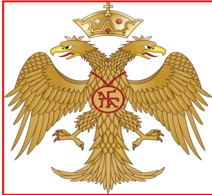
ΕΜΒΛΗΜΑ ΔΥΝΑΣΤΕΙΑΣ ΠΑΛΑΙΟΛΟΓΩΝ.

Γράφει ο Ευάγγελος Γριβάκος, Αντιστράτηγος ε.α- Νομικός.