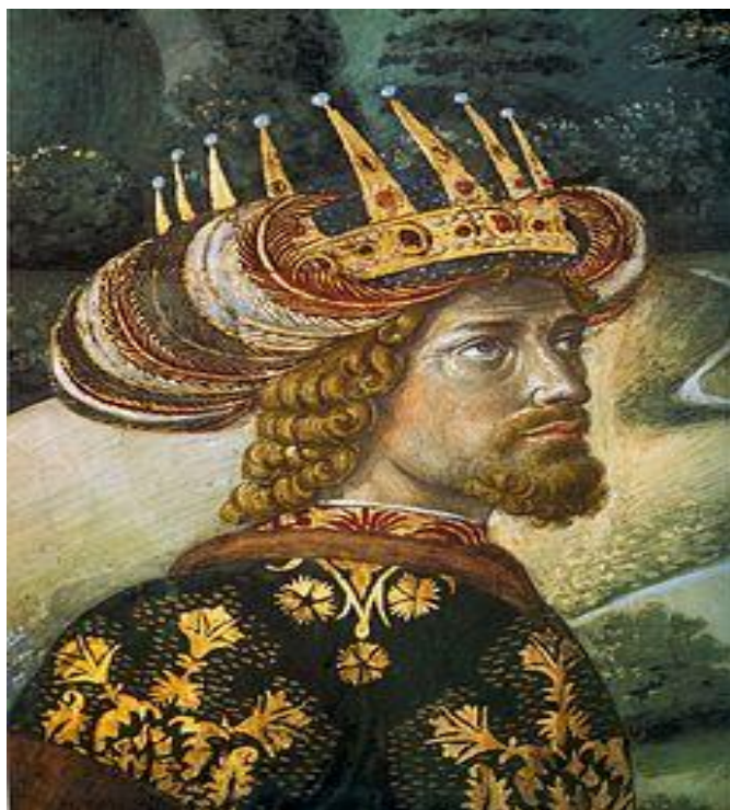
Ο Αυτοκράτωρ Ιωάννης Η΄ Παλαιολόγος σε τοιχογραφία του Β. Gozzoli στο Παλάτι των Μεδίκων στη Φλωρεντία.

Παράλληλα, οι σταυροφορικές εκστρατείες που οργανώθηκαν από τον Πάπα με επικεφαλής τους Ούγγρους ηγέτες Δαδισδάο και Ουνιάδη καθώς και με τον Σέρβο Μπράνκεβιτς, κατέληξαν σε διαδοχικές τραγικές ήττες στην Βάρνα (1444) και το Κόσοβο (1448). Ο Ιωάννης βαθεία απογοητευμένος για την αποτυχία των προσδοκιών του, πέθανε την 3 η Οκτωβρίου 1448. Τον διαδέχθηκε στον θρόνο ο κατά 15 έτη μικρότερος αδελφός του Κωνσταντίνος ΙΑ΄ Παλαιολόγος, τελευταίος αυτοκράτορας του Βυζαντίου . Οι συνθήκες διαδοχής θα αναφερθούν κατωτέρω.