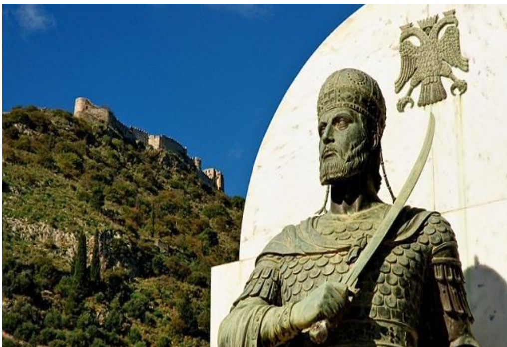
Ανδριάντας του Κωνσταντίνου ΙΑ΄ Παλαιολόγου Δεσπότη του Μυστρά.

Ο Μουράτ θορυβήθηκε από την διαμορθωθείσα κατάσταση και τον Μάρτιο 1446, με δύναμη 60.000 ανδρών ξεχύθηκε στην Θεσσαλία, πέρασε στην Στερεά Ελλάδα και πολιορκήσε το τείχος του Εξαμιλίου, στον Ισθμό, όπου αμύνονταν ο στρατός του Κωνσταντίνου. Στην κρίσιμη φάση του αγώνα, οι Αλβανοί φύλαρχοι της Πελοποννήσου, εξαγορασθέντες από τον Μουράτ στις αρχές Φεβρουαρίου 1447, εγκατέλειψαν τον Κωνσταντίνο ο οποίος, με μεγάλες απώλειες, αναγκάσθηκε να υποχωρήσει άτακτα στο εσωτερικό της χώρας. Η καταδίωξη των Οθωμανών ταχέως επεκτάθηκε σε ολόκληρη σχεδόν την Πελοπόννησο, πλην Μάνης και φρουρίου Πάτρας που παρέμεινε άπαρτο. Αίφνης ο Μουράτ αναγκάστηκε να εγκαταλείψει τον Μωρέα διότι ο Σκεντέρμπεης ενεργούσε επικίνδυνα στα νώτα του, στην Ήπειρο, και τον απειλούσε σοβαρά με εγκλωβισμό. Αποχωρώντας έσυρε μαζί του χιλιάδες αιχμαλώτους και ανάγκασε τους Παλαιολόγους να αναγνωρίσουν την κυριαρχία του και να γίνουν φόρου υποτελείς σε αυτόν.