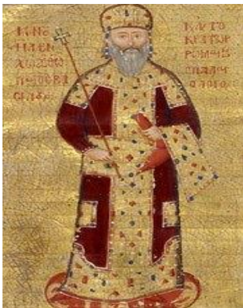
Ο ΜΑΝΟΥΗΛ Β΄.

Το 1421, μετά από μακρά περίοδο ειρήνης, ο Μανουήλ αποφασίζει να συμβασιλεύσει με τον πρωτότοκο υιό του Ιωάννη Η΄ Παλαιολόγο στον οποίον, μάλιστα, μεταβίβασε σχεδόν όλες τις εξουσίες του κράτους. Το επόμενο έτος (1422), ο διαδεχθείς τον Μωάμεθ Α΄ νέος Σουλτάνος Μουράτ Β΄ , επανέλαβε την πολιορκία της Κωνσταντινουπόλεως και συγχρόνως επεκτάθηκε στην νότιο Ελλάδα, λεηλατώντας την Πελοπόννησο και καταστρέφοντας το τείχος στο Εξαμίλι Κορίνθου που είχε ανακαινίσει ο Μανουήλ για την προστασία ολόκληρης της Πελοποννήσου. Με την συναφθείσα το 1424 ταπεινωτική για τους βυζαντινούς συνθήκη ειρήνης, ο Μουράτ έλυσε την πολιορκία της Κωνσταντινουπόλεως αλλά ο Μανουήλ, με την συναίνεση και του συμβασιλεύοντος Ιωάννη, αναγκάστηκε να παραχωρήσει σε αυτόν φρούρια μακεδονικών και θρακικών πόλεων και να καταβάλλει φόρους υποτελείας στον Μουράτ. Τον Μάρτιο 1425, ο Μανουήλ, αφού παρέδωσε τελείως τον θρόνο στον Ιωάννη, απεσύρθη στην Μονή του Παντοκράτορος στην Κωνσταντινούπολη όπου εκάρη μοναχός με το όνομα Ματθαίος, αλλά μετά από τέσσερις μήνες πέθανε. Υπήρξε πραγματικός ηγέτης και μεγάλος φιλόσοφος και θεολόγος που άφησε αξιόλογο συγγραφικό έργο με επιστολές, ποιήματα, βίους Αγίων, θεολογικά και ρητορικά δοκίμια.