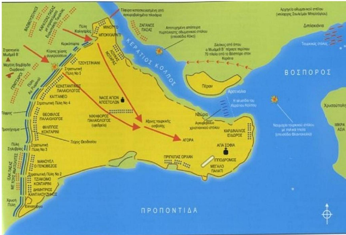
Οι θέσεις Βυζαντινών και Τούρκων κατά τη διάρκεια της πολιορκίας της Πόλης.