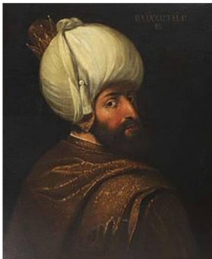
Εικόνα 3 Βαγιαζήτ Α'

Οι τελευταίοι αυτοκράτορες προσπαθούν να προσελκύσουν τους εχθρούς της αυτοκρατορίας, με οθωμανικά γαμήλια συνοικέσια και ταξίδια προς τη Δύση, «επαίτες μιας βοήθειας η οποία ουδέποτε απάντησε στις προσδοκίες των Βυζαντινών».