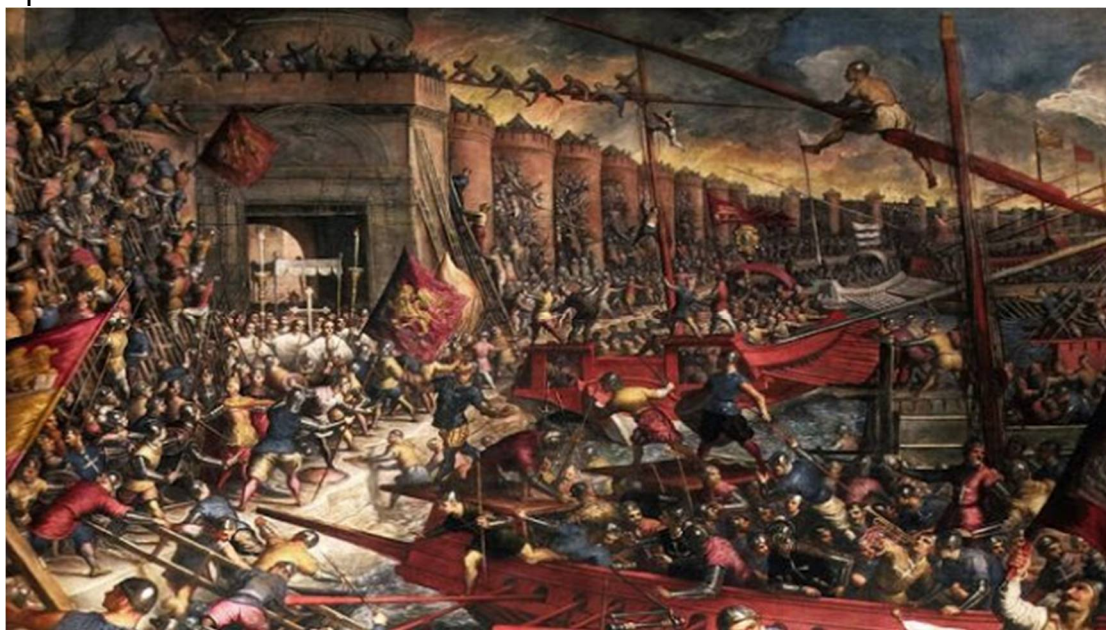
Εικόνα 1 Κατάκτηση της Πόλης από τους Λατίνους 13 Απριλίου 1204

Αρκετοί θεωρούν ότι η αρχή της μεγάλης πτώσης ήταν η άλωση της Πόλης από τους Λατίνους του 13 Απριλίου 1204, από την οποία η Αυτοκρατορία - παρά την ανάκτηση της Κωνσταντινούπολης το 1261- δεν ανέκαμψε ποτέ, ενώ άλλοι εκτιμούν ότι η πορεία προς την καταστροφή είχε αρχίσει πολλά χρόνια πριν.