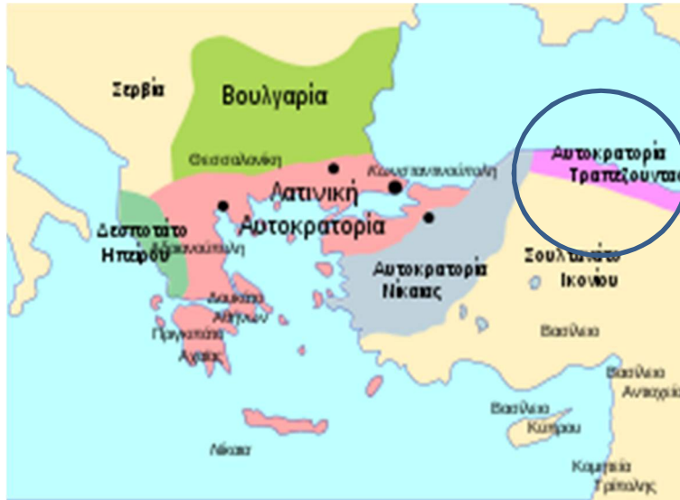
Εικόνα 9 Αυτοκρατορία Τραπεζούντας

Το βυζαντινό κράτος έπαψε να υπάρχει και για ολόκληρο τον ελληνισμό άρχισαν οι ατέλειωτοι αιώνες της τουρκικής δουλείας.