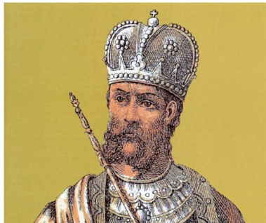
Εικόνα 2 Μανουήλ Β'

Η Φιλαδέλφεια θα παραμείνει ελεύθερη ως το 1391, με την πτώση της να σηματοδοτεί το οριστικό τέλος της βυζαντινής Μικράς Ασίας, αλλά και «δηλώνει την ηθική παρακμή που γνωρίζει η αυτοκρατορία, της οποίας ο αυτοκράτορας (Μανουήλ Β' Παλαιολόγος) φέρεται να έχει εκστρατεύσει κατά της ελληνικής