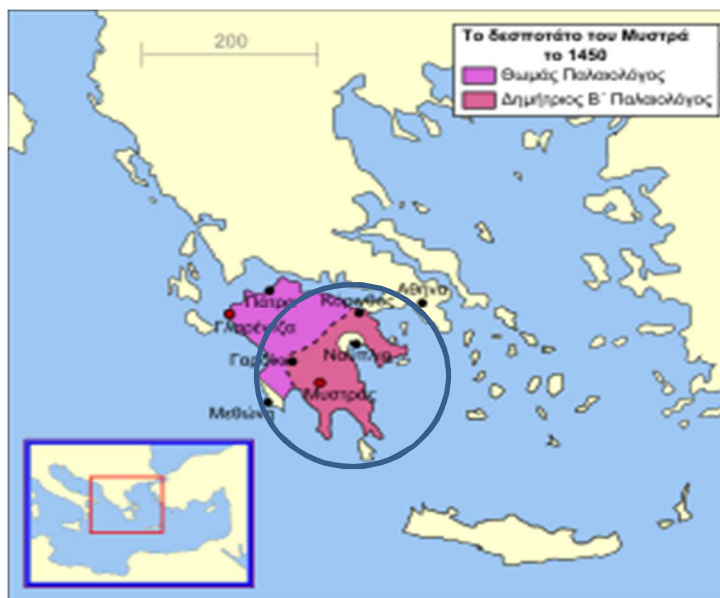
Εικόνα 8 Δεσποτάτο Μωρέως - Μυστρά

Οι Τούρκοι κατέλαβαν το Δεσποτάτο του Μορέως το 1460 και κατέλυσαν την αυτοκρατορία της Τραπεζούντας το 1461.