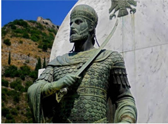
Εικόνα 5 Κων/νος ΙΑ΄ Παλαιολόγος

Το Ρούμελι Χισάρ και το Ανατολού Χισάρ, στην απέναντι ασιατική ακτή, απέκοπταν τη θαλάσσια επικοινωνία της Πόλης, ενώ παράλληλα η εισβολή του Τουραχάν Μπέη στην Πελοπόννησο διασφάλιζε τη μη αποστολή ενισχύσεων από το Δεσποτάτο του Μυστρά.