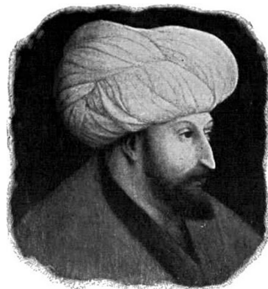
Εικόνα 4 Μωάμεθ Β' "Πορθητής"

Η κατάκτηση της Κωνσταντινούπολης, σύμφωνα με αναφορές, του είχε γίνει έμμονη ιδέα και ως εκ τούτου η διοργάνωση της πολιορκίας είχε αρχίσει με προσοχή και λεπτομερή σχεδιασμό, βασικό τμήμα του οποίου ήταν η κατασκευή του