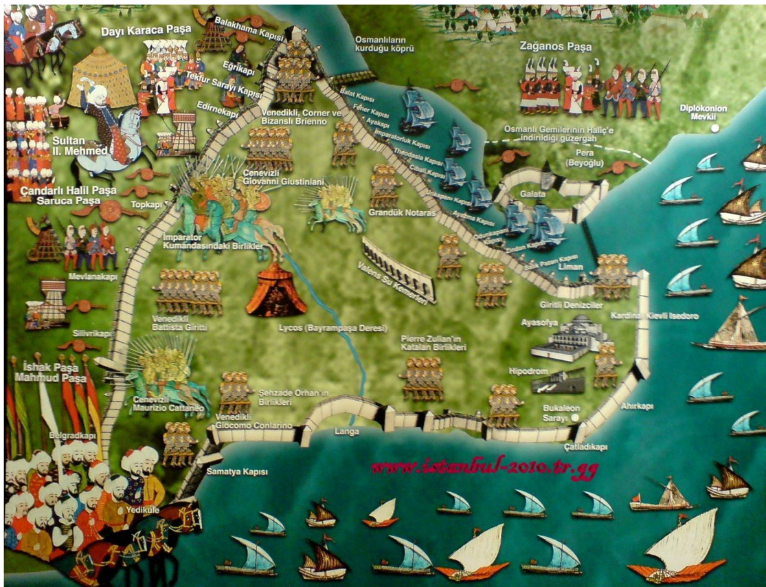
Οι θέσεις Βυζαντινών και Τούρκων κατά τη διάρκεια της πολιορκίας της Πόλης.

Οι Έλληνες δεν είχαν μόνο να παλέψουν μόνο με τον εξωτερικό εχθρό. Η κατάσταση μέσα στην άλλοτε μεγάλη πρωτεύουσα δεν ήταν καθόλου ενθαρρυντική.