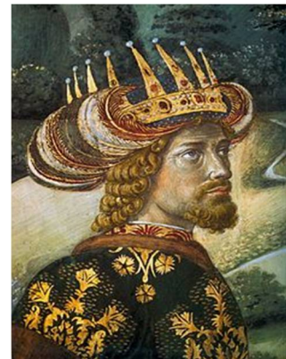
Εικόνα 6 Ιωάννης Η΄ Παλαιολόγος

Όταν το 1451 ο Μωάμεθ Β΄ ο Πορθητής διαδέχτηκε το Μουράτ Β΄ δεν έμεινε καμιά αμφιβολία ότι ο νεαρός σουλτάνος θα στρεφόταν κατά της Κωνσταντινούπολεως και θα προσπαθούσε να δώσει στο μεγάλο πια κράτος του, που απλωνόταν σε Ασία και Ευρώπη, τη φυσική του πρωτεύουσα.