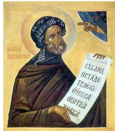
Εικόνα 2 Άγιος Ιωσήφ Ύμνογράφος

την τέταρτη (Δ' Χαιρετισμοί) τους Τ-Ω και