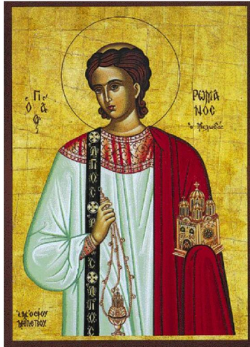
Εικόνα 1 Άγιος Ρωμανός Μελωδός

Το ποιος και το πότε βεβαίως είναι αλληλένδετα, αλλά σε όλη τη χειρόγραφη παράδοση ο ύμνος φέρεται ως ανώνυμος, ενώ ο Συναξαριστής που τον συνδέει με τα γεγονότα του Αυγούστου του 626 δεν αναφέρει ούτε το χρόνο της σύνθεσής του, ούτε τον μελωδό του.