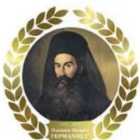
Παλαιών Πατρών Γερμανός Γ!