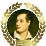
Lord Georges Byron