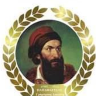
Γρηγ. Δικαίος Παπαφλέσσας