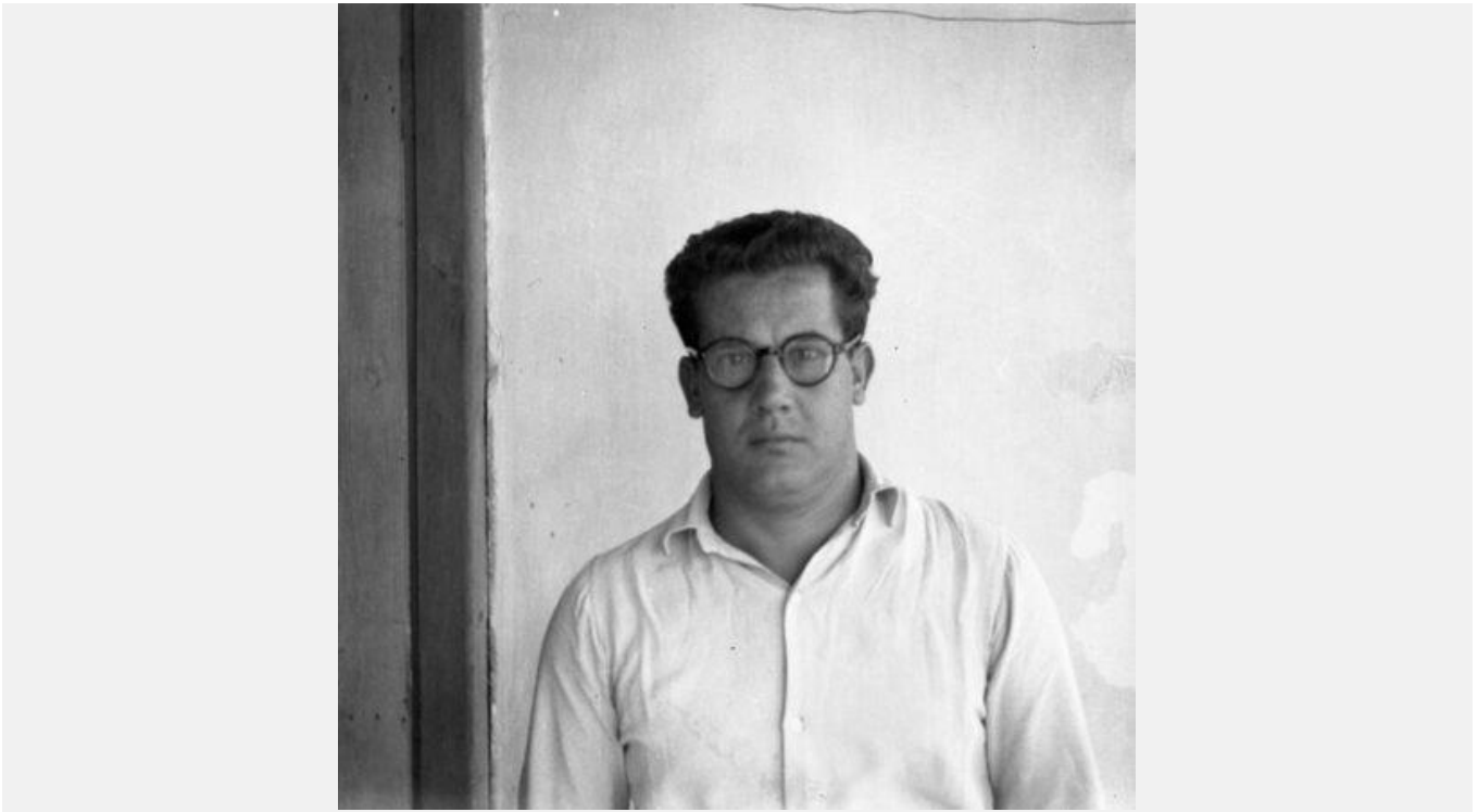
Ο ήρωας Κυριάκος Μάτσης (1926-1958) ενώ ήταν καταζητούμενος.

Και, βέβαια, όλα αυτά όχι για να κάνει το κομμάτι του αλλά υπέρ αρετής! Δηλαδή ελευθερίας! Ελευθερίας με προσωπικό τίμημα και όχι τιμή με την έννοια του price των αγγλικών επικηρύξεων! Αλλά με τιμή και τιμιότητα! Με την αξιοπρέπεια της διεκδίκησης της ελευθερίας και εν προκειμένω την ένωση με την Ελλάδα για την οποία αγωνιστήκατε!