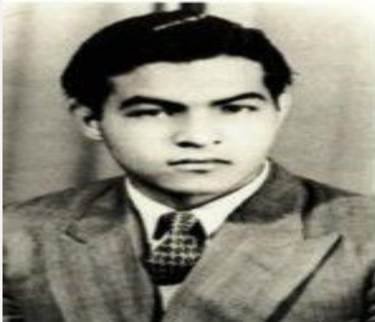
Οι ήρωες Μ. Καραολής και Α. Δημητρίου.