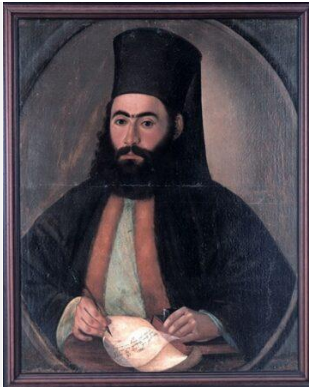
Ο Νεομάρτυρας, Αρχιεπίσκοπος Κύπρου Κυπριανός (1756-1821).

Και μαρτύρησες στον κόσμο πως και αυτή η Ελληνική Επανάσταση η Κυπριακή, ήταν μια παράτολμη επιχείρηση ελληνικής αξιοπρέπειας, δηλαδή μαρτυρία και αγωνία αρετής, ελευθερίας! Και πως και αυτή η ελληνική μαρτυρία ήταν μαρτύριο, “απ’ τα κόκαλα βγαλμένη”! Και η δική σου, αν μου επιτρέπεις, και από τις καμένες σάρκες σου! Απ’ τα κόκαλα και τις σάρκες των Ελλήνων τις ιερές, “χαίρε ω χαίρε λευτεριά”! Έτσι, λοιπόν, γράφεται η ιστορία και όχι με υποθέσεις εργασίας «’διοτέλειας» και συμφέροντος! Ιδεολογικού, κομματικού.