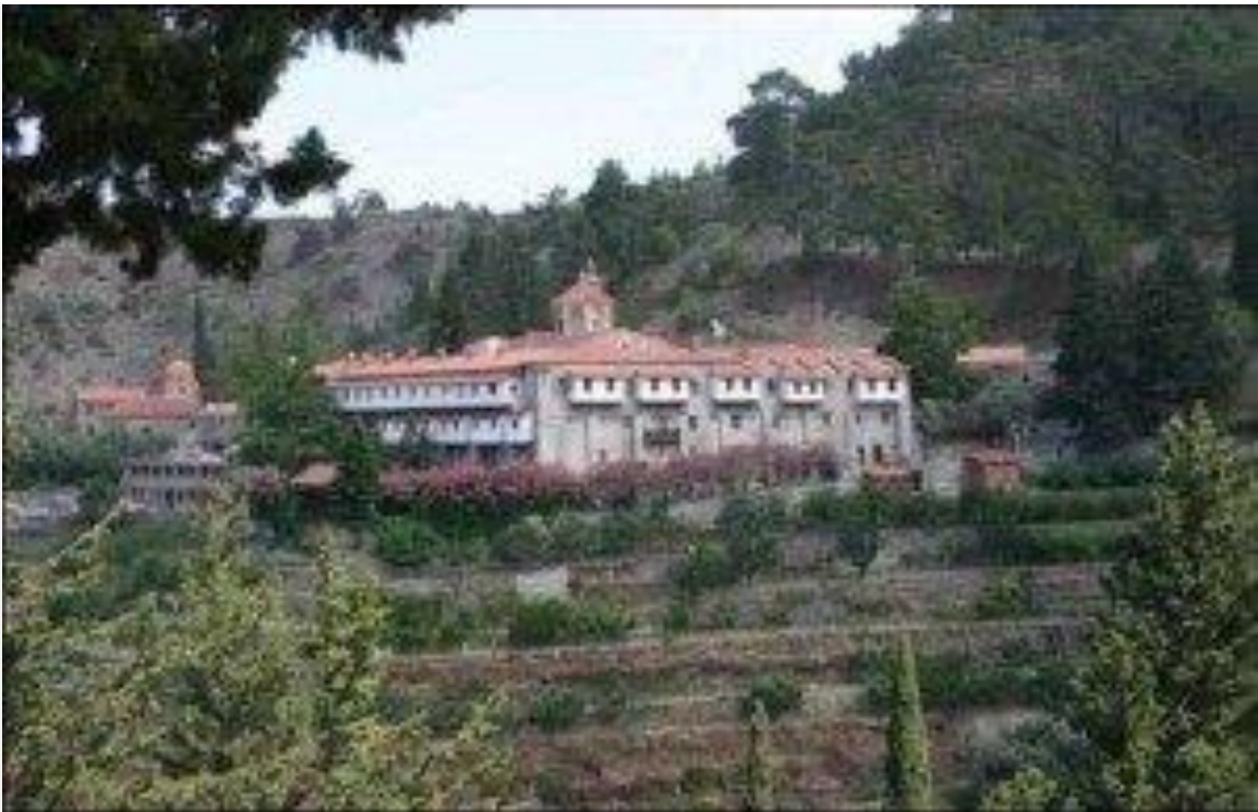
Η Ιερά Βασιλική και Σταυριπηγιακή Μονή Μαχαιρά, Κύπρος.

Σήμερα, λοιπόν, Γρηγόρη, που είναι 28 Φεβρουαρίου του 2021 και είμαστε μόλις τρεις μέρες πριν από την επέτειο σου, την γενέθλιο ημέρα σου στην αιωνιότητα και την αθανασία, κάθομαι και σε σκέφτομαι και σένα και το δεινό και ένδοξο ολοκαύτωμα σου! Και, μάλιστα, σε σκέφτομαι ανάμεσα στους λοιπούς ήρωες του ελληνισμού. Τους μάρτυρές μας!