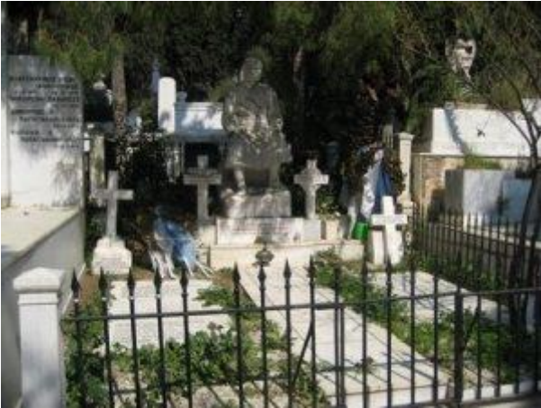
Τάφος του Κολοκοτρώνη στο Α' κοιμητήριο Αθηνών