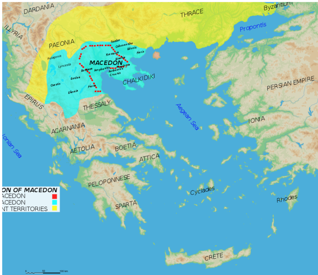
Το κράτος του Φιλίππου Β΄. Η διακεκομμένη κόκκινη γραμμή καθορίζει τα όρια προ του Φιλίππου και το γαλάζιο χρώμα τα όρια της επέκτασης του κράτους από τον Φίλιππο. (336 π.Χ).

ελληνικών πόλεων, όμως το καλοκαίρι του ίδιου έτους δολοφονείται στις Αίγες και τα σχέδια για την Ασία ματαιώνονται. Σε μικρό σχετικά χρονικό διάστημα, κατόρθωσε να ενώσει τους Έλληνες, να αναδείξει την Μακεδονία ως την μεγαλύτερη δύναμη της Ευρώπης και να δημιουργήσει προϋποθέσεις για μια νέα εποχή.