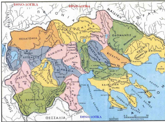
Η Μακεδονία κατά Επαρχίες επί Αλεξάνδρου Α΄

Ηρόδοτος αναφέρει ότι ο Αλέξανδρος Α΄ κατά την εποχή των περσικών πολέμων φέρεται να δικαιολόγησε τον φιλελληνισμό του λέγοντας : «Αυτός τε γαρ Έλλην γένος εμί τωρχαίων, και αντ΄ ελεύθερης δεδουλωμένην ουκ αν εθέλοιμι οράν την Ελλάδα» (IX 45, 1-2). Μετά τη λήξη της περσικής εισβολής, βρήκε την ευκαιρία να επεκτείνει το βασίλειό του προς τα δυτικά, απωθώντας τους Παίονες από την κάτω κοιλάδα του Αξιού και επιβάλλοντας υποτέλεια στους ηγεμόνες των τεσσάρων γειτονικών λαών (Ορέστες, Λυγκηστές ( στην σημερινή περιοχή Φλώρινας), Πελαγονέες, Ελυμιώτες , (δυτικά της σημερινής Κοζάνης). Στη συνέχεια, κατέστησε υποτελείς τους Βισάλτες και τους Κρηστωνούς (θρακικά φύλα δυτικά του ποταμού Στρυμόνα), φθάνοντας μέχρι την Πύδνα και την Θέρμη Θερμαϊκού. Έλαβε μέρος στους Ολυμπιακούς αγώνες του 504 π.Χ. , αφού, προτούτερα, οι Ελλανοδίκες τον αποδέχθηκαν ως Έλληνα , όταν ο ίδιος επικαλέσθηκε και απέδειξε ότι κατάγεται από τους Τημενίδες του Άργους. Και αυτή η αναγνώριση, μεταξύ άλλων, αποτελεί ένα ακόμη αμάχητο τεκμήριο της ελληνικότητας των Μακεδόνων και της Μακεδονίας.