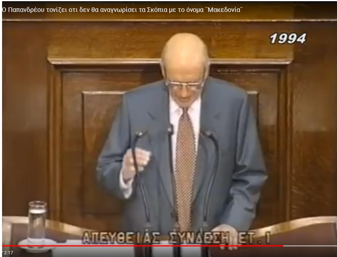
Έκθ. 3: Ο Ανδρέας Παπανδρέου στο βήμα τής Βουλής τών Ελλήνων (27/1/1994)

Μια τέτοια νέα Συνθήκη όμως θα ήταν έγκυρη μόνον εάν συνυπεγράφετο, όχι μόνον από τις δύο χώρες (Ελλάδα και Βουλγαρία) που σχετίζονται άμεσα με τό (Τιτοϊκό) «Μακεδονικό Ζήτημα», αλλά και από όλες τις άλλες (5) χώρες που συνυπέγραψαν τήν Συνθήκη Ειρήνης τού Βουκουρεστίου (Βουλγαρία, Ελλάδα, Μαυροβούνιο, Ρουμανία, Σερβία). Τέτοια δε νέα Συνθήκη ουδέποτε συνετάχθη και ουδέποτε συνυπεγράφη, τουλάχιστον μέχρι τό 2018.