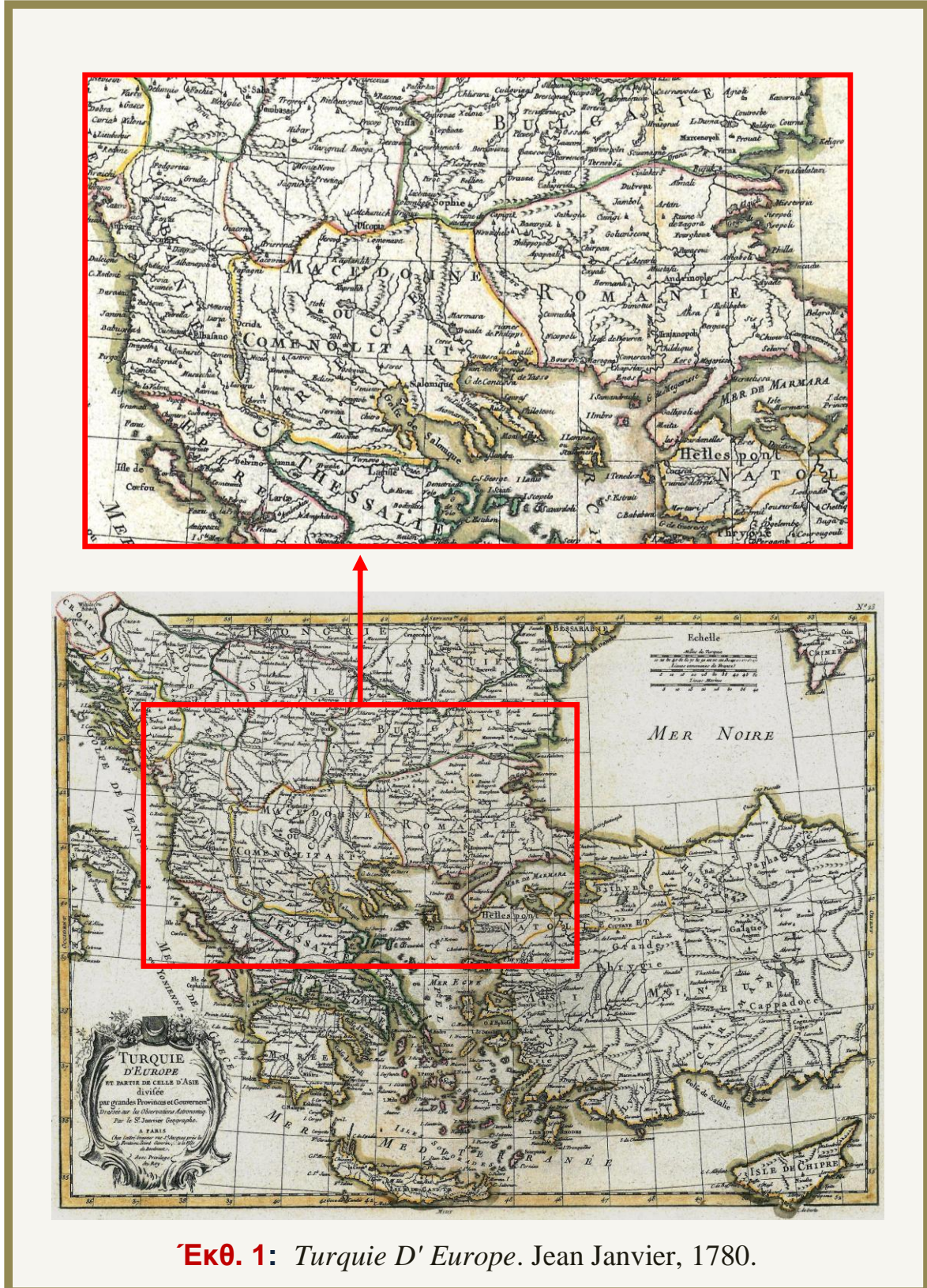
Έκθ. 1: Turquie D' Europe . Jean Janvier, 1780.

της Εσωτερικής Μακεδονικής Επαναστατικής Οργάνωσης (IMRO) , τών οποίων οι ηγέτες— Τόντορ Αλεξάντροφ, Αλεξάνταρ Πρωτογκέροφ και Ιβάν Μιχαΐλοφ—είχαν ως στόχο τήν ανεξαρτησία ολόκληρης τής « γεωγραφικής Μακεδονίας ». Τό 1918 η Βουλγαρική κυβέρνηση τού Αλεξάντερ Μαλινόφ προσφέρθηκε να συνεισφέρει τήν περιοχή τού Μπλαγκόεβγκραντ (Μακεδονία τού Πιρίν) γι' αυτόν τόν σκοπό. Επιπλέον, η Κομιντέρν (Τρίτη Διεθνής) εξέδωσε ένα