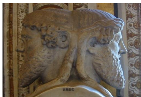
Εικόνα 3 Ιανός

Στον κοσμογονικό μύθο Πρωτέας που σημαίνει ο Πρώτος, ο Πρωτογέννητος, ο πρωτόγονος, μορφή δηλαδή που γεννά τις άλλες μορφές που συγκρατούν τον κόσμο, είναι, δηλαδή, η πρώτη μορφή ύλης (η γενετική δύναμη του νερού).