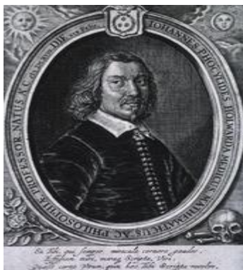
Εικόνα 1 Φωκυλίδης ο Μιλήσιος

«Μισώ τον άνδρα τον διπλόν πεφυκότα, χρηστόν λόγοισι, πολέμιον δε τοις τρόποις» (μτφρ: μισώ τον διπρόσωπο που είναι αγαθός στα λόγια αλλά εχθρικός στις πράξεις ) και