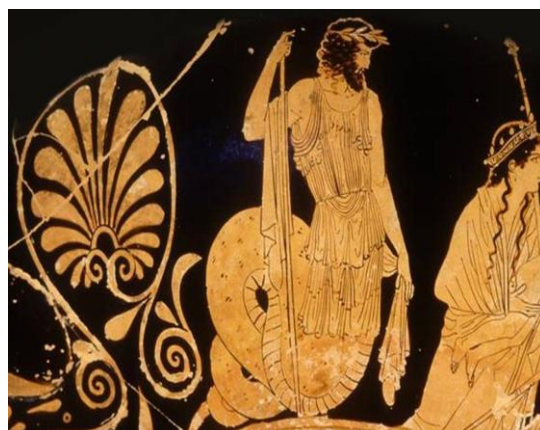
Εικόνα 2 Πρωτέας

Όταν κάποιος ήθελε να μάθει κάτι για το μέλλον του, τότε πλησίαζε τον Πρωτέα ο οποίος με τη σειρά του για να αποφύγει αυτό το έργο άλλαζε μορφές και μεταμορφωνόταν σε κάθε είδος σχήμα και θαύμα της φύσης.