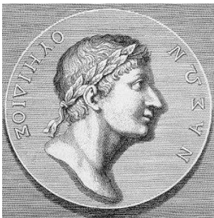
Εικόνα 4 Οβίδιος ο Λατίνος

Γι' αυτό και του αφιέρωσαν τον Ιανουάριο που σαν πρώτος μήνας του χρόνου, κοιτάζε προς τον προηγούμενο χρόνο και προς τον επόμενο. Εμφανής είναι, λοιπόν, η «συγγένεια» της διπροσωπίας – διπρόσωπου με τον Ιανό.