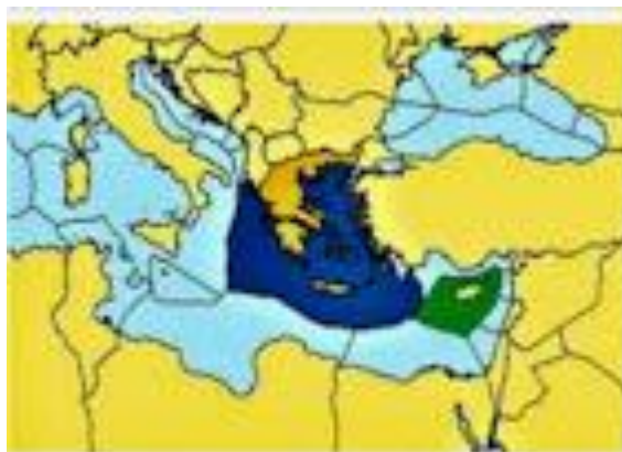
Χάρτης προθέσεως ΑΟΖ Ελλάδας-Κύπρου.

- Δειλιάζετε να πράξετε ό,τι η πληγωμένη Μεγαλόνησος έκανε με Λίβανο, Ισραήλ και Αίγυπτο και δεν υπογράφετε καθορισμό ΑΟΖ με την Κύπρο..