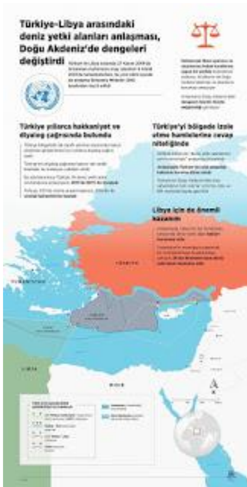
Χάρτης Υπουργείου Εξωτερικών Η.Π.Α