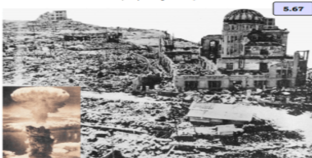
Η κατεστραμμένη πόλη της Χιροσίμα, μετά τη ρίψη της πρώτης ατομικής βόμβας (6.8.1945)

■ Ποιες καταστροφές εικονίζονται; [5.66] & [5.67]