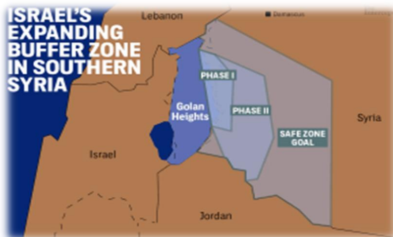
Χάρτη 1: Απαιτήσεις Ισραήλ περί “ζώνης ασφαλείας.

Από την πρώτη μέρα εμφάνισης της “Συριακής Άνοιξης” στην πόλη Daraa (15/3/2011), οι Ισραηλινές Αρχές έχοντας υπόψη τα γεγονότα που συνοδεύουν την “Αραβική Άνοιξη”, εγείρουν θέμα ασφάλειας για τη χώρα τους: