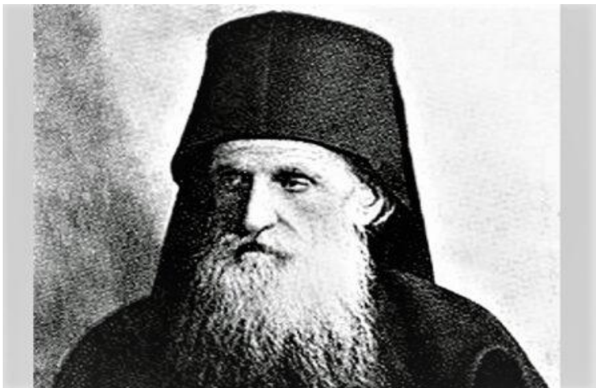
Ο Όσιος Δανιήλ Κατουνακιώτης.

Συγκεκριμένα αγιοκατάχθηκαν οι Αγιορείτες, Εφραίμ Κατουνακιώτης, Δανιήλ Κατουνακιώτης και ο Ιωσήφ Ησυχαστής όπως προαναφέρθηκε.