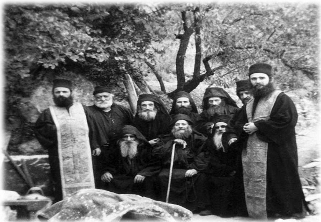
ΑΓΙΟΣ ΙΩΣΗΦ ΗΣΥΧΑΣΤΗΣ [1898 – 1959]: Η ΣΠΟΥΔΑΙΟΤΕΡΗ ΚΛΗΡΟΝΟΜΙΑ.

Κατ' αυτήν την ημέρα, όπου οι καμπάνες σε όλα τα μήκη και τα πλάτη της Χερσονήσου του Άθωνα, ηχούν χαρμόсуна για το νέον Άγιον της Πίστεως και γνήσιο τέκνο του Περιβολιού της Παναγίας, το Πρακτορείο «ΟΡΘΟΔΟΞΙΑ» αναφέρεται στην σπουδαιότερη πνευματική κληρονομιά, την οποία παραδίδει ο Άγιος Ιωσήφ ο Ησυχαστής προς τις επόμενες γενεές και η οποία έγκειται στην επαναφορά της διδαχής της νοεράς προσευχής και την φιλόπονο καλλιέργεια της ευχής: «Κύριε Ιησού Χριστέ, ελέησόν με».