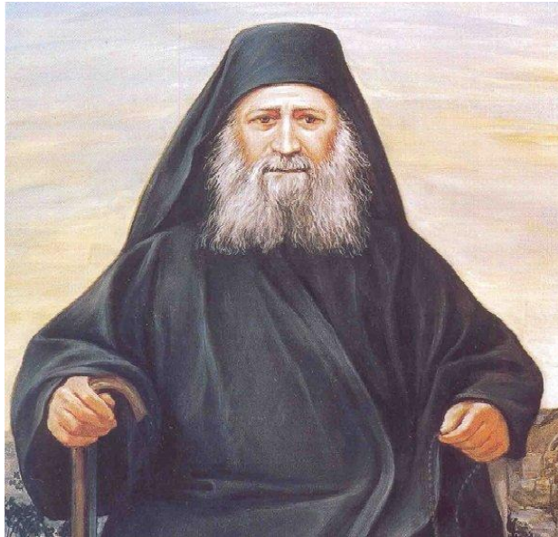
Όσιος Ιωσήφ ο Ησυχαστής.

Κατ' αυτήν την ημέρα, όπου οι καμπάνες σε όλα τα μήκη και τα πλάτη της Χερσονήσου του Άθωνα, ηχούν χαρμόсуна για το νέον Άγιον της Πίστεως και γνήσιο τέκνο του Περιβολιού της Παναγίας, το Πρακτορείο «ΟΡΘΟΔΟΞΙΑ» αναφέρεται στην σπουδαιότερη πνευματική κληρονομιά, την οποία παραδίδει ο Άγιος Ιωσήφ ο Ησυχαστής προς τις επόμενες γενεές και η οποία έγκειται στην επαναφορά της διδαχής της νοεράς προσευχής και την φιλόπονο καλλιέργεια της ευχής: «Κύριε Ιησού Χριστέ, ελέησόν με».