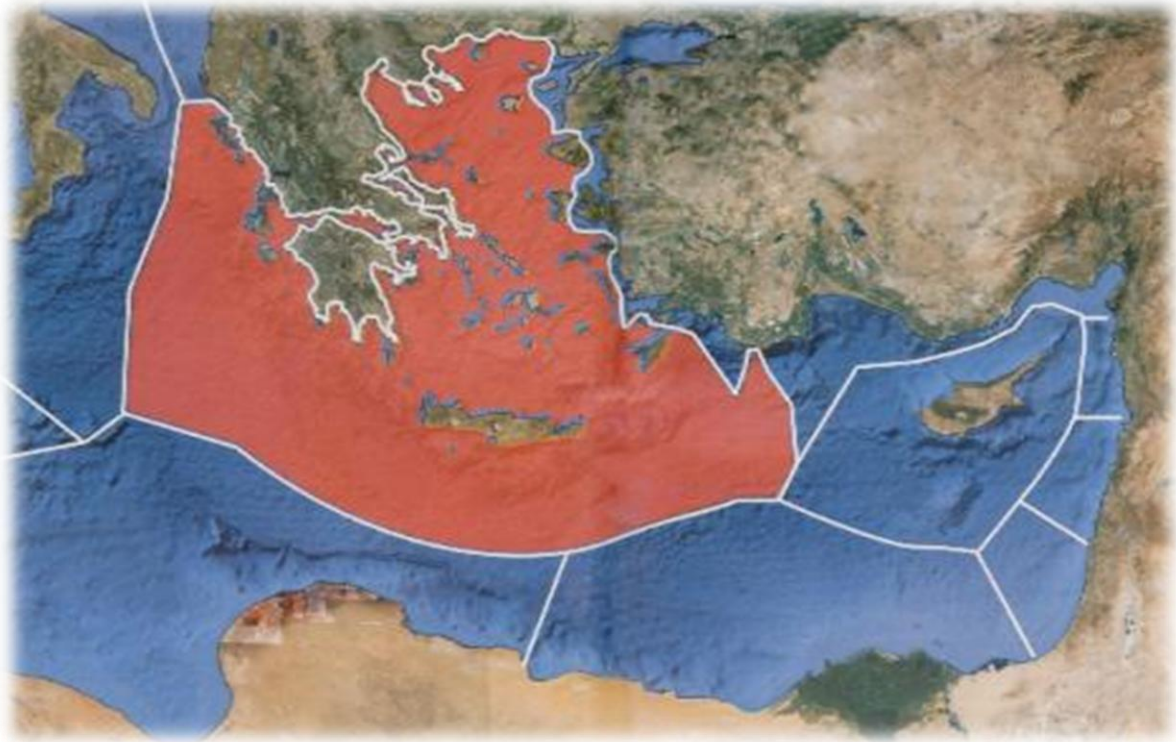
Η Αποκλειστική Οικονομική Ζώνη της Ελλάδας.