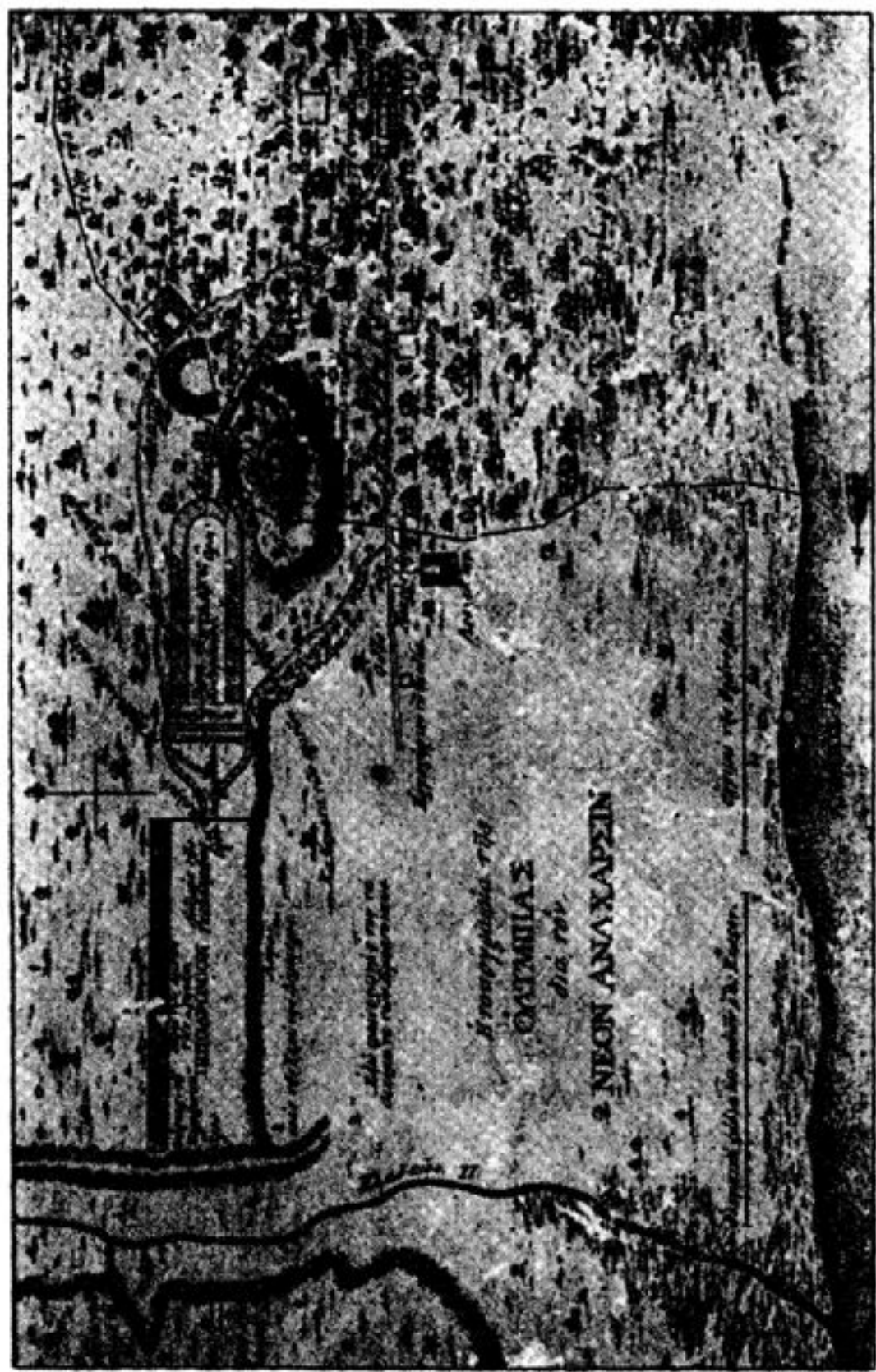
«Ἡ τοπογραφία τῆς Ὀλυμπίας». Λεπτομέρεια τῆς Χάρτας τῆς Ἑλλάδος, Βιέννη 1797.