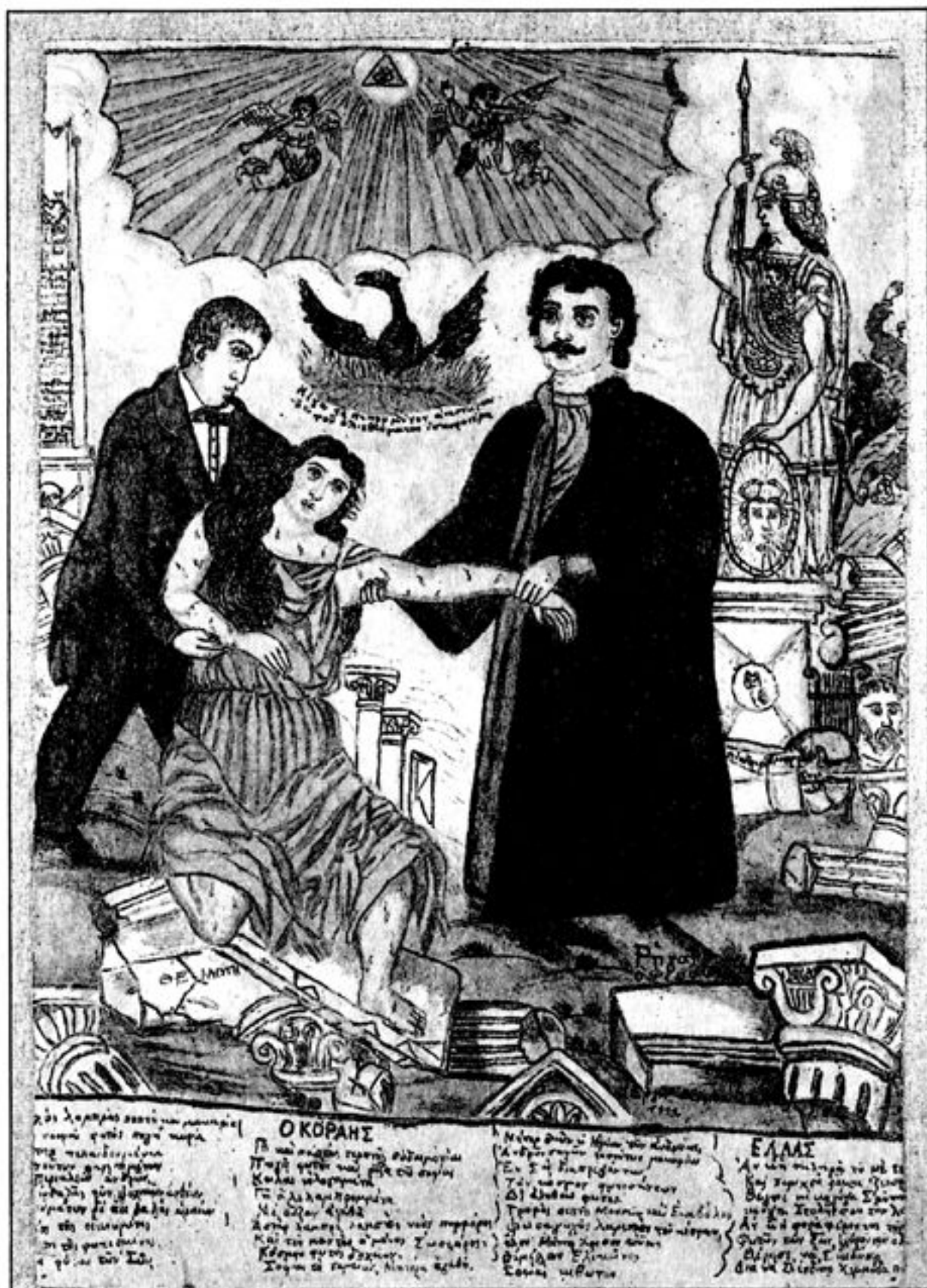
'Ο Ρήγας και ὁ Κοραΐς ἀνασηκώνουν τὴ δούλη Ἑλλάδα. Πίνακας τοῦ Θεόφιλου Χατζημιχαήλ (1911). Συλλογὴ Ἀλεξάνδρου Ξύδη.