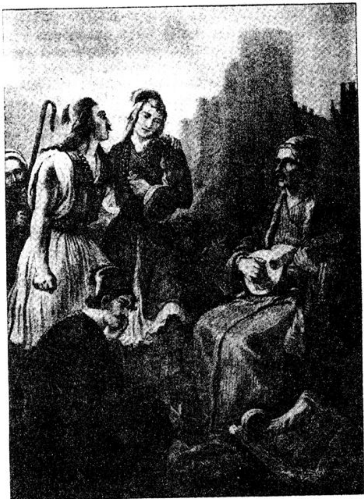
Ὁ Ρῆγας ψάλλει τὸν Θούριο. Σχέδιο τοῦ Peter von Hess [1852]. Βιβλιοθήκη τῆς Βουλῆς.