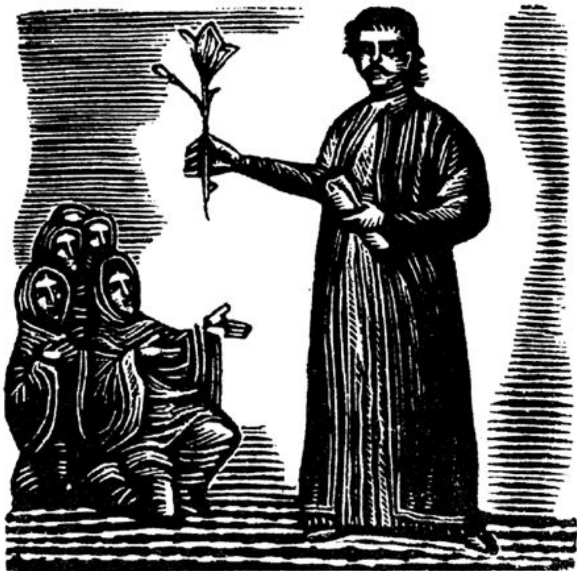
Ὁ σπόρος τῆς ἐλευθερίας ἀνθισμένος στὸ χέρι τοῦ Ρήγα. Ἐυλογραφία τοῦ Σπύρου Βασιλείου στὸ βιβλίο τοῦ Ἁγίου Θεόρου, Ἡ Δρακογενιά, Ἀθήνα 1943. Συλλογὴ Ν. Γρηγοράκη.