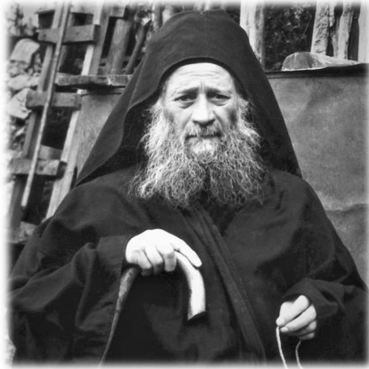
Όσιος Ιωσήφ ο Ησυχαστής (1898-1959).

Άλλωστε “όπου γαρ βούλεται Θεός νικάται φύσεως τάξη”!