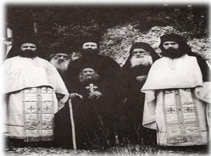
Συνοδία του οσίου Ιωσήφ του Ησυχαστή. Δεξιά ο π. Εφραίμ της Αριζόνας.

Συνοδία πλήρης. Συνοδία οσιακώς διαλαμπάντων πλήρης.