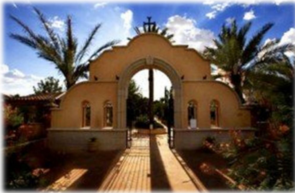
Ιερά Μονή Αγίου Αντωνίου Αριζόνας.

Πόσο όμορφο είναι ένα βίντεο που είδα πριν καιρό, που έδειχνε τον Γέροντα Εφραίμ, να φορτώνει τρόφιμα ένα όχημα και να σπεύδει να συναντήσει φτωχούς, άστεγους και καταρρακωμένους, για να τους προσφέρει αυτό το περίσσευμα της καρδιάς του.