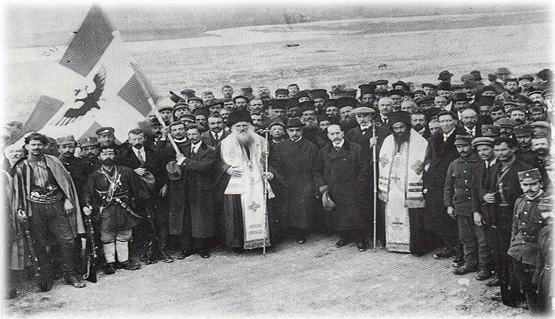
Χαρακτηριστική φωτογραφία της επίσημης ανακήρυξης της Αυτονομίας την 1η Μαρτίου 1914 στο Αργυρόκαστρο.