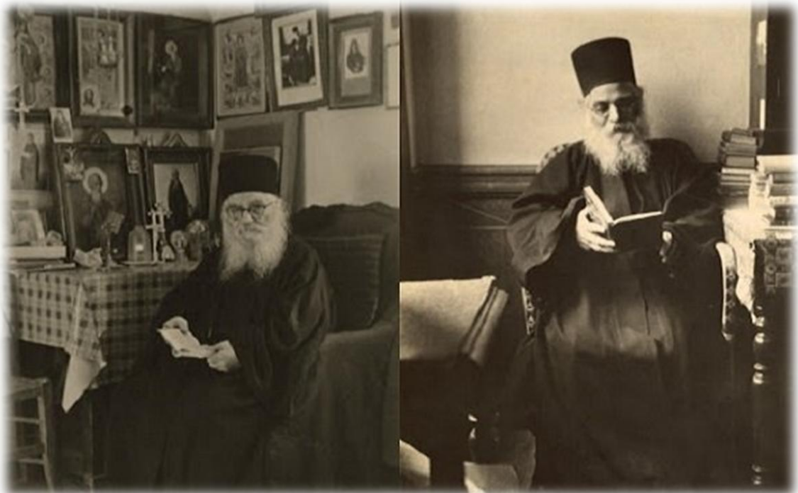
Όσιος Ιερώνυμος. Σιμωνοπετρίτης.

Τον Οικουμενικό Πατριάρχη κ.κ. Βαρθολομαίο προσφώνησε ο Καθηγούμενος της Ι.Μ. Διονυσίου Αρχιμ. Πέτρος. Ο Παναγιώτατος αντιφώ-