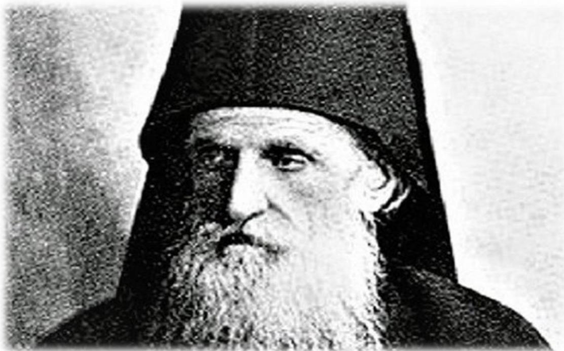
Όσιος Δανιήλ Κατουνακιώτης.

Την αναγραφή στο Αγιολόγιο της Εκκλησίας, ανήγγειλε ο Οικουμενικός Πατριάρχης κ.κ Βαρθολομαίος, των αγιορειτών οσίων, Δανιήλ Κατουνακιώτη, Ιερώνυμο Σιμωνοπετρίτη, Ιωσήφ του Ησυχαστή, Εφραίμ Κατουνακιώτη.