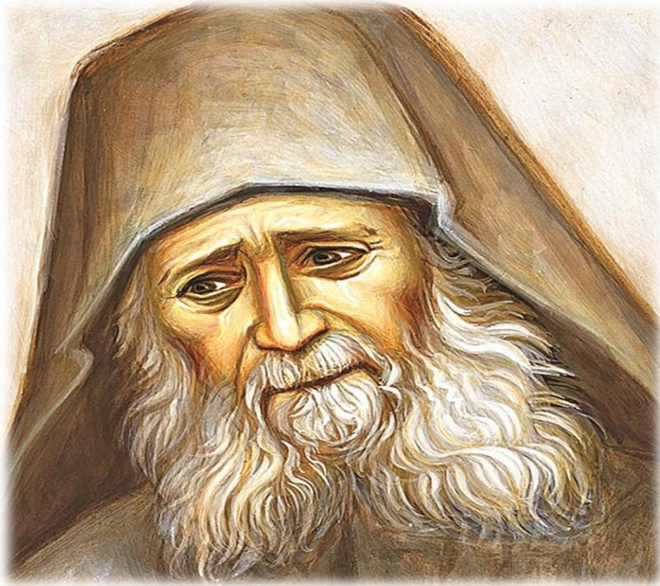
Όσιος Ιωσήφ ο Ησυχαστής.