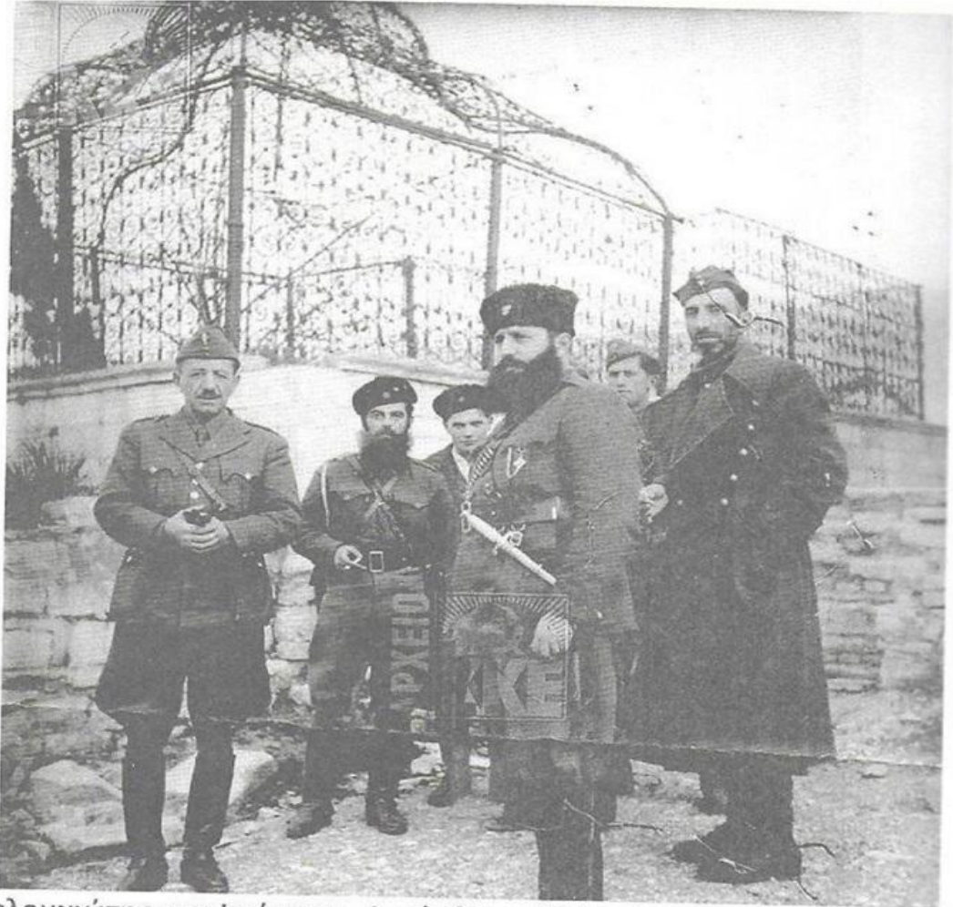
Ο Βελουχιώτης στα Ιωάννινα, Δεκέμβριος 1944.