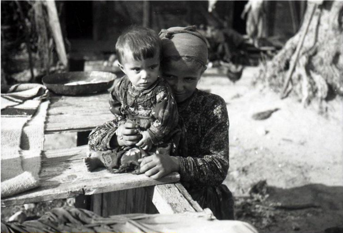
Οι Αλβανοί «παίζουν» το χαρτί των Τσάμηδων

Πραγματικά, τον Μάρτιο του 1945, επιχειρήθηκε η επιστροφή των Τσάμηδων στη Θεσπρωτία, με την αδράνεια, αν όχι ενθάρρυνση ( «συγκαταβατική απάθεια» γράφει εύστοχα ο Σταύρος Ντάγιος ), του ΕΑΜ της περιοχής. Το αποτέλεσμα ήταν να σημειωθούν αιματηρές συμπλοκές με τους ντόπιους κατοίκους της περιοχής και να υπάρξουν μερικές δεκάδες θύματα στους Φιλιάτες.