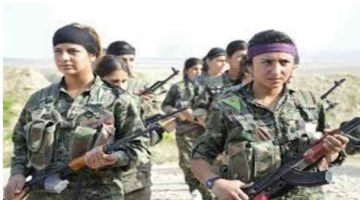
Τάγμα γυναικών μαχητών των Κούρδων.

τερο τις προοπτικές των Κούρδων. Πλέον, χωρίς το φόβο των συνεχών επιθέσεων των δυνάμεων του Σαντάμ Χουσεΐν, οι Κούρδοι έχουν ντε φάκτο εγκαθιδρύσει το κράτος τους στο βορειοανατολικό Ιράκ. Παράλληλα η άριστη συνεργασία που είχαν με τους Ιρακινούς «πεςμέργκα» οι Αμερικάνοι σε όλη τη διάρκεια της χερσαίας εμπλοκής τους στο Ιράκ άλλαξε την εικόνα που είχε το State Department για τους ορεσίβιους αυτούς μαχητές. Αποδεικνύονται ως η μόνη οργανωμένη δύναμη εντός Ιράκ ικανή να στεριώσει την εξουσία της σε εκτεταμένες περιοχές, και όχι απλώς γύρω από αστικά κέντρα. Η εξάπλωση του Ισλαμικού Χαλιφάτου που κατέλαβε εξ απήνης τον ιρακινό στρατό, αντιμετώπιστηκε πετυχημένα και θαρραλέα από τους μαπαρουτοκαπνισμένους βετεράνους «πεςμέργκα», μάλιστα μέχρι πρόσφατα αγωνίζονταν μόνοι ενάντια στους «τζιχαντιστές» μέχρι να... δεήσουν οι δυτικοί να αποστείλουν τα πανάκριβα βομβαρδιστικά τους να τους ανακουφίσουν λίγο στο πολιορκούμενο Κομπάνι στην τουρκοσυριακή μεθόριο. Οι φυλετικές διαμάχες του παρελθόντος ανάμεσα σε Μπαρζανί και Ταλαμπανί έχουν, προς το παρόν, αμβλυνθεί μπροστά στην προοπτική διεθνούς αναγνώρισης του Κουρδιστάν καθώς και στην προσπάθεια τους να περιορίσουν την εξάπλωση του I.S.I.S. Ίσως αυτή να είναι και η καθοριστική ιστορική καμπή του κουρδικού. Τώρα θα δείξουν οι Κούρδοι φύλαρχοι αν είναι ικανοί να βγουν πάνω από τα τοπικά μικροσυμφέροντα τους, να εκφράσουν το κουρδικό εθνικό αίσθημα και να οργανώσουν τον πολιτικό τους αγώνα.