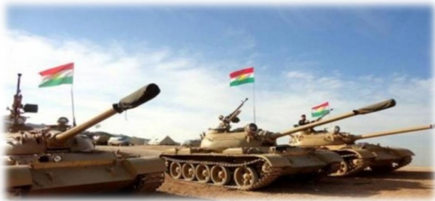
Κουρδικά άρματα μάχης.

ανεξαρτησίας. Η άρνηση της Τουρκίας να συνεργαστεί με τις Η.Π.Α. οδήγησε τις τελευταίες στην αναζήτηση συμμαχιών με τους Κούρδους, ώστε να διασφαλιστεί το λεγόμενο «βόρειο μέτωπο» ενάντια στις δυνάμεις του Ιράκ. Με την πτώση του Σαντάμ οι Κούρδοι έχουν εγκαταστήσει την εξουσία τους σχεδόν σε όλο το βορειοανατολικό Ιράκ, με τις αψιμαχίες όμως μεταξύ των δυο κυρίαρχων κομμάτων να έχουν περιοριστεί μεν, αλλά να μην έχουν εξαφανιστεί εξ ολοκλήρου δε. Η σύγχρονη απειλή για ολόκληρο το ιρακινό Κουρδιστάν, όπως και για όλες τις χώρες της περιοχής ακούει στο όνομα Ισλαμικό Χαλιφάτο. Από τη στιγμή που οι ιρακινές δυνάμεις αποδείχτηκαν ανίκανες να αξιοποιήσουν τον αμερικανικό εξοπλισμό ενάντια στους «τζιχαντιστές» του Χαλιφάτου, οι Κούρδοι αναδεικνύονται στην μοναδική δύναμη στο Ιράκ που μπορεί να προβάλλει σοβαρή αντίσταση στους επελαύνοντες «μαχητές της πίστης» του Ισλαμικού Χαλιφάτου.