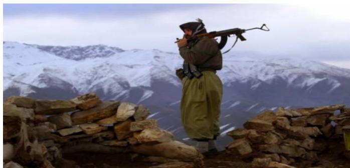
Κούρδος μαχητής Πεσμέργκα.

Στη Συρία τα τελευταία 3 χρόνια που μαινεται ο εμφύλιος, οι Κούρδοι έχουν ξεσηκωθεί ενάντια στο καθεστώς Άσαντ διεκδικώντας τα στοιχειώδη ανθρώπινα δικαιώματα που τους στερεί η συριακή μοναρχία. Ζητούν πολιτική εκπροσώπηση, δικαίωμα να διδάσκουν και να μιλούν τη γλώσσα τους, να ονοματίζουν τα παιδιά τους με κουρδικά ονόματα και πλήθος άλλων δικαιωμάτων που θεωρούνται θεμελιώδη. Ουσιαστικά οι Κούρδοι της Συρίας στερούνται κάθε δικαιώματος όσο δεν αποδέχονται την συριακή υπηκοότητα. Η κατάρρευση του απολυταρχικού καθεστώτος του Άσαντ ανοίγει νέους δρόμους για τις διεκδικήσεις των Κούρδων της Συρίας που φτάνουν περί το 1,5 εκ. ψυχές.