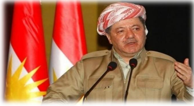
Ο ηγέτης του PDK Μπαρζανί.

δικούν εκδημοκρατισμό και αυτονομία. Στις αρχές του 21 ου αιώνα φαίνεται ότι το Ιράν τα έχει καταφέρει κάπως καλύτερα να περιορίσει τις αυτονομιστικές κινήσεις των Κούρδων, έχοντας καταφέρει να τους ενσωματώσει, χωρίς όμως να τους έχει αφομοιώσει, στην ιρανική κοινωνία. Συμμετέχουν στην κεντρική διοίκηση σε υπουργικά πόστα ενώ αντιπροσωπεύονται και στην ιρανική βουλή.