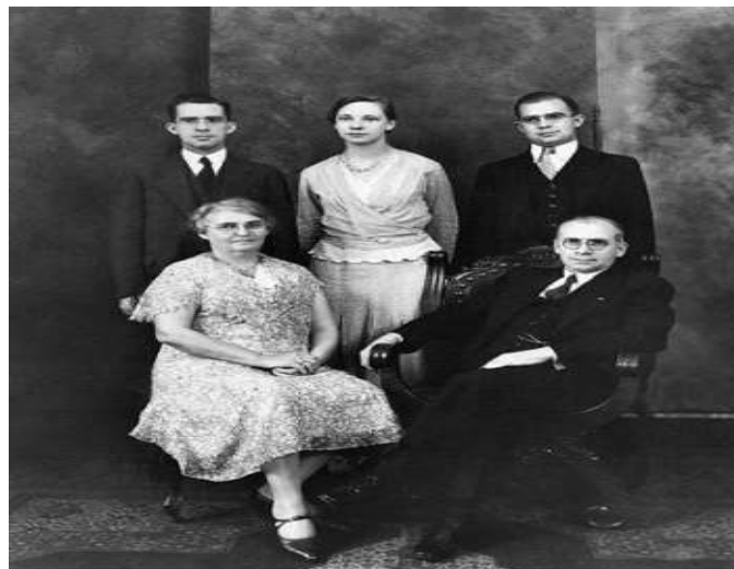
Rev. Asa Jennings and family

Τον Σεπτέμβριο του 1922 η Σμύρνη παραδόθηκε στις φλόγες και χιλιάδες κάτοικοι σφάχτηκαν ανηλεώς από τις δυνάμεις του Μουσταφά Κεμάλ. Καμία ανθρωπιστική οργάνωση δεν βοήθησε στη διάσωση των Ελλήνων κατοίκων. Κανένας στρατός, κανένας πολιτικός και καμία κυβέρνηση της Ελλάδος. Παρά μόνο ένας απλός Αμερικανός που κατά τύχη βρισκόταν εκείνη την περίοδο στην Σμύρνη. Το όνομα του ήταν Έιζα Τζένιγκς και έσωσε την ζωή 350.000 Ελλήνων.