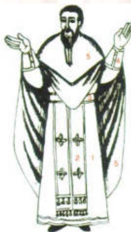
Τα ἄμφια τοῦ Πρεσβυτέρου

Θά ἦταν μεγάλη παράλειψη νομίζω, ἄν δέν ἀναφερόμαστε στόν Λειτουργό ἱερέα καί γιά τή στολή του, τά ἄμφια του πού φορᾶ κατά τήν τέλεση τῆς θ. Λειτουργίας καί πού τό κάθε ἓνα ἔχει τό συμβολισμό του.