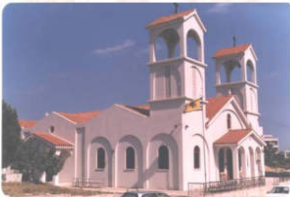
21.Η ΑΠΟΧΩΡΗΣΗ ΑΠΟ ΤΟ ΝΑΟ.

Θά πρέπει νά ποῦμε ὅτι ἐξαιροῦνται ὅσοι γιά διάφορους σοβαροὺς λόγους δέ μποροῦν νά σταθοῦν τόση ὥρα, ἄς σταθοῦν ὅσο μποροῦν αὐτοί.