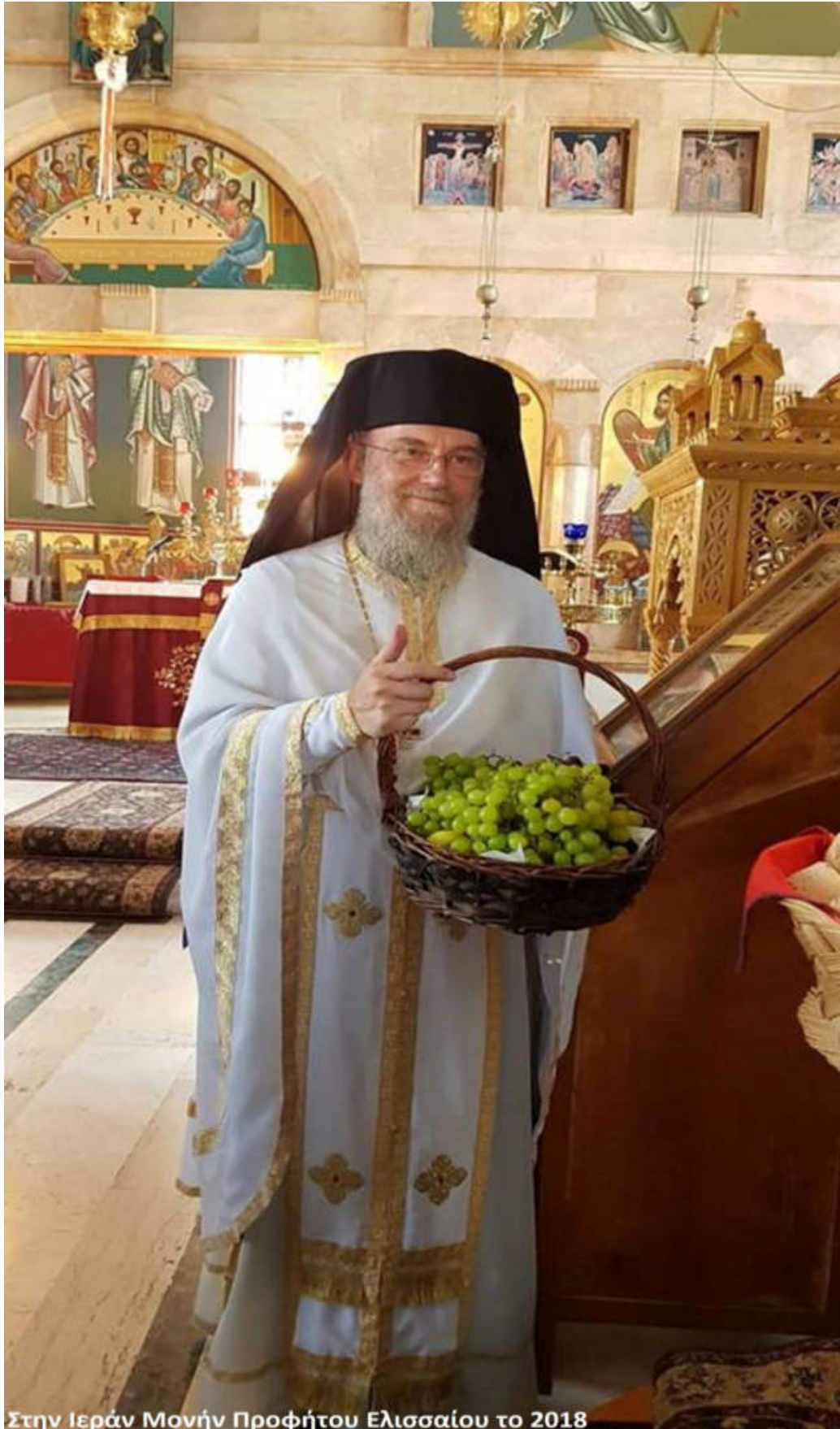
Στην Ιεράν Μονήν Προφήτου Ελισσαίου το 2018

Έτσι, τα ευλογημένα σταφύλια μοιράζονται και τρώγονται μαζί με το αντίδωρο.