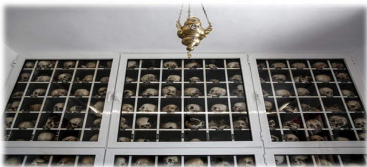
Κρανία θυμάτων της σφαγής στο Δίστομο.