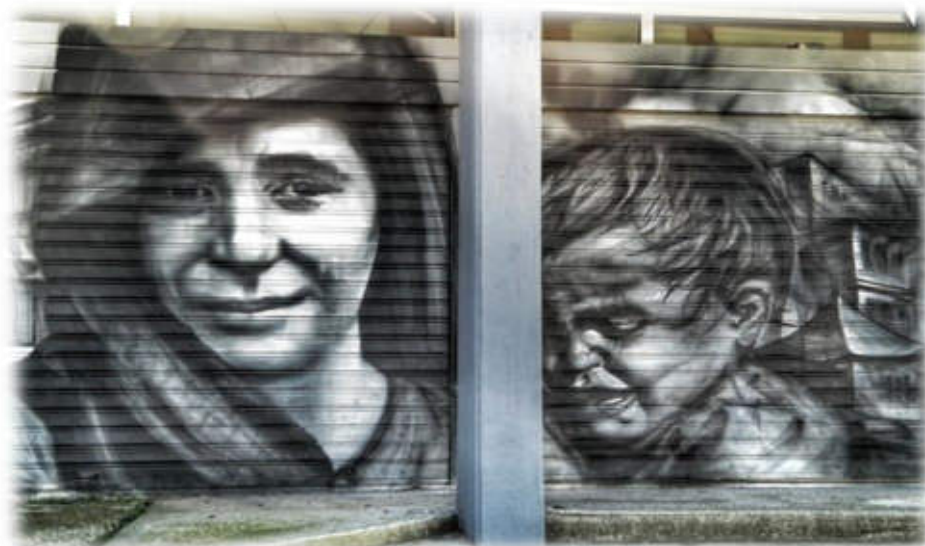
Γκράφιτι με θέμα την σφαγή στο Δίστομο, σε τοίχο στην Αθήνα

Στην πορεία ζητήθηκε η μεταφορά του στην Γερμανία για τις εκεί έρευνες όπου και παρέμεινε. Σύμφωνα με πληροφορίες δεν αντιμετώπισε ποτέ τις συνέπειες των πράξεών του.