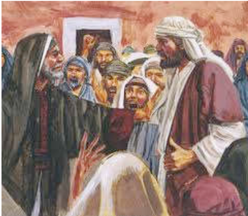
Εικόνα 7: Ο ΖΟΡΟΒΑΒΕΛ