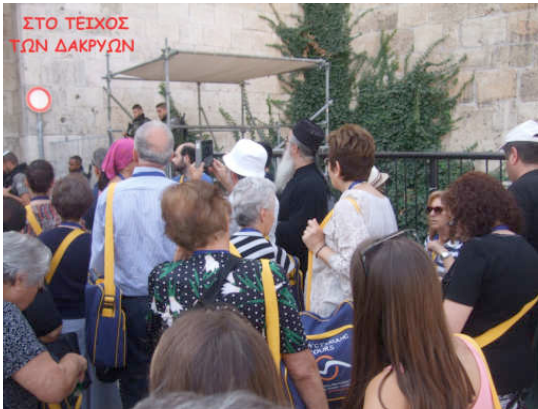
Εικόνα 16: ΑΥΓΟΥΣΤΟΣ 2017 ΓΚΡΟΥΠ ΙΜ ΚΙΤΡΟΥΣ & ΚΑΤΕΡΙΝΗΣ