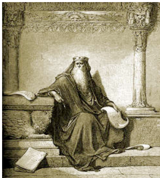
Εικόνα 3: ΒΑΣΙΛΙΑΣ ΣΟΛΟΜΩΝΤΑΣ

Αγόρασε την κατάλληλη έκταση των 200 στρεμμάτων και άρχισε να οργανώνει συνεργεία με χιλιάδες τεχνίτες, μηχανικούς και εργάτες.