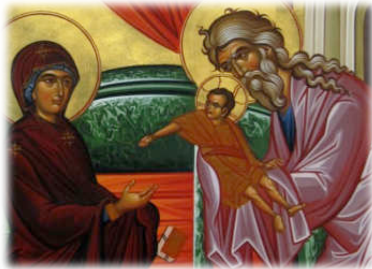
Εικόνα 10: Ο ΑΓΙΟΣ ΣΥΜΕΩΝ ΕΥΛΟΓΕΙ ΤΟ ΧΡΙΣΤΟ ΤΗΣ ΥΠΑΠΑΝΤΗΣ ΣΤΟ ΝΑΟ.

Στο Ναό αυτό η Παναγία μας έζησε στα Άγια των Αγίων από τα τρία Της χρόνια μέχρι περίπου τα 15. Εδώ ο πρεσβύτες Συμεών ευλόγησε το Θείο Βρέφος της Υπαπαντής.