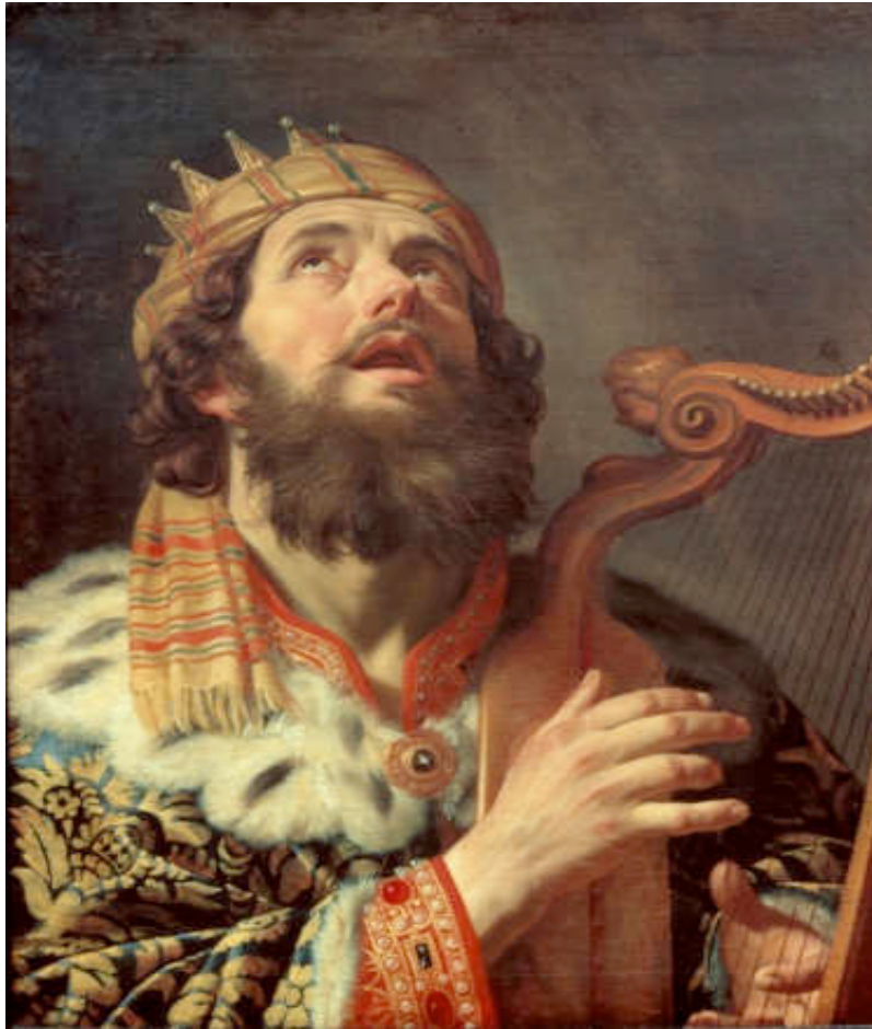
Εικόνα 4: ΒΑΣΙΛΙΑΣ ΔΑΒΙΔ

Τα μεγαλοπρεπή εγκαίνια έγιναν από το Σολομώντα, το 955 π