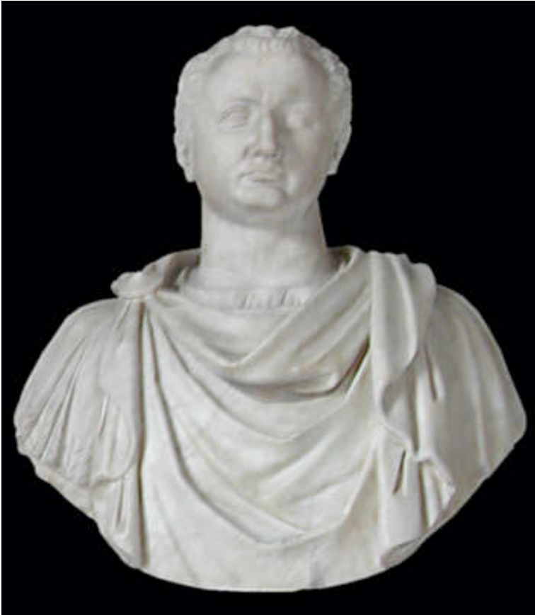
Εικόνα 13: ΤΙΤΟΣ ΦΛΑΒΙΟΣ ΡΩΜΑΙΟΣ ΣΤΡΑΤΗΓΟΣ

Όμως ο Ρωμαίος Στρατηγός Τίτος το 70 μ.χ. κατέστρεψε ολοκληρωτικά την Ιερουσαλήμ και το Ναό. Το μόνο τμήμα που διασώθηκε είναι το λεγόμενο Τείχος των Δακρύων , Ο Ιερότερος Τόπος των Εβραίων όλου του κόσμου για 2000 χρόνια.