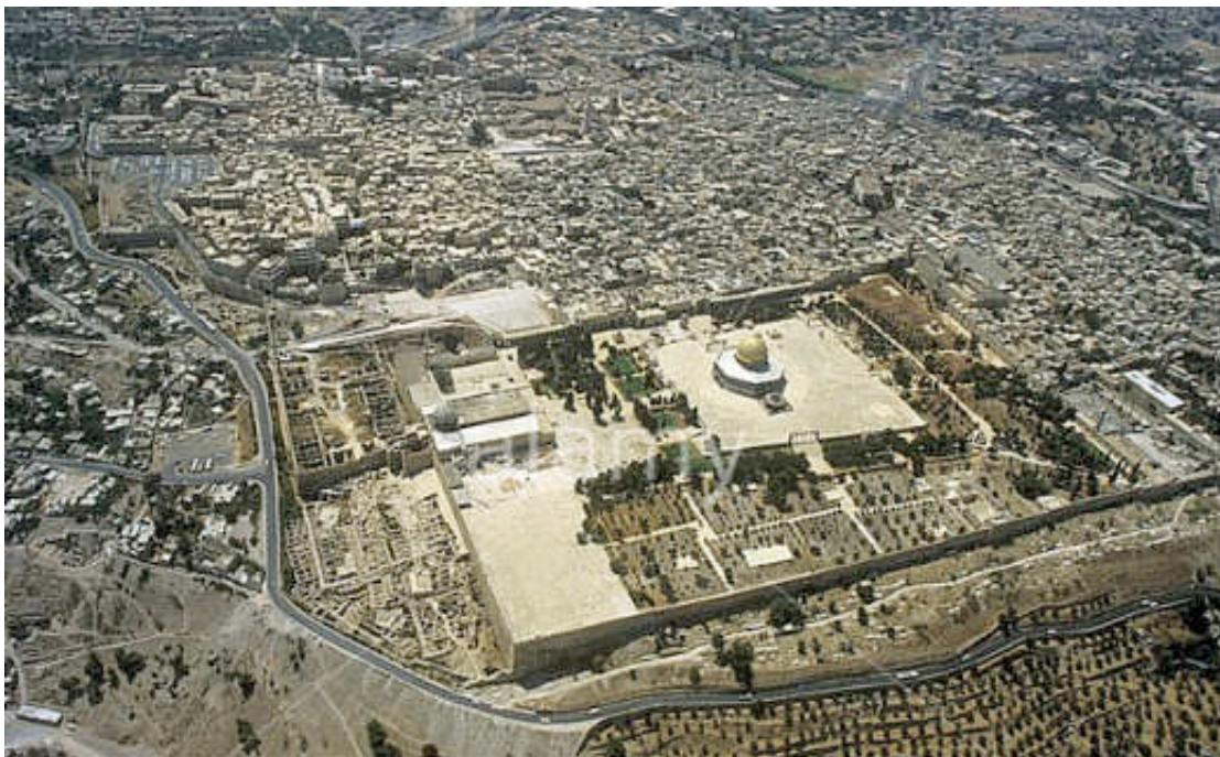
Εικόνα 18: ΓΕΝΙΚΗ ΑΠΟΨΗ ΤΗΣ ΠΕΡΙΟΧΗΣ ΤΟΥ ΝΑΟΥ

Για 600 χρόνια η περιοχή σχεδόν αγνοήθηκε. Το 632 μ.χ. οι Άραβες Μουσουλμάνοι με το χαλίφη Ομάρ κατέλαβαν την περιοχή και το 691 μ.χ