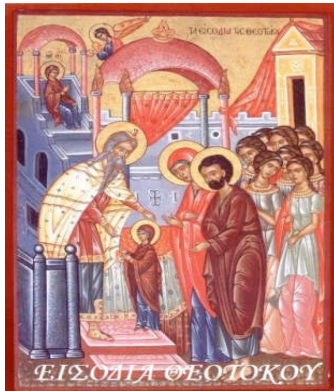
Εικόνα 9: ΤΑ ΕΙΣΟΔΙΑ ΤΗΣ ΘΕΟΤΟΚΟΥ

Μετά από 45 χρόνια ολοκληρώθηκαν οι εργασίες, το έτος 19 μ.χ.