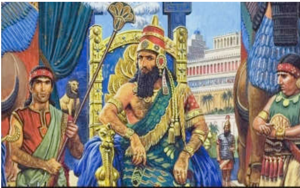
Εικόνα 5: ΝΑΒΟΥΧΟΔΟΝΩΣΩΡ

Όμως το 597 π.χ. μετά από 400 χρόνια ακμής και δόξας, κατα-στράφηκε από το βασιλιά της Βαβυλώνας το Ναβουχοδονόσορα.