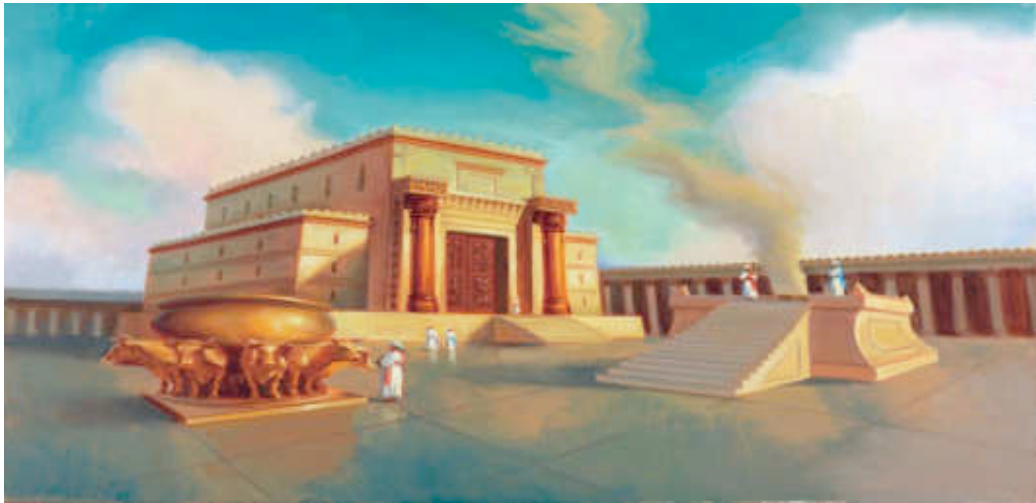
Εικόνα 1: ΑΠΕΙΚΟΝΗΣΗ ΠΡΩΤΟΥ ΝΑΟΥ

Σήμερα 70 χρόνια μετά την ίδρυση του κράτους του Ισραήλ, η επι-καιρότητα βρίσκεται στη λωρίδα της Γάζας και στην Αγία Πόλη Ιερου-σαλήμ.