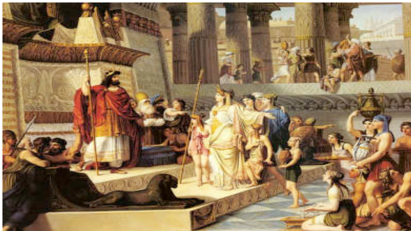
Εικόνα 17: ΑΝΑΠΑΡΑΣΤΑΣΗ ΤΟΥ ΝΑΟΥ ΤΟΥ ΣΟΛΟΜΩΝΤΑ

Ἀμήν λέγω ὑμῖν, οὐ μὴ ἀφεθῆί ὧδε οὔτε λίθος ἐπὶ λίθον ὅς οὐ καταληθῆσεται.