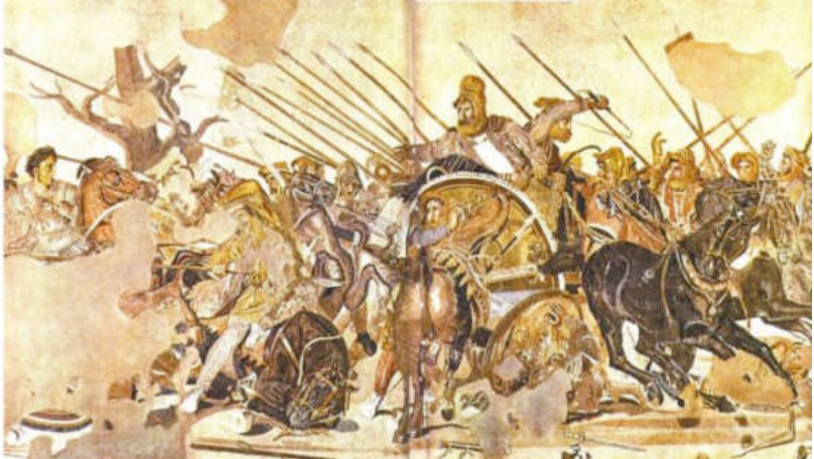
Εικόνα 6: ΚΥΡΟΣ Ο ΜΕΓΑΣ. ΜΑΧΗ ΤΟΥ ΓΡΑΝΙΚΟΥ ΠΟΤΑΜΟΥ

Το 538 π.χ. ο Πέρσης Βασιλιάς Κύρος ο Μέγας έδωσε άδεια για να ξαναχτισθεί ο Ναός.