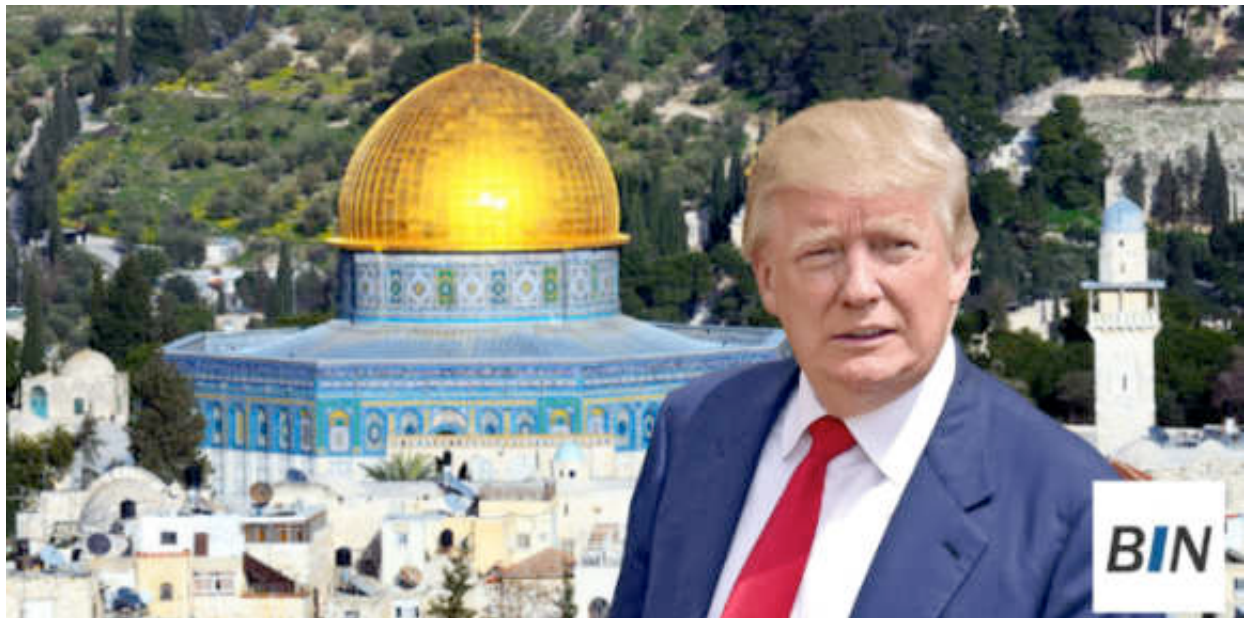
Εικόνα 19: ΠΡΙΝ ΑΠΟ ΛΙΓΟΥΣ ΜΗΝΕΣ ΤΟ ΕΠΙΣΚΕΦΘΗΚΕ ΚΑΙ Ο ΤΡΑΜΠ