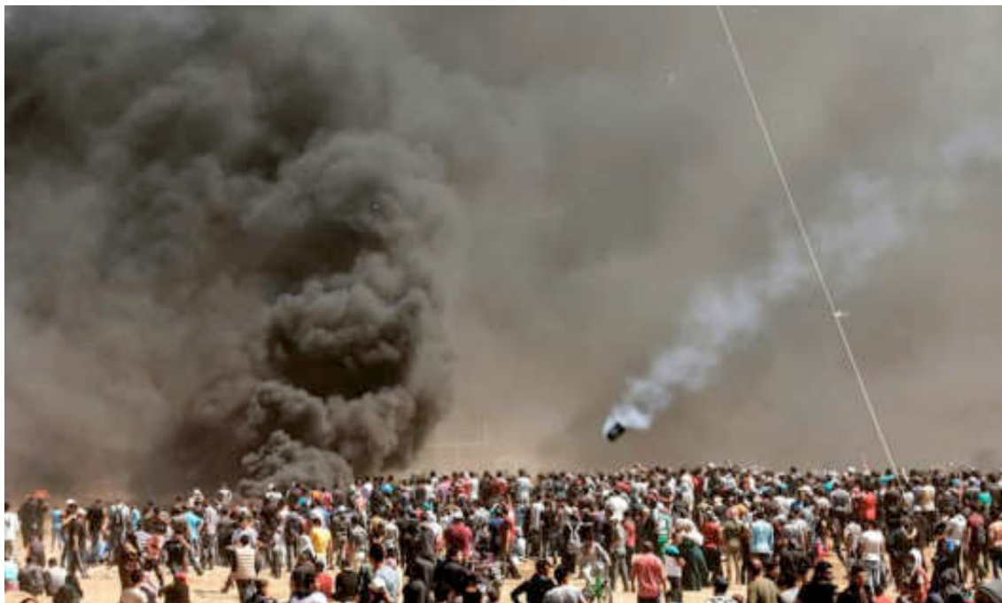
Εικόνα 22: ΓΕΝΙΚΟΣ ΞΕΣΗΚΩΜΟΣ ΠΑΛΑΙΣΤΙΝΙΩΝ ΣΗΜΕΡΑ ΣΤΗ ΓΑΖΑ

Στην Ιερουσαλήμ τα μέτρα ασφαλείας είναι δρακόντεια. Η Αγία Πόλη βρίσκεται κάτω από στρατιωτικό έλεγχο