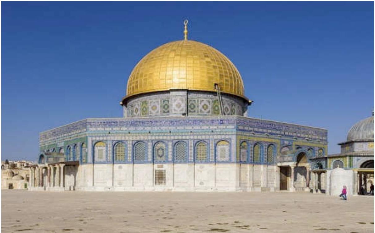
Εικόνα 19: ΤΟ ΤΕΜΕΝΟΣ ΤΟΥ ΟΜΑΡ ΧΤΙΣΜΕΝΟ ΠΑΝΩ ΣΤΑ ΕΡΕΙΠΙΑ ΤΟΥ ΝΑΟΥ ΤΟΥ ΣΟΛΟΜΩΝΤΑ

χτίστηκε πάνω στα ερείπια του Ναού του Σολομώντα το τζαμί που βλέπουμε σήμερα με το χρυσό τρούλλο.