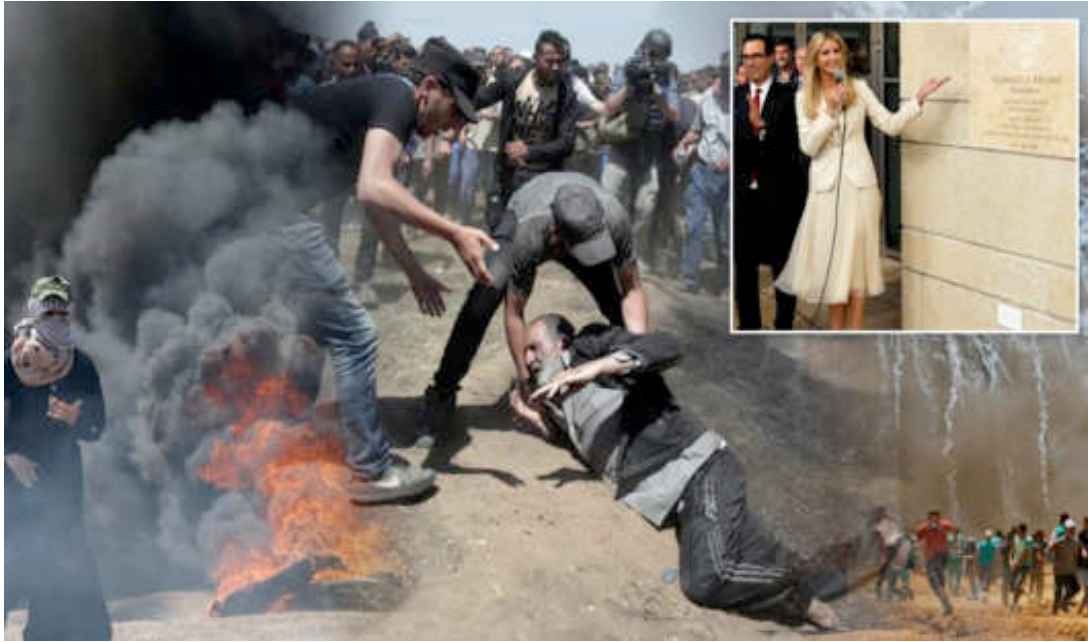
Εικόνα 21: ΣΗΜΕΡΙΝΗ ΕΠΙΚΑΙΡΟΤΗΤΑ. ΑΡΙΣΤΕΡΑ ΟΙ ΜΑΧΕΣ ΣΤΗ ΛΩΡΙΔΑ ΤΗΣ ΓΑΖΑΣ ΜΕ ΔΕΚΑΔΕΣ ΝΕΚΡΟΥΣ. ΔΕΞΙΑ ΓΙΟΡΤΕΣ ΓΙΑ ΤΗΝ ΠΡΕΣΒΕΙΑ !!!

Πρώτες πρωινές ώρες της Τρίτης 16 Μαΐου 2018 και η κατάσταση στην περιοχή της Γάζας γίνεται εκρηκτική.