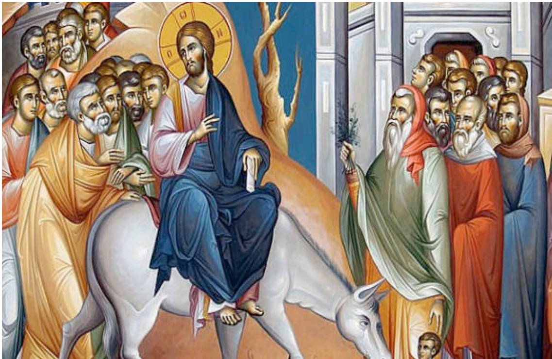
Εικόνα 12: Ο ΚΥΡΙΟΣ ΜΠΑΙΝΕΙ ΣΤΟ ΝΑΟ ΤΩΝ ΒΑΪΩΝ