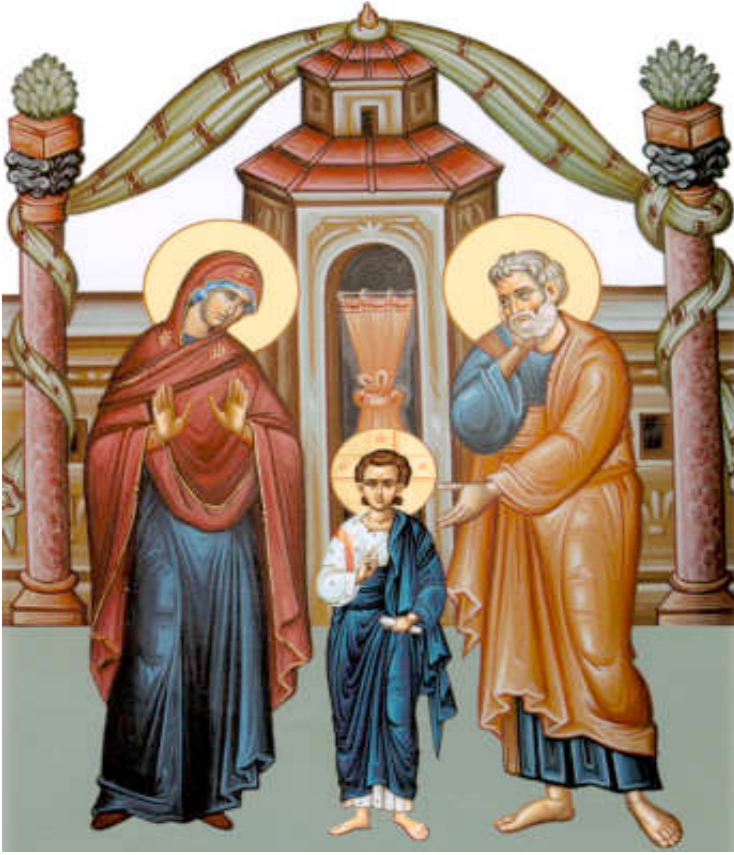
Εικόνα 11: Ο ΙΗΣΟΥΣ ΔΩΔΕΚΑΕΤΗΣ ΣΤΟ ΝΑΟ ΤΟΥ ΣΟΛΟΜΩΝΤΑ