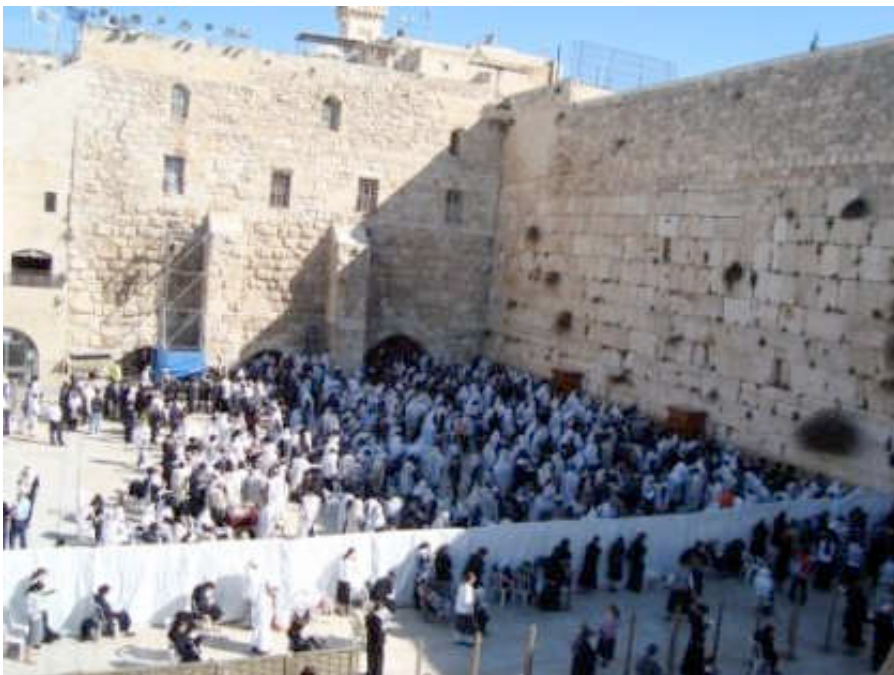
Εικόνα 14: ΤΕΙΧΟΣ ΤΩΝ ΔΑΚΡΥΩΝ

Όμως ο Ρωμαίος Στρατηγός Τίτος το 70 μ.χ. κατέστρεψε ολοκληρωτικά την Ιερουσαλήμ και το Ναό. Το μόνο τμήμα που διασώθηκε είναι το λεγόμενο Τείχος των Δακρύων , Ο Ιερότερος Τόπος των Εβραίων όλου του κόσμου για 2000 χρόνια.