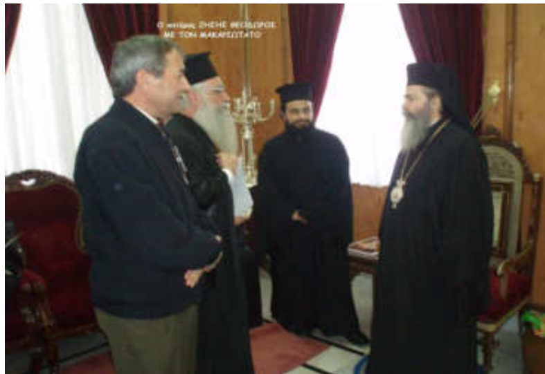
Εικόνα 28 ΜΕ ΤΟΝ ΜΑΚΑΡΙΩΤΑΤΟΝ ΠΑΤΡΙΑΡΧΗΝ κ. ΘΕΟΦΙΛΟΝ Γ'.

Εἶναι ἀλήθεια ὅτι ἡ Ἱερουσαλήμ κι οἱ ἅγιοι τόποι της ἔχουν μεγάλη σημασία γιὰ τοὺς ὀπαδοὺς τῆς κάθε θρησκείας καί τοὺς χριστιανούς τῶν περισσοτέρων ὁμολογιῶν, ἀλλ' ἐξ ἴσου εἶναι ἀλήθεια ὅτι «πνεῦμα ὁ Θεός καί τοὺς προσκυνοῦντας αὐτόν ἐν πνεύματι καί ἀληθείᾳ δεῖ προσκυνεῖν».