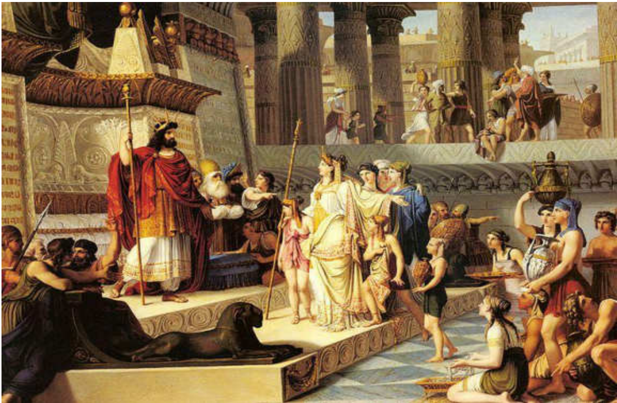
Εικόνα 10. Ο .ΝΑΟΣ. ΤΟΥ. ΣΟΛΟΜΩΝΤΑ

Στό ναό αυτό κήρυξαν και προσευχήθηκαν ο ίδιος ο Χριστός κι οι απόστολοι.