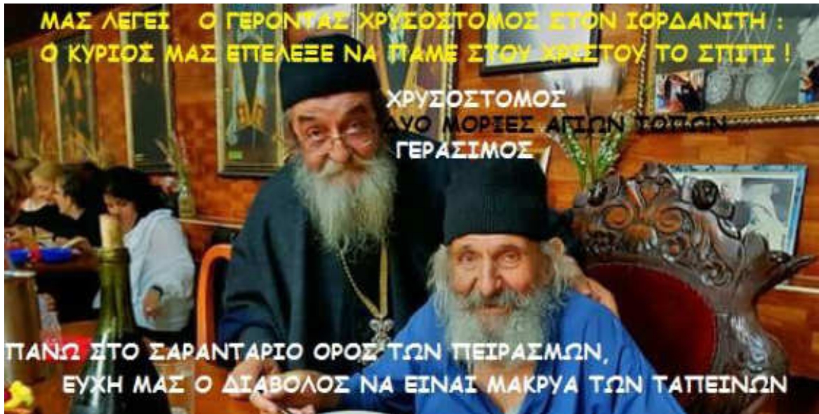
Εικόνα 27. ΑΓΙΟΤΑΦΙΤΕΣ

ἀγάπη τοῦ Θεοῦ κι ἡ συγκατάβασή του γιὰ τόν ἄνθρωπο, ἡ ἀγάπη τοῦ ἀνθρώπου πρὸς τὸ συνάνθρωπο κι ἡ ἀνεκτικότητα πρὸς τόν πλησίον.