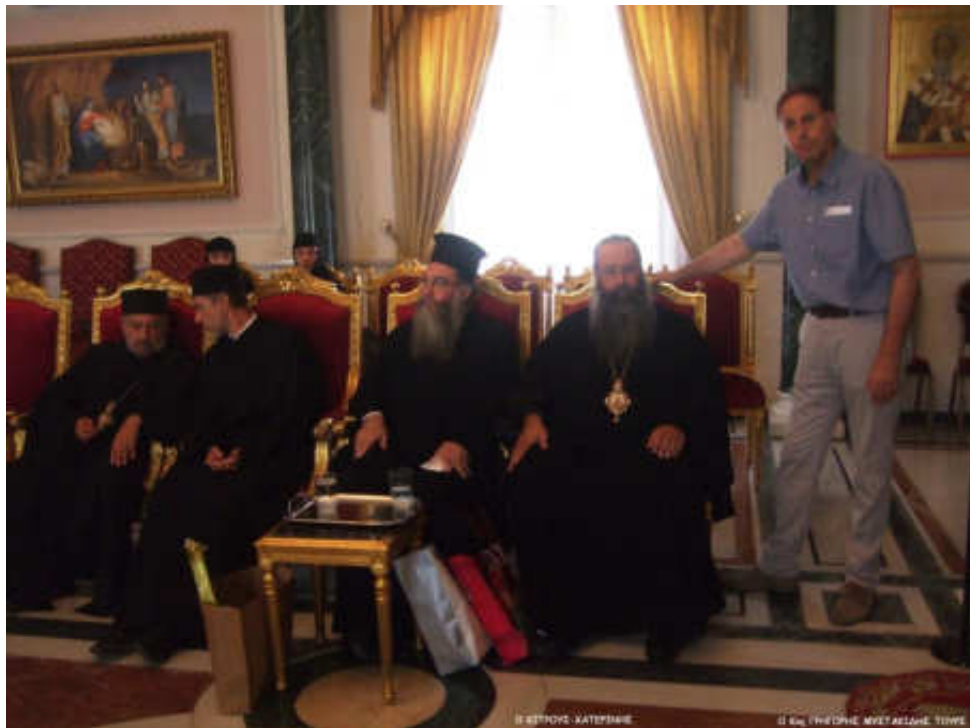
Εικόνα 23. ΠΡΟΣΚΥΝΗΤΕΣ ΣΤΗΝ ΑΓΙΑ ΓΗ

Γι' αυτό από τόν 4ο μ.Χ. αί. καί ἔπειτα παρατηρεῖται άθρόα ή προσέλευση προσκυνητῶν στούς άγίους τόπους.