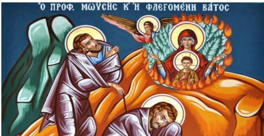
Εικόνα 16. Μωϋσῆς και η καιομένη βάτος

Τοῦτο εἶναι σύμφωνο μέ τή Βίβλο κατά τό, «Μωϋσῆ, Μωϋσῆ, λῦσαι τό ὑπόδημα ἐκ τῶν ποδῶν σου, ὁ γάρ τόπος ἐν ᾧ σύ ἔστηκας, γῆ ἁγία ἐστί».