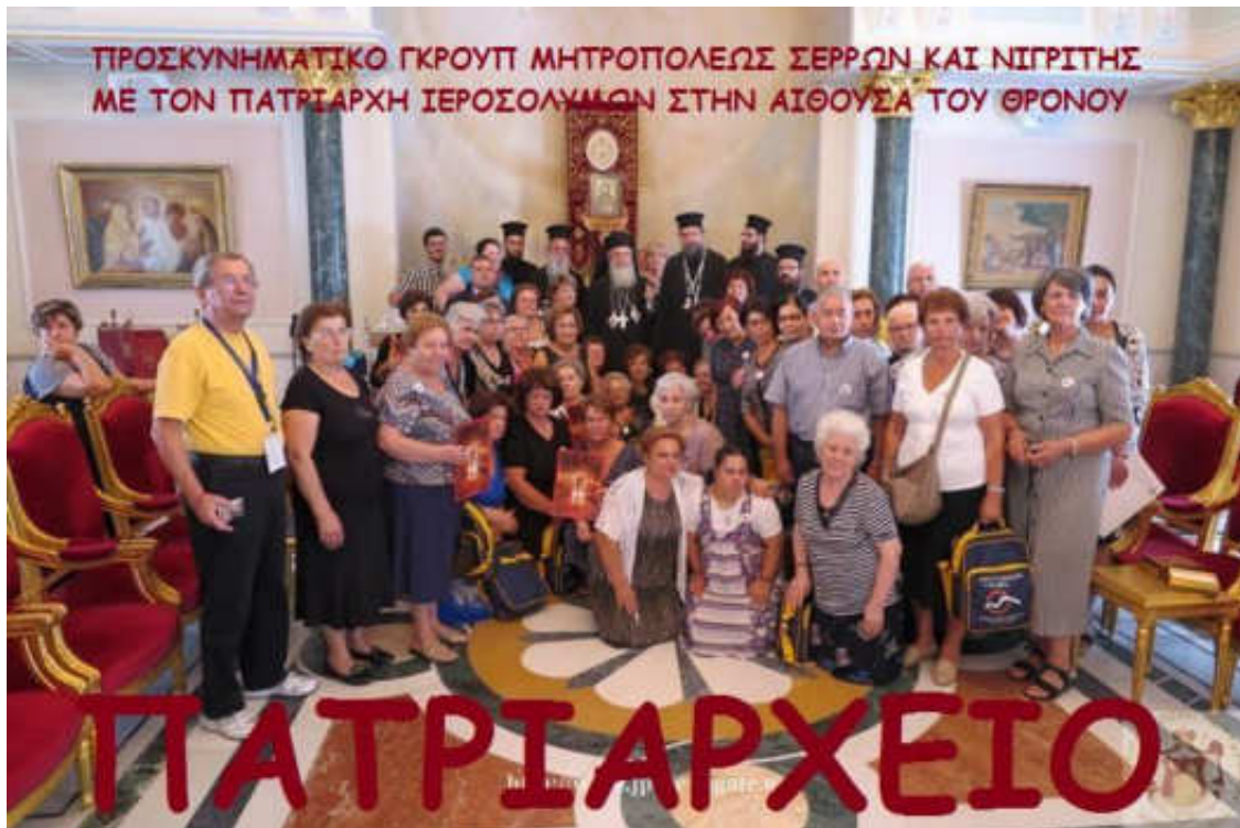
Εικόνα 25. ΠΡΟΣΚΥΝΗΤΕΣ ΑΓΙΑΣ ΓΗΣ

Οι άνθρωποι στό ροϋ τῆς ιστορίας τους ἄλλοτε μεγαλούργησαν κι ἄλλοτε ἐγκλημάτησαν στούς ἁγίους τόπους καί γιά χάριν τῶν ἁγίων τόπων.