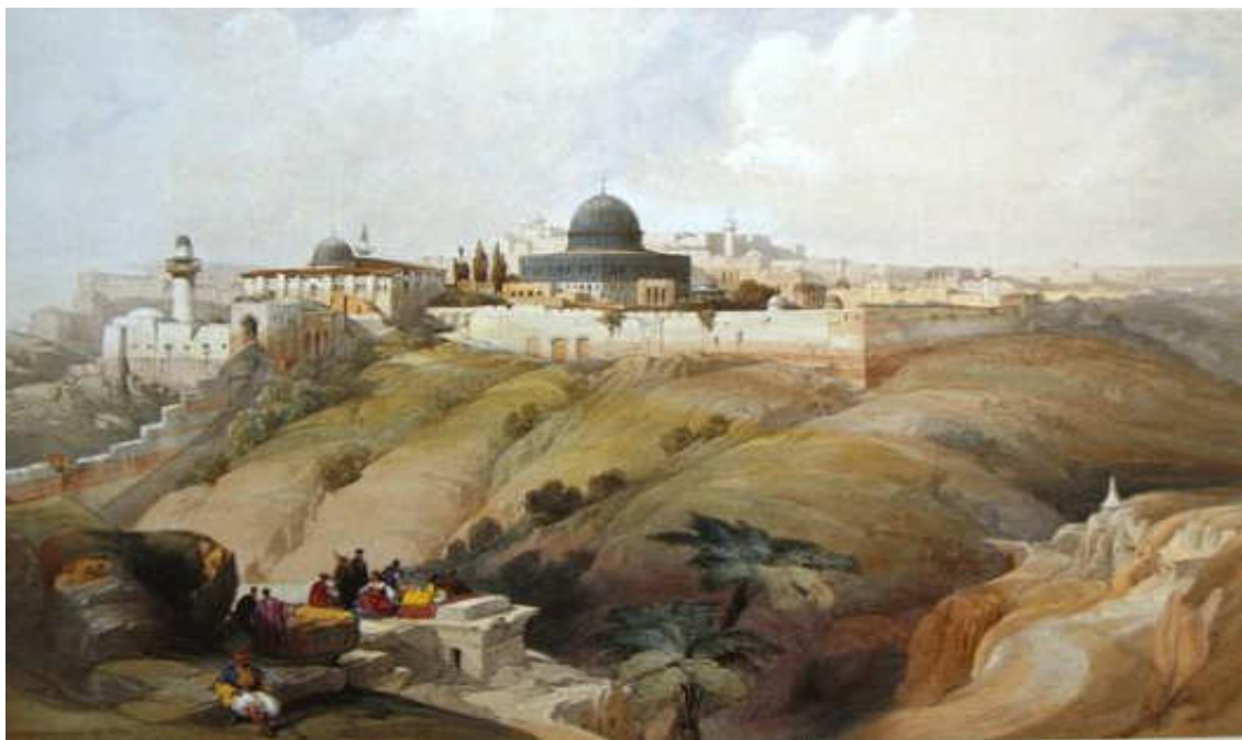
Εικόνα 2. ΓΚΡΑΒΟΥΡΑ ΜΕ ΦΟΝΤΟ ΤΑ ΤΕΜΕΝΗ ΟΜΑΡ - ΕΛ ΑΚΣΑ