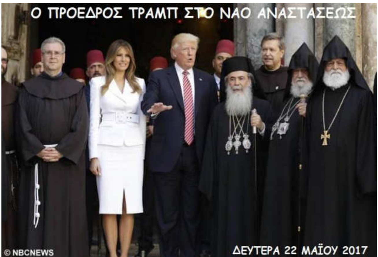
Εικόνα 24. ΠΡΟΣΚΥΝΗΤΗΣ ΚΑΙ Ο ΠΡΟΕΔΡΟΣ ΤΡΑΜΠ ΣΤΗΝ ΑΓΙΑ ΓΗ

Πολλές φορές ἔγιναν καί τό πεδῖον διαμαχῶν καί διαπληκτισμῶν τῶν διαφόρων χριστιανικῶν ὁμολογιῶν μεταξύ τους.