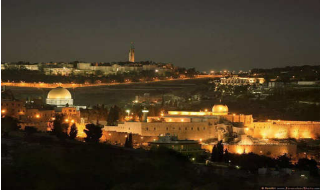
Εικόνα 3. ΓΕΝΙΚΗ ΑΠΟΨΗ ΤΗΣ ΑΓΙΑΣ ΠΟΛΗΣ

Ἐκατομμύρια ἀνθρώπων ἔζησαν τή ζωή τους μέ τή δύναμη, πού ἄντλησαν ἀπό τήν ἐπίσκεψη στήν Ἱερουσαλήμ ἢ ἀπό τό ὄνειρο τῆς ἐπίσκεψης σ' αὐτήν, ἔστω κι ἂν αὐτή δέν πραγματοποιήθηκε.