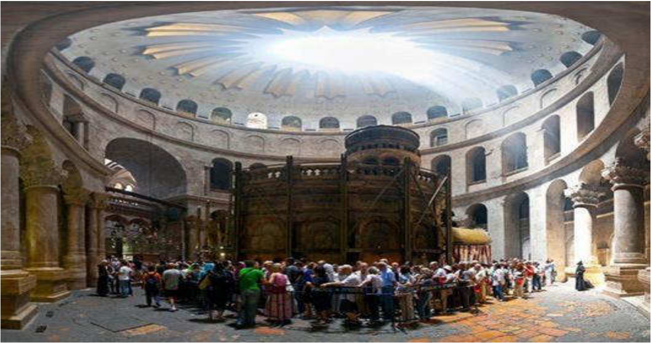
Εικόνα 17. ΝΑΟΣ ΤΗΣ ΑΝΑΣΤΑΣΕΩΣ

Για τη διατήρησή τους ανήγειρε ναούς, μεγαλοπρεπεείς, όπως το Ναό της Αναστάσεως, τον πρώτο μεγάλο ιστορικό ναό της χριστιανοσύνης.