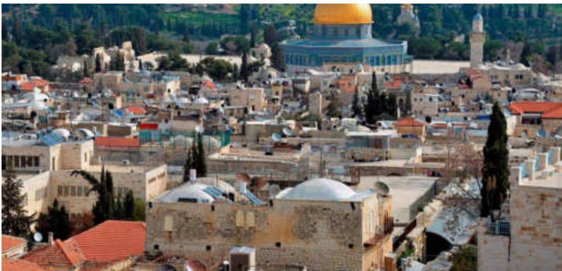
Εικόνα 4. Η ΙΕΡΟΥΣΑΛΗΜ ΣΗΜΕΡΑ

Τί εἶναι ἄραγες ἐκεῖνο, πού προκαλεῖ τή γοητεία καί τή νοσταλγία γιά τήν Ἱερουσαλήμ;