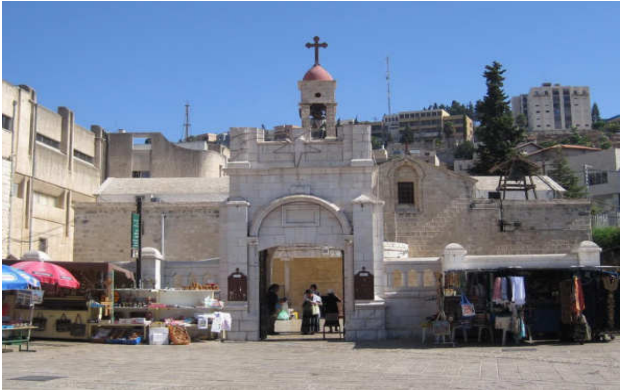
Εικόνα 19. ΝΑΟΣ ΕΥΑΓΓΕΛΙΣΜΟΥ ΣΤΗ ΝΑΖΑΡΕΤ

Μέ τον τρόπο αυτό τά συγκεκριμένα θεϊα και ιστορικά γεγονότα βιώνονταν στον τόπο, στον οποίο άπαξ συνέβηκαν, καθιστάμενα ζωηρότερα στη συνείδηση τών πιστών.