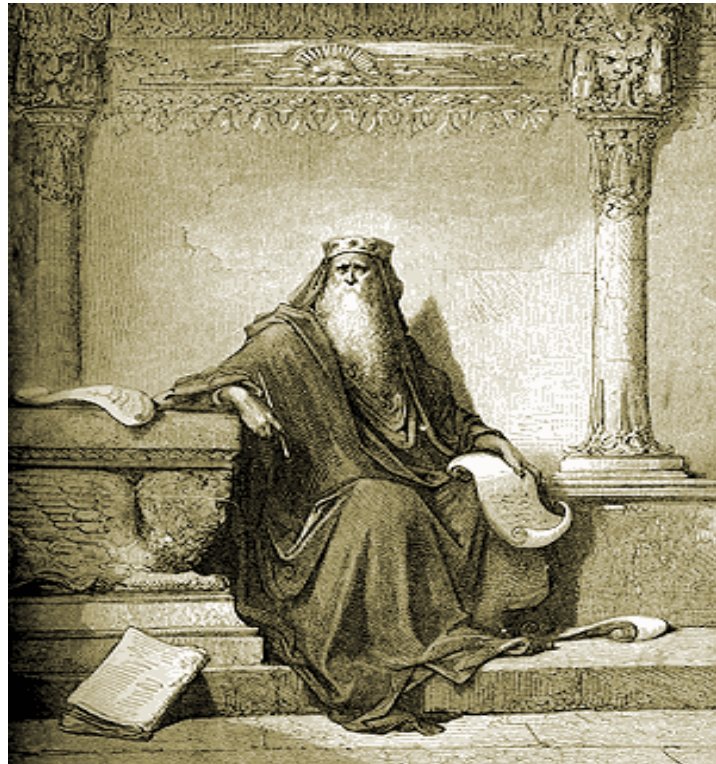
Εικόνα 6. ΒΑΣΙΛΙΑΣ ΣΟΛΟΜΩΝ

Σύμφωνα μέ τό βλέμμα ενός χριστιανοῦ καί μάλιστα ὀρθοδόξου, ἐκεῖνο πού προκαλεῖ τήν ἔλξη εἶναι ὅτι ἀνεξάρτητα ἀπό τίς ἀνθρώπινες αὐτές ἀδυναμίες καί παρανομίες ἡ Ἱερουσαλήμ εἶναι ἅγια, γιατί σ' αὐτή ἔλαβαν χώρα θεῖα γεγονότα κινούμενα ἀπό τό Θεό γιά τή σωτηρία τοῦ ἀνθρώπου.