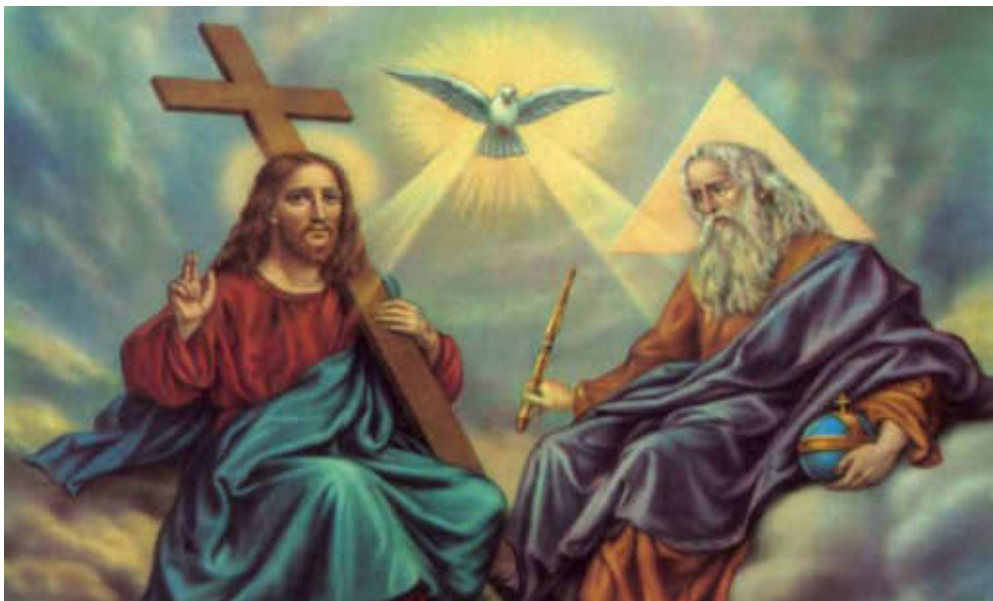
Εικόνα 14. ΤΡΙΑΔΙΚΗ ΘΕΟΤΗΤΑ

Στήν Ἱερουσαλήμ κατῆλθε τό Πνεῦμα τό Ἅγιο τήν ἡμέρα τῆς Πεντηκοστῆς, γενέθλια ἡμέρα τῆς ἐκκλησίας κι ἀπαρχή τῆς ἐξόδου της πρὸς τόν κόσμο.