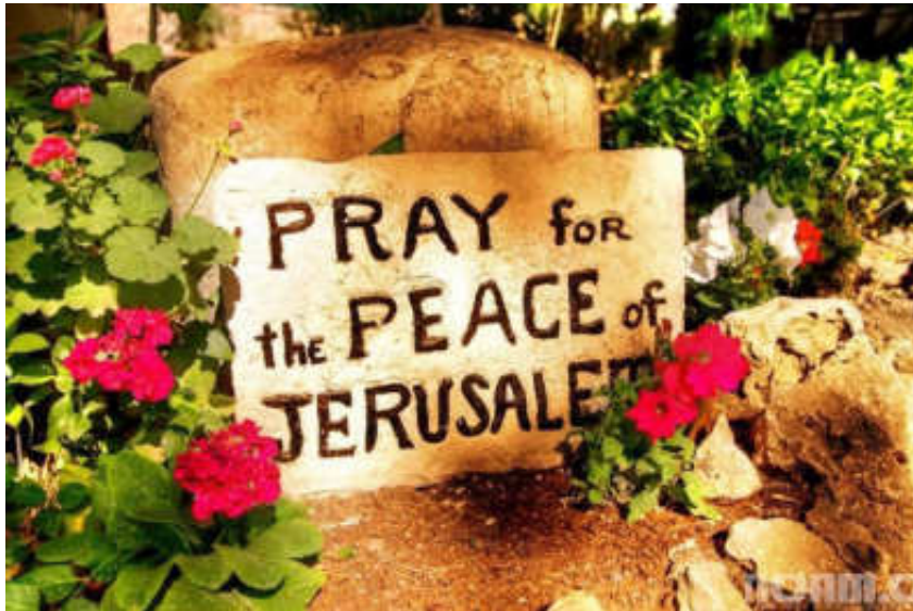
Εικόνα 5. Η ΕΥΧΗ

Σύμφωνα μέ τό βλέμμα ενός χριστιανοῦ καί μάλιστα ὀρθοδόξου, ἐκεῖνο πού προκαλεῖ τήν ἔλξη εἶναι ὅτι ἀνεξάρτητα ἀπό τίς ἀνθρώπινες αὐτές ἀδυναμίες καί παρανομίες ἡ Ἱερουσαλήμ εἶναι ἅγια, γιατί σ' αὐτή ἔλαβαν χώρα θεῖα γεγονότα κινούμενα ἀπό τό Θεό γιά τή σωτηρία τοῦ ἀνθρώπου.