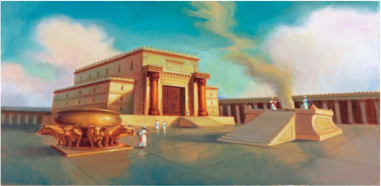
Εικόνα 7. Ο ΝΑΟΣ

Στήν Ίερουσαλήμ γράφτηκε από τό Θεό μεγάλο μέρος τῆς ιερᾶς ιστορίας. Τῆς ιστορίας, πού εἶχε ὡς σκοπό τή σωτηρία τοῦ ἀνθρώπου.