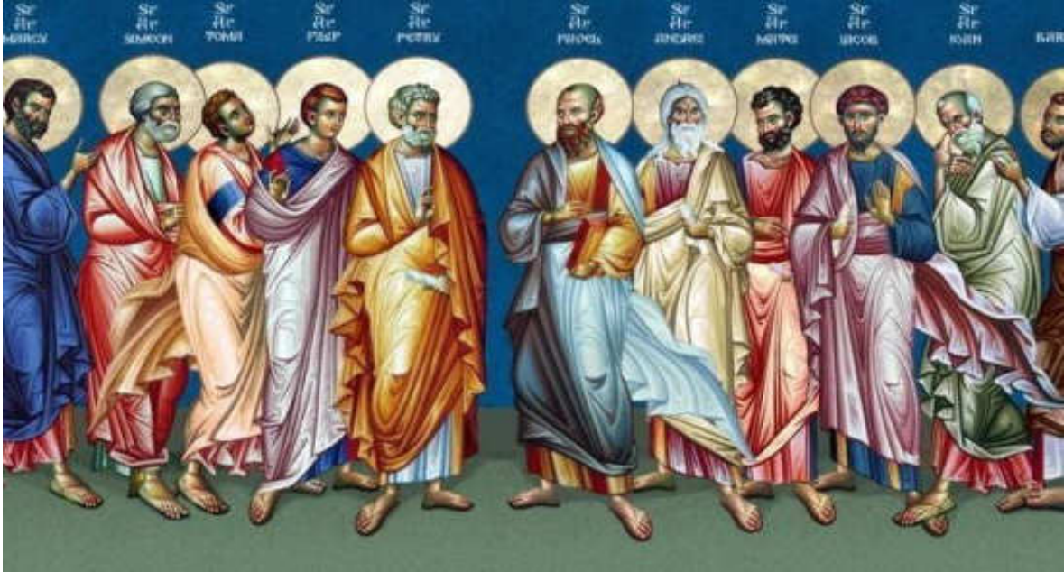
Εικόνα 13. ΑΠΟΣΤΟΛΟΙ ΕΚ ΠΕΡΑΤΩΝ

Στήν Ἱερουσαλήμ προετράπησαν νά παραμείνουν μέχρις νά ἐνδυσθοῦν δύναμιν ἐξ ὕψους.