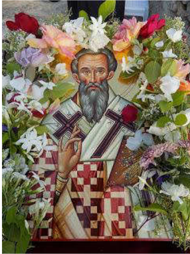
Εικόνα 20. ΑΓΙΟΣ ΙΟΥΒΕΝΑΛΙΟΣ