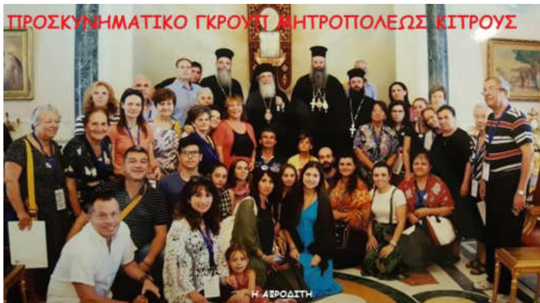
Εικόνα 26. ΠΡΟΣΚΥΝΗΤΕΣ ΑΓΙΑΣ ΓΗΣ

Οι άνθρωποι στό ροϋ τῆς ιστορίας τους ἄλλοτε μεγαλούργησαν κι ἄλλοτε ἐγκλημάτησαν στούς ἁγίους τόπους καί γιά χάριν τῶν ἁγίων τόπων.