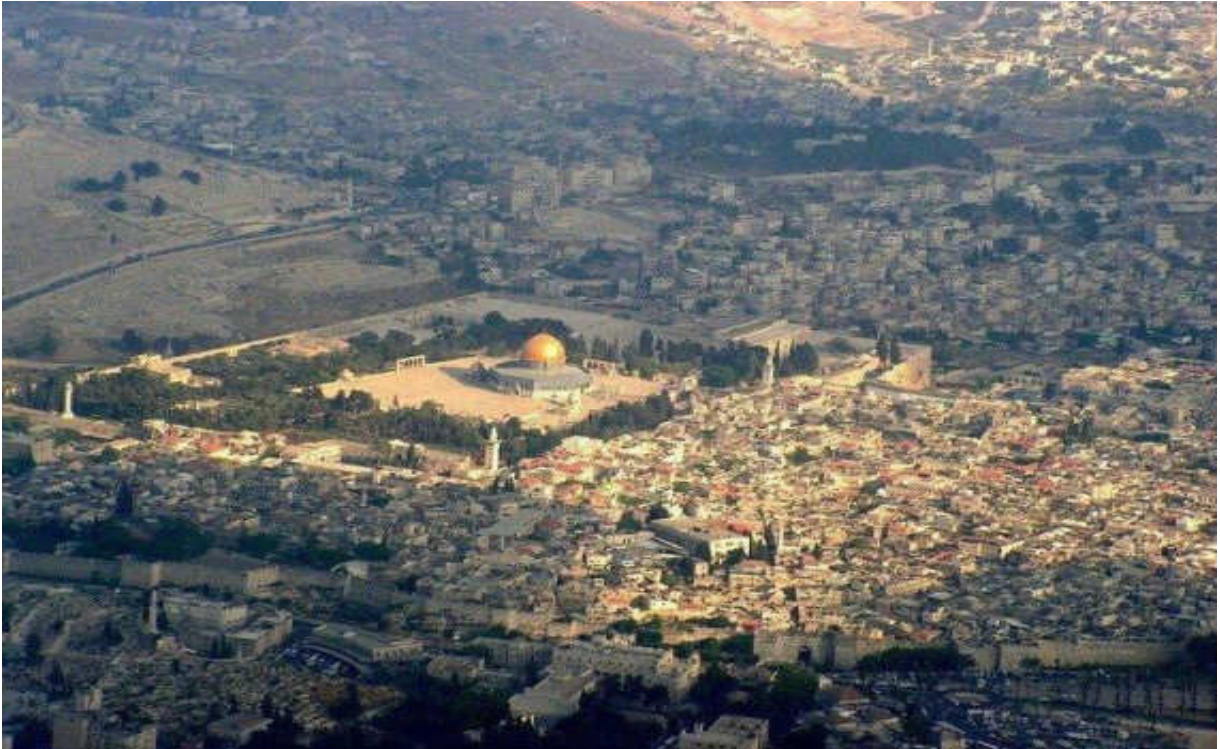
Εικόνα 1. ΓΕΝΙΚΗ ΑΠΟΨΗ ΙΕΡΟΥΣΑΛΗΜ ΤΟΥ ΣΗΜΕΡΑ

«Η Ίερουσαλήμ κι οι ἅγιοι τόποι της» ἀποτελοῦν ἐδῶ καί αἰῶνες τό σημεῖο ἀναφορᾶς, τόν πόλο ἔλξεως, τόν τόπο συναντήσεως πολλῶν γενεῶν διαφόρων λαῶν καί θρησκειῶν.