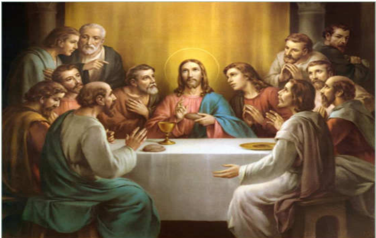
Εικόνα 12. Ο ΜΥΣΤΙΚΟΣ ΔΕΙΠΝΟΣ

Στήν Ίερουσαλήμ τέλεσε τό Μυστικό Δεΐπνο κι ιερούργησε τή Νέα Διαθήκη μεταξύ Θεοῦ καί ἀνθρωπότητας, σταυρώθηκε κι ἀναστήθηκε ὁ ἰδρυτής τῆς χριστιανικῆς θρησκείας κι ἐκκλησίας.