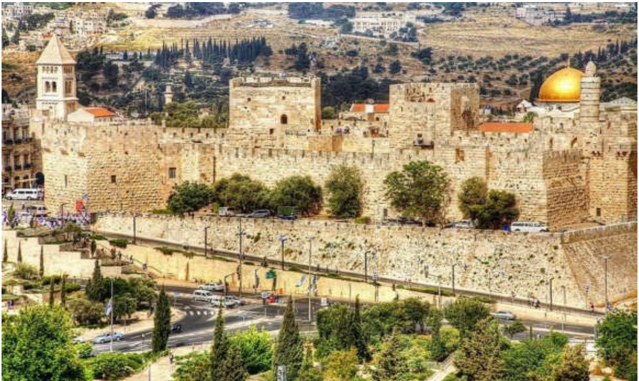
Εικόνα 8. Η .ΙΕΡΟΥΣΑΛΗΜ. ΤΟΥ. ΣΗΜΕΡΑ

Στήν Ίερουσαλήμ γράφτηκε από τό Θεό μεγάλο μέρος τῆς ιερᾶς ιστορίας. Τῆς ιστορίας, πού εἶχε ὡς σκοπό τή σωτηρία τοῦ ἀνθρώπου.