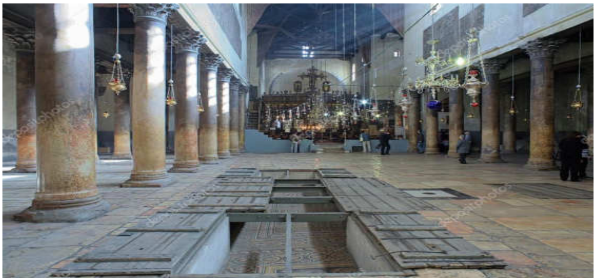
Εικόνα 18. ΒΑΣΙΛΙΚΗ ΓΕΝΝΗΣΗΣ ΣΤΗ ΒΗΘΛΕΕΜ

Ἡ οἰκοδομική αὐτή δραστηριότητα ἐπεκτάθηκε στή Βηθλεέμ, Ναζαρέτ καί σ' ἄλλους τόπους, πού συνδέονταν μέ γεγονότα τῆς ζωῆς τοῦ Ἰησοῦ.