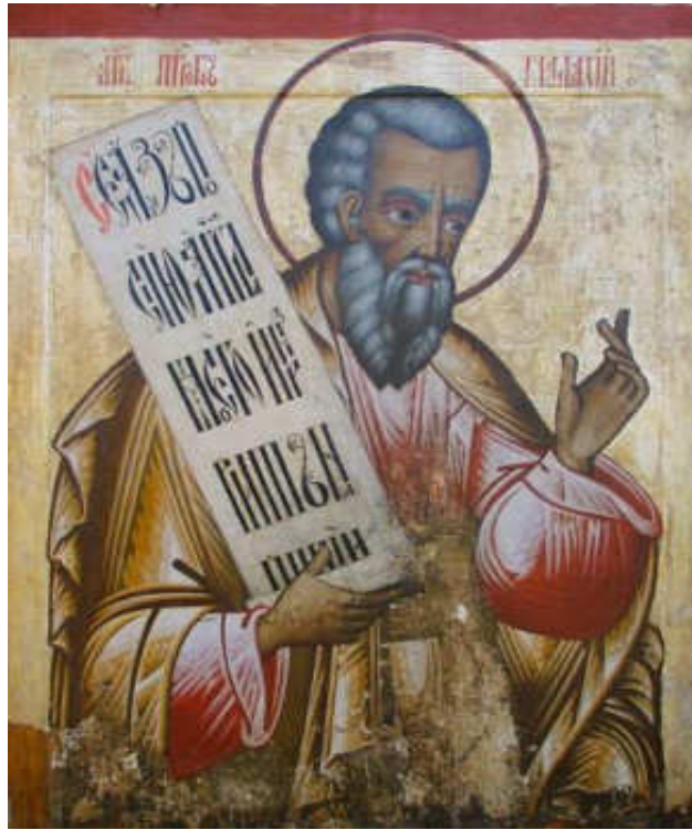
Εικόνα 9. ΠΡΟΦΗΤΕΣ

Στό ναό αυτό κήρυξαν και προσευχήθηκαν ο ίδιος ο Χριστός κι οι απόστολοι.