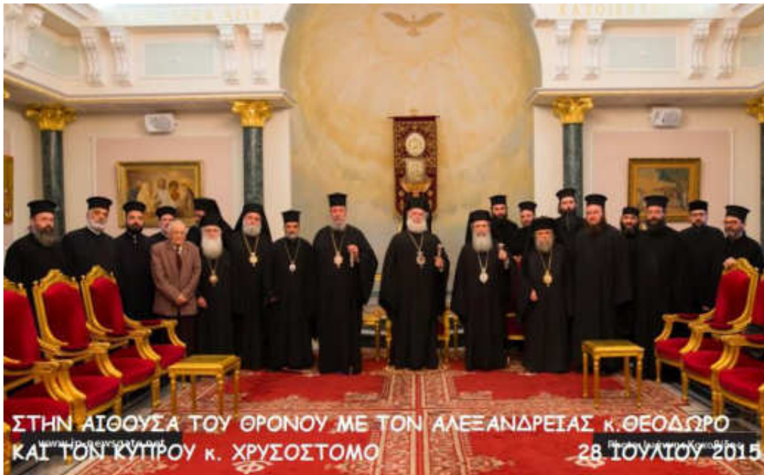
Εικόνα 22. ΛΕΙΤΟΥΡΓΙΚΗ ΖΩΗ

σ' αυτούς, γιά τή θέαση, τή θεωρία, τήν προσκύνηση τῶν θείων πράξεων, τή μετοχή σ' αυτές καί τόν άγιασμό.