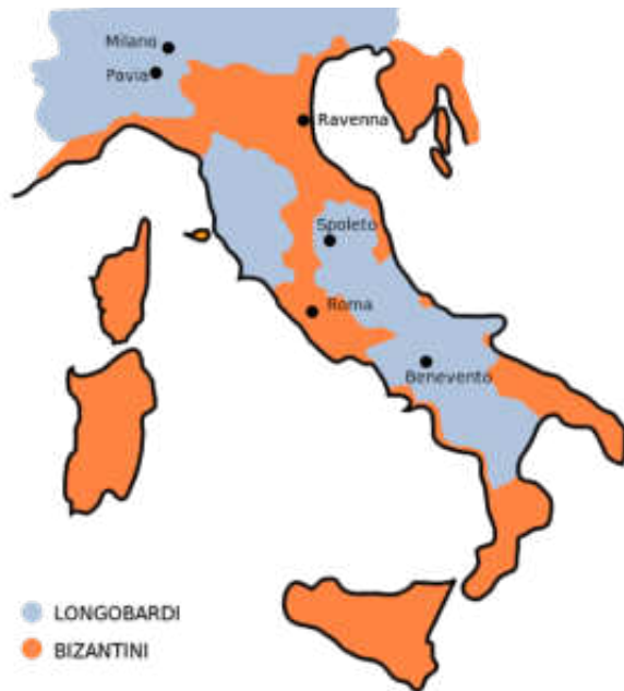
Χ. 3: Το Εξαρχάτο της Ιταλίας μετά την εισβολή των Λογγοβάρδων (τέλη 6ου αιώνας).