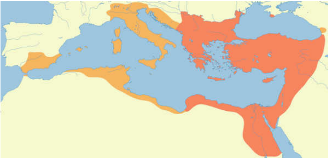
Χ. 1: Το Βυζάντιο πριν και μετά τις εκστρατείες ανακτήσεως του Ιουστινιανού (527-565).