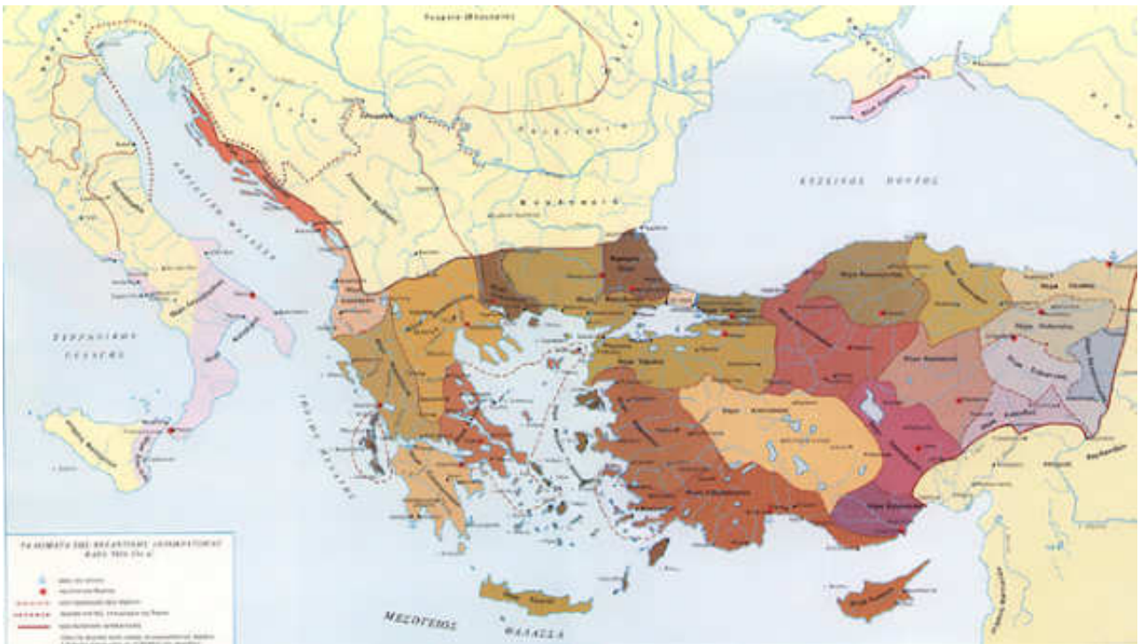
Χ. 2: Η αυτοκρατορία και τα θέματα της τον 10ο αιώνα.