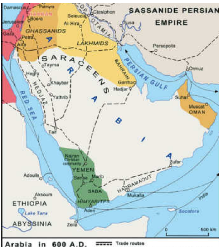
Χ. 4: Η Μέση Ανατολή πριν την άνοδο του Ισλάμ. Το Βυζάντιο και η Περσία ανταγωνίζονταν για την εξασφάλιση συμμάχων και υποτελών, καθώς και για τον έλεγχο εμπορικών οδών.