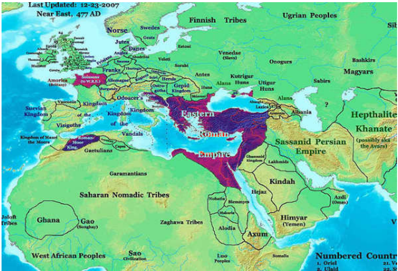
Χ. 5: Το Βυζάντιο την εποχή της πτώσεως της ρωμαϊκής Δύσεως. Διακρίνεται καθαρά η στρατηγική του θέση στο σταυροδρόμι Ευρώπης, Ασίας και Αφρικής.