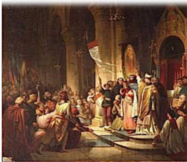
Η στέψη του Βονιφάτιου του Μομφεράτου ως αρχηγού της 4ης Σταυροφορίας έργο του Henri Decaisne

Στην αρχή συνάντησε τη γενική αδιαφορία των εστεμμένων της Ευρώπης, που είχαν τα δικά τους προβλήματα να επιλύσουν. Τον επόμενο χρόνο, κάποιοι ευγενείς, κυρίως από τα εδάφη της σημερινής Γαλλίας, πείσθηκαν να συγκροτήσουν ένα εκστρατευτικό σώμα, με επικεφαλής τον Κόμη Τιμπό της Καμπανίας. Ο Τιμπό πέθανε και αρχηγός της Δ' Σταυροφορίας ανακηρύχθηκε ο ιταλός κόμης Βονιφάτιος ο Μομφερατικός.