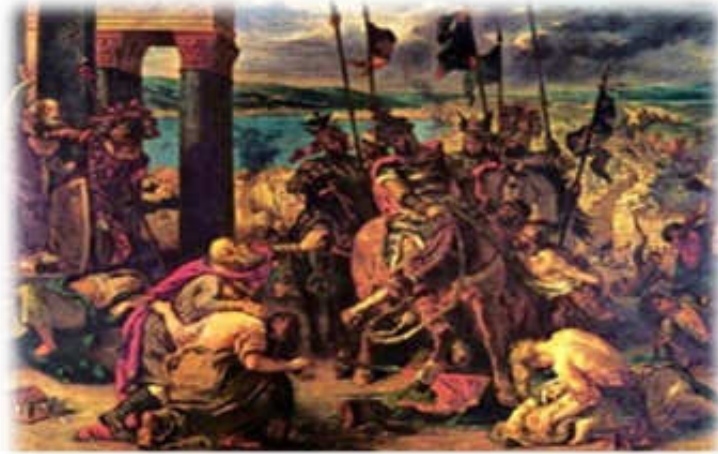
Η είσοδος των Σταυροφόρων στην Κωνσταντινούπολη (Ευγένιος Ντελακουρά, 1840)

Κάποιοι συμφώνησαν με την εκτροπή της Σταυροφορίας, άλλοι διαφώνησαν και αποχώρησαν, επιστρέφοντας στις πατρίδες τους.