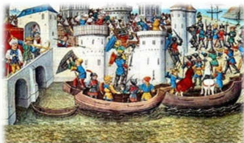
Η πολιορκία της Κωνσταντινούπολης

Στις 12 Απριλίου 1204 , οι Σταυροφόροι πραγματοποίησαν την τελική τους έφοδο κατά της Κωνσταντινούπολης, βοηθούμενοι και από τον καλό καιρό. Ο αυτοκράτορας Αλέξιος Ε΄ Μούρτζουφλος την είχε εγκαταλείψει κι έτσι την κατέλαβαν με σχετική ευκολία, παρά την αντίσταση της αυτοκρατορικής φρουράς, που την αποτελούσαν οι σκανδιναβοί Βάρραγγοι.