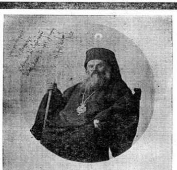
Ο ΜΑΡΤΥΣ ΜΗΤΡΟΠΟΛΙΤΗΣ ΧΡΥΣΟΣΤΟΜΟΣ