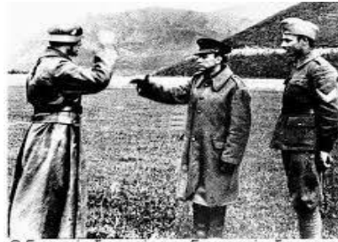
Ο Γερμανός διοικητής των Γερμανικών δυναμειών που επιτεθήκαν στο Ρούπελ χαιρετάει πηητικά τον Ελληνα διοικητή του οχυρού. -Troktikaras -

Ελληνική οχύρωση αυτή εκρίθη από τους Γερμανούς ως ανωτέρα της οχυρώσεως της Γραμμής Μαζινώ και εφάμιλλος της Οχυρώσεως της Γραμμής Σίγκριντ.