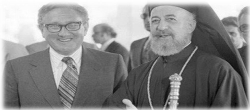
Ο Δρ Χένρι Κίσιγκερ και ο Αρχ. Μακάριος.