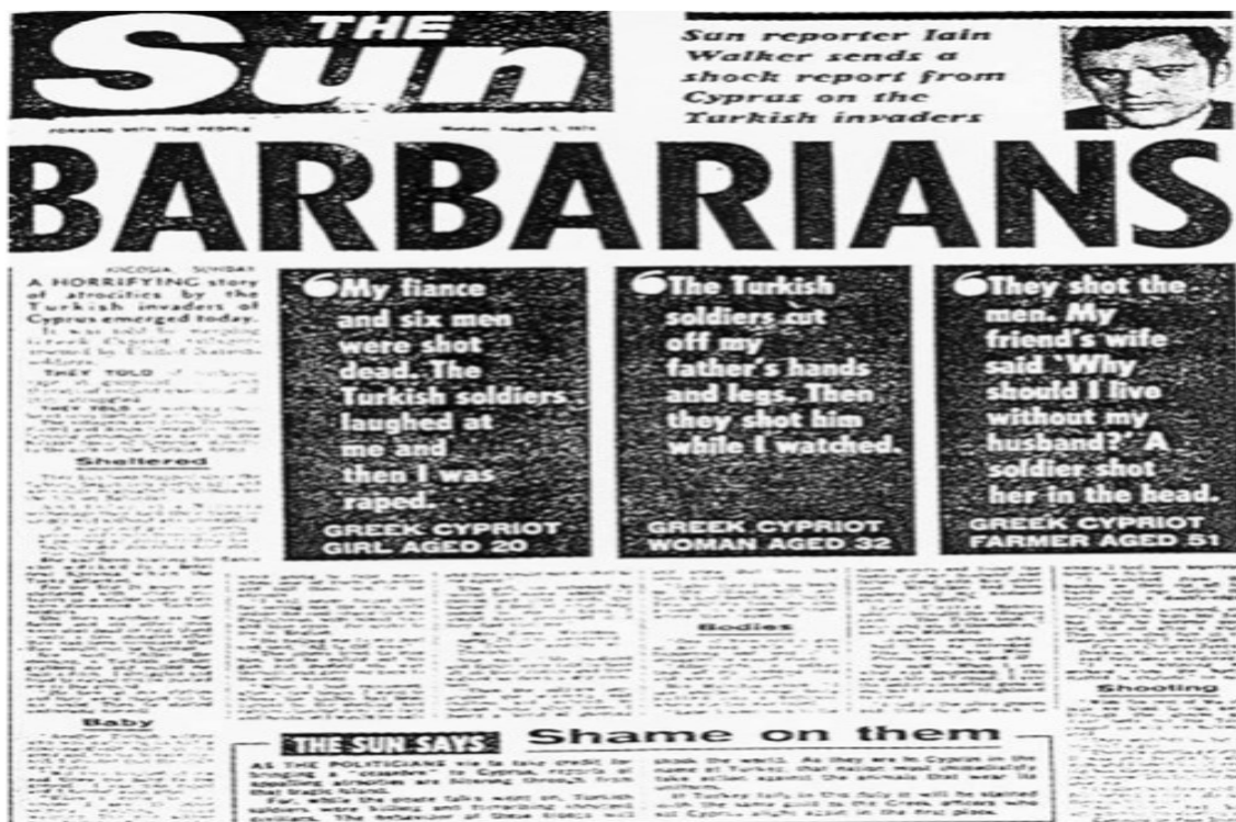
Πρωτοσέλιδο της βρετανικής «Σαν» 5/8/1974 ‘

Τελικά θα είναι οι Έλληνες της Κύπρου που θα μείνουν η μειοψηφία στην Κύπρο για να ικανοποιηθεί στο τάφο ο Νιχάτ Ερίμ και να ξεμπερδέψει και το Φόρειν Όφισ!