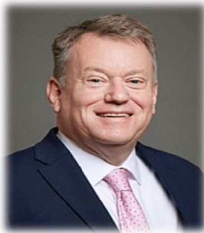
Ο Λόρδος David George Hamilton Frost (εν ζωή).