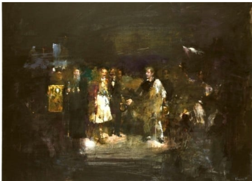
Η Μεγάλη Βρετανία

Ο Κριμαϊκός όμως Πόλεμος απέδειξε ότι κάθε μία δύναμη εξυπηρετούσε τα δικά της συμφέροντα. Κύριος λόγος ήταν η κατάκτηση εδαφών από την Οθωμανική Αυτοκρατορία, την οποία βέβαια κατά κάποιο τρόπο διέλυσαν περιορίζοντας την στα σημερινά γνωστά όρια της Τουρκίας. Οι κομματικοί αρχηγοί βέβαια πίστευαν ότι το κράτος που εκπροσωπούσαν εξυπηρετούσε τα εθνικά συμφέροντα, στην πραγματικότητα όμως εξυπηρετούσαν τα δικά τους συμφέροντα.