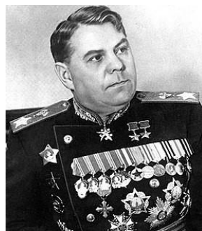
Ο Στρατάρχης Αλεξάντερ Βασιλέφσκι.

πεζικού του Τσαρικού Στρατού. Μετά την Οκτωβριανή επανάσταση του 1917 εντάχθηκε στο Κόκκινο Στρατό. Από το 1919 έως το 1922 συμμετείχε στο Ρώσο-πολωνικό πόλεμο. Το 1937 επιβίωσε των μεγάλων εκκαθαρίσεων του Στάλιν. Τον Αύγουστο του 1941, τοποθετήθηκε στην θέση του Διευθυντού των Επιχειρήσεων του Ρωσικού γενικού Επιτελείου. Τον Ιανουάριο του 1943 προήχθη σε Στρατηγό και 29 ημέρες μετά έλαβε το βαθμό του Στρατάρχη και διεύθυνε τις επιχειρήσεις στο μέτωπο της Ουκρανίας. Μετά την ανακατάληψη της Οδησού υπήρξε ο δεύτερος αξιωματικός μετά τον Στρατάρχη Ζούκοφ, που του απονεμήθηκε το παράσημο της Νίκης. Το Ιούλιο του 1944 έλαβε τη διάκριση του «Ήρωος της ΕΣΣΔ».