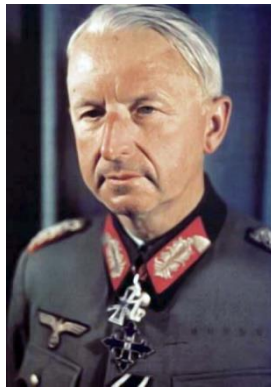
Ο Στρατάρχης Έριχ φον Μάνσταϊν.

του νέου γερμανικού στρατού, επικειμένης της εντάξεως της Δυτικής Γερμανίας στο NATO. Το 1955 κυκλοφόρησε το βιβλίο του «Νίκαι Απωλεσθείσαι (Verlorene Siege)». Ο Μάνσταϊν απεβίωσε στις 10 Ιουνίου 1973 στο Μόναχο. Του αποδόθηκαν πλήρεις στρατιωτικές τιμές, ενώ την κηδεία του παρακολούθησε πλήθος υφισταμένων του όλων των βαθμών. Στις νεκρολογίες τους οι Times έγραψαν: «Η αναγνώριση και η επιβολή του προερχόταν από τη νοητική του ισχύ και το βάθος των γνώσεών του», ενώ το περιοδικό Spiegel επισήμανε: «Βοήθησε στην πορεία προς την καταστροφή, παραπλανημένος από μια τυφλή αίσθηση του καθήκοντος». Θεωρείται από πολλούς ο ικανότερος από τους Γερμανούς Στρατηγούς του Β΄ Παγκοσμίου Πολέμου.