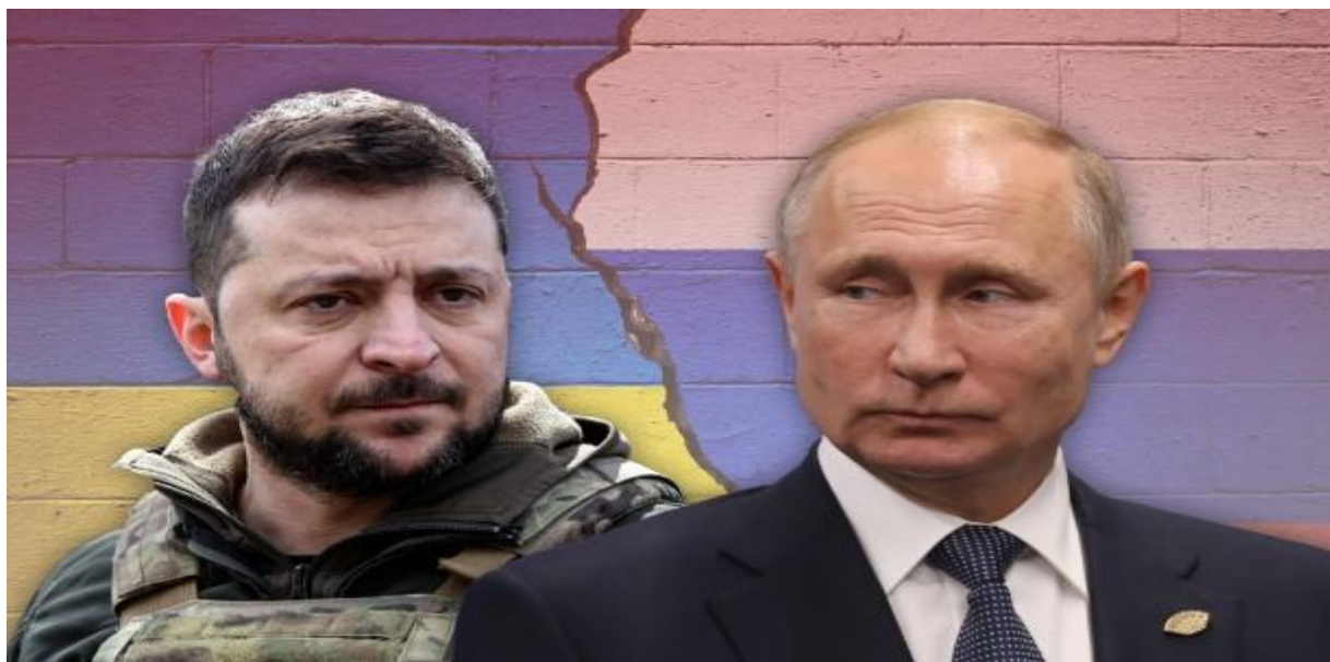
Βολοντομίρ Ζελένσκυ-Βλαντιμίρ Πούτιν.

Γράφει ο Αντιστράτηγος ε.α. Ιωάννης Κρασσάς.