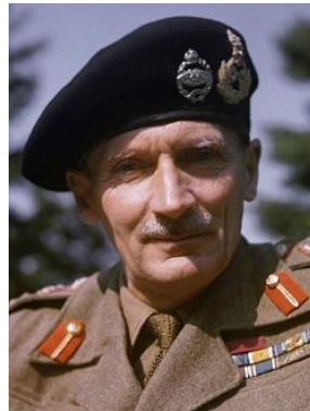
Ο Στρατάρχης Μπέρναρντ Λο Μοντγκόμερυ.

ένα υιό τον Νταίβιντ. Ο Μοντγκόμερυ ήταν γεννημένος στρατιώτης, κατάρτισμένος, με στρατηγική αντίληψη, ήξερε πως να κερδίζει την εμπιστοσύνη των ανδρών του και να ανυψώνει το ηθικό τους. Πίστευε ότι: «Η ηγεσία στηρίζεται στην αλήθεια και το χαρακτήρα, ο ηγέτορας πρέπει να υπηρετεί την αλήθεια και να την καταστήσει το επίκεντρο ενός κοινού σκοπού».