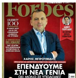
Η Ελληνική έκδοση του Forbes.

[6] Το Forbes είναι ένα αμερικανικό επιχειρηματικό περιοδικό που ιδρύθηκε το 1917 από τον Μπέρτι Φόρμπος. Το 2014 αγοράστηκε από την εταιρεία «Ενοποιημένες Επενδύσεις Whale Media(Integrated Whale Media Investments) με έδρα το Χονγκ Κονγκ. Ο πρόεδρος και αρχισυντάκτης του είναι ο Στηβ Φόρμπος. Το Forbes εκδίδεται οκτώ φορές το χρόνο και παρουσιάζει άρθρα για θέματα χρηματοδότησης, βιομηχανίας, επενδύσεων και μάρκετινγκ. Αναφέρει επίσης σχετικά θέματα όπως η τεχνολογία, οι επικοινωνίες, η επιστήμη, η πολιτική και το δίκαιο. Έχει διεθνή έκδοση στην Ασία καθώς και εκδόσεις που παράγονται με άδεια σε 27 χώρες και περιοχές σε όλο τον κόσμο. Το περιοδικό είναι γνωστό για τις λίστες και τις κατατάξεις του, συμπεριλαμβανομένων των πλουσιότερων Αμερικανών, των 30 πιο αξιοσημείωτων νέων κάτω των 30 ετών των πλουσιότερων διασημοτήτων της Αμερικής, των κορυφαίων εταιρειών του κόσμου. Το μότο του περιοδικού Forbes είναι «Άλλαξε τον κόσμο» .