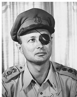
Ο Στρατηγός Μοσέ Νταγιάν.

ούσε με αποτέλεσμα να χάσει το αριστερό του μάτι. Έκτοτε φορούσε ένα μαύρο «πειρατικό» κάλυμμα για το υπόλοιπο της ζωής του, κάτι που τον έκανε μία από τις πιο διάσημες φιγούρες της διεθνούς πολιτικής σκηνής.