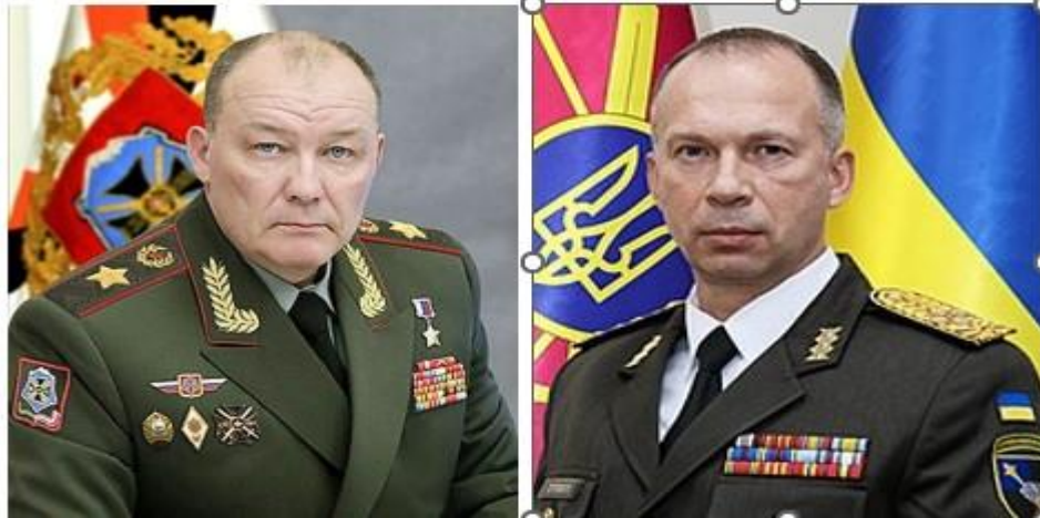
Ο Στρατηγός Αλεξάντερ Ντβορικόφ, ο Αντιστράτηγος Ολκσάντερ Σούρσκι.

Αυτή τη περίοδο η κατάσταση έχει σταθεροποιηθεί σε ένα μέτωπο μήκους 900 χλμ από βορρά προς νότο, όπως φαίνεται στο χάρτη, με την διακεκομμένη κόκκινη γραμμή.