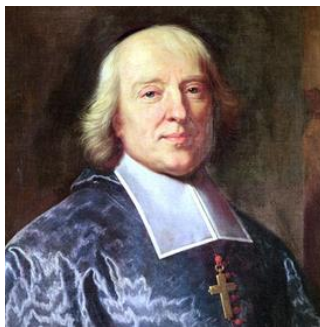
Ο Ζακ Μπενίν Μποσσουέ.

[5] Ο Ζακ Μπενίν Μποσσουέ [1627-1704(Jacques-Bénigne Bossuet)], παλαιότερη ελληνική ονομασία Βοσσουέτος, ήταν Γάλλος ιερωμένος, θεολόγος και ιεροκήρυκας, θεωρούμενος ένας από τους σπουδαιότερους ρήτορες όλων των εποχών. Το 1670 έγραψε μετά από εντολή του βασιλέως της Γαλλίας Λουδοβίκου 14 ου (1638-1715), το σπουδαιότερο έργο του: «Ο Λόγος περί της Παγκοσμίου Ιστορίας και την Πολιτική Εξαγομένη εκ της Αγίας Γραφής».