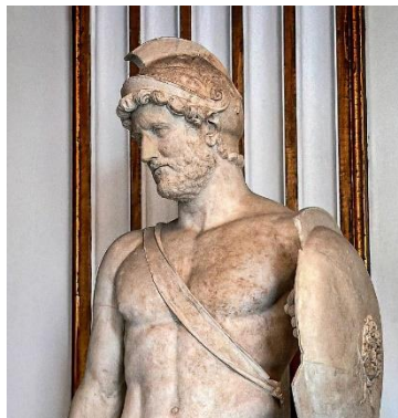
Ο Θεός Άρης.

[3] Ο Άρης είναι ο Έλληνας θεός του πολέμου, υιός της Ήρας και του Διός. Γράφεται επίσης πως η Ήρα έμεινε έγκυος μυρίζοντας ένα λουλούδι που της έδωσε η θεά Ανθούσα. Στους μύθους ο Άρης εμφανίζεται πολεμοχαρής και προκλητικός, και εκπροσωπεί την ενθουσιώδη φύση του πολέμου. Οι Έλληνες ήταν επιφυλακτικοί προς τον Άρη, διότι αν και ενσωμάτωσε τη φυσική ανδρεία που είναι αναγκαία για την επιτυχία στον πόλεμο, ήταν μια επικίνδυνη δύναμη. Ο Φόβος και ο Δείμος(Τρόμος) ήταν οι ακόλουθοί του.