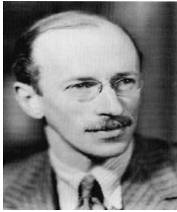
Ο Σερ Λίντελ Χαρτ.

[6] Ο Σερ Λίντελ Χαρτ [1895-1970(Sir Liddell Hart) ήταν Βρετανός αξιωματικός του στρατού, θεωρητικός και ιστορικός. Μετά τον Δεύτερο Παγκόσμιο Πόλεμο υποστήριξε την ανασυγκρότηση της Δυτικής Γερμανίας και την αποκατάσταση του Γερμανικού στρατού.