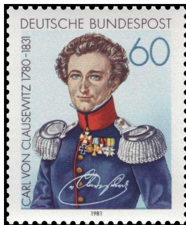
Ο Καρλ Φον Κλαούζεβιτς.

[7] Ο Καρλ Φον Κλαούζεβιτς [(Πρωσία 1780-1831) Carl Von Clausewitz] μισούσε τον Ναπολέοντα ως εχθρό της πατρίδος του, αλλά τον θαύμαζε ως στρατηγό. Οι Ναπολεόντειοι πόλεμοι επηρέασαν σε μεγάλο βαθμό το έργο του Κλαούζεβιτς. Η Μαρί φον Μπγουλ(χήρα του Στρατηγού), διασκεύασε και εξέδωσε σημαντικό αριθμό γραπτών του κατά το διάστημα από 1832-εώς 1835.