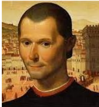
Ο Νικολό Μακιαβέλι

[1] Ο Νικολό Μακιαβέλι [Φλωρεντία 1469-1527(Niccolò Machiavelli)], ήταν Ιταλός διπλωμάτης, πολιτικός, ιστορικός, ανθρωπιστής και συγγραφέας της περιόδου της Αναγεννήσεως. Ο πατέρας του, παρότι είχε πενιχρά οικονομικά μέσα, μερίμνησε ώστε ο Νικολό να λάβει εκπαίδευση σύμφωνη με τα κλασικά πρότυπα της εποχής. Το 1498 έλαβε το αξίωμα δεύτερου καγκελαρίου της Φλωρεντινής Δημοκρατίας, ενώ το 1513 συνέγραψε το κλασσικό έργο του «Ο Ηγεμών».