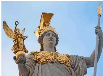
Η Θεά Αθηνά.

πόδια του, δείγμα αναγνώρισής του ως υπέρτατου θεού και πατέρα της. Η ερμηνεία που δίδεται για τη γέννηση της Αθηνάς, είναι ότι η γνώση βρίσκεται στον εγκέφαλο γι' αυτό γεννήθηκε από το κεφάλι του Διός, η απειλή ανατροπής πηγάζει από το ότι η γνώση που αντιπροσωπεύει η Αθηνά ασκεί κριτική στην αυθαίρετη άσκηση εξουσίας. Η υποταγή της Αθηνάς συνιστά πράξη ρεαλισμού, ότι εάν δεν μπορείς να πολεμήσεις την εξουσία καλύτερα να την υπηρετείς και επίσης ότι είναι κακό να πολεμάς την οικογένεια(οικογενειοκρατία από τότε). Το άνοιγμα στο κεφάλι του Διός αποκαταστάθηκε πλήρως. Για οτιδήποτε περαιτέρω πληροφορίες ανατρέξατε στην "Θεογονία" του Ησίοδου.