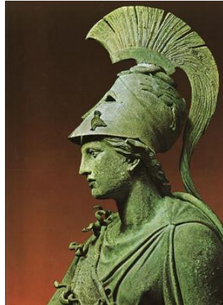
Η Θεά Αθηνά.

σε τον προστάτη Άγιο, ο Στρατός τον Άγιο Γεώργιο, το Ναυτικό τον Άγιο Νικόλαο και η Αεροπορία τον Αρχάγγελο Μιχαήλ, χωρίς να λείπουν και οι επί μέρους αποκλειστικότητες όπως η Αγία Βαρβάρα για το Πυροβολικό, ο Άγιος Παΐσιος για τις Διαβιβάσεις κ.λ.π. Η έκκληση του Θεού μεταξύ αλλόθρησκων μεταφέρει την αντιπαράθεση σε ανώτερο επίπεδο(π.χ Ισραήλ-Χαμάς), αλλά η ερώτηση είναι ποιος τυγχάνει της θείας προστασίας μεταξύ ομόθρησκων(π.χ Ουκρανία-Ρωσία).