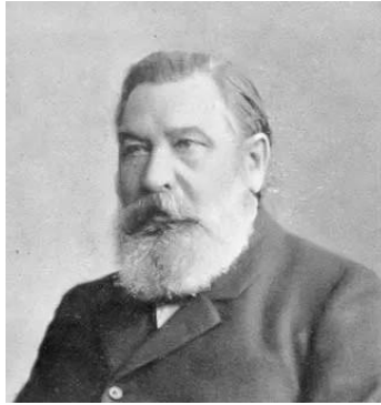
Ο Χάινριχ Φον Τράιτσκε.

[3] Ο Άρης είναι ο Έλληνας θεός του πολέμου, υιός της Ήρας και του Διός. Γράφεται επίσης πως η Ήρα έμεινε έγκυος μυρίζοντας ένα λουλούδι που της έδωσε η θεά Ανθούσα. Στους μύθους ο Άρης εμφανίζεται πολεμοχαρής και προκλητικός, και εκπροσωπεί την ενθουσιώδη φύση του πολέμου. Οι Έλληνες ήταν επιφυλακτικοί προς τον Άρη, διότι αν και ενσωμάτωσε τη φυσική ανδρεία που είναι αναγκαία για την επιτυχία στον πόλεμο, ήταν μια επικίνδυνη δύναμη. Ο Φόβος και ο Δείμος(Τρόμος) ήταν οι ακόλουθοί του.