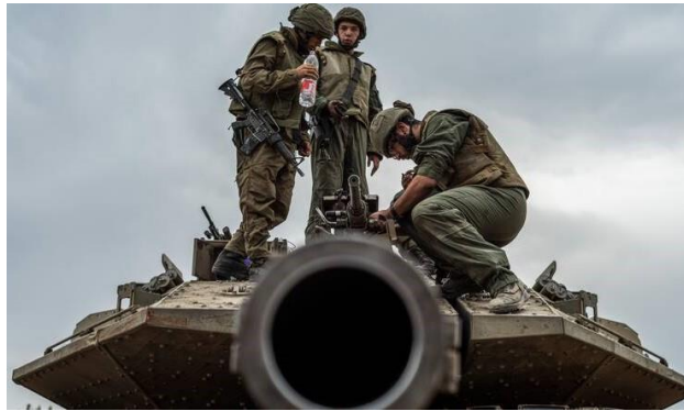
Ισραηλινοί Στρατιώτες σε άρμα μάχης.

αποτελεί τη γενεσιουργό αιτία των σημαντικότερων μεταβολών της ζωής του πλανήτη μας, παρότι είναι αντίθετος προς τη πνευματική υπόστασή του ανθρώπου. Η συντριπτική πλειοψηφία των κρατών της υφηλίου «γεννήθηκαν» μέσα από τις φλόγες του πολέμου. Ο άνθρωπος από τη φύση του επιζητεί την απόκτηση ισχύος μέσω του πλουτισμού και των αξιωμάτων και δεν διστάζει να χρησιμοποιήσει βία για τη διατήρηση και την επαύξησή τους. Το ίδιο ισχύει και για τα έθνη. «Όσο το ανθρώπινο γένος θα διακατέχεται από αμαρτίες και πάθη, τότε ο πόλεμος είναι αδύνατον να εξαφανισθεί από το πρόσωπο της γης». Χάινριχ Φον Τράιτσκε [2] (1834-1896). Ούτε οι θρησκείες, ούτε η παγκόσμια πνευματική τάξη κατάφεραν να πείσουν τους ανθρώπους να μη καταφεύγουν στη βία.