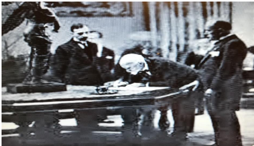
Βενιζέλος και Μουσολίνι υπογράφουν το Ελληνο-ιταλικό Σύμφωνο.

Τον Σεπτέμβριο του 1938 τεραματίσθηκε η διμερής «Συνθήκη φιλίας, Συνδιαλ-λαγής και Δικαστικού Διακανονισμού», που υπογράφηκε το 1928 από τον Ελευθέριο Βενιζέλο και τον Μπενίτο Μουσολίνι. Την 28 η Οκτωβρίου 1939, ένα χρόνο πριν την ιταλική επίθεση κατά της Ελλάδος, υπογράφηκαν από τον Μεταξά και το Γκράτσι δύο έγγραφα τα οποία επιβεβαίωναν την φιλία και την συνεργασία των δύο χωρών.