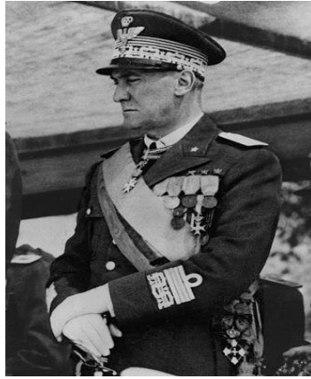
Ο Στρατάρχης Ροδόλφος Γκρατσιάνι.

[6] Ο Ιταλός Στρατηγός Σεμπασιάνο Βισκόντι Πράσκα (1883-1965) συμμετείχε στον Ιταλοτουρκικό πόλεμο το 1911 και στον Α΄ ΠΠ. Έμεινε γνωστός για αποτυχημένη διεύθυνση της ιταλικής επιθέσεως κατά της Ελλάδος.