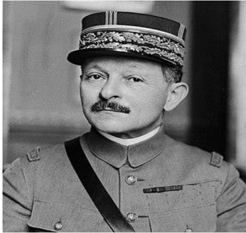
Ο Γάλλος Στρατάρχης Μαξίμ Βεϋγκάν.

[4] Αντιστράτηγος Κωνσταντίνος Δόβας (Κόνιτσα 1898-Αθήνα 1973), έλαβε μέρος στον Α΄ Παγκόσμιο Πόλεμο στην Μικρασιατική Εκστρατεία, τον Ελληνο-ιταλικό Πόλεμο και στον Πόλεμο για την καταστολή της κομμουνιστικής ανταρσίας, όπου διακρίθηκε και τραυματίστηκε στην Μάχη της Κονίτσης(Δεκέμβριος 1947). Διετέλεσε υπηρεσιακός πρωθυπουργός από τις 20 Σεπτεμβρίου έως την 4 η Νοεμβρίου 1963.