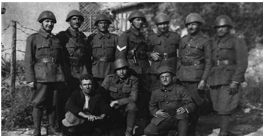
Επίστρατοι στην Φλώρινα.

σύνορα. Ο Μεταξάς δεν έκανε φανερή επιστράτευση για να μην αυξήσουν οι Ιταλοί τις δυνάμεις του στην Αλβανία.