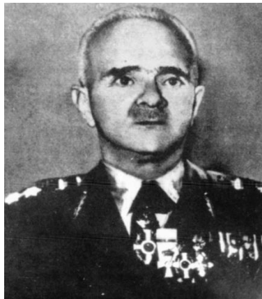
Ο Αντιστράτηγος Κωνσταντίνος Δόβας.

[4] Αντιστράτηγος Κωνσταντίνος Δόβας (Κόνιτσα 1898-Αθήνα 1973), έλαβε μέρος στον Α΄ Παγκόσμιο Πόλεμο στην Μικρασιατική Εκστρατεία, τον Ελληνο-ιταλικό Πόλεμο και στον Πόλεμο για την καταστολή της κομμουνιστικής ανταρσίας, όπου διακρίθηκε και τραυματίστηκε στην Μάχη της Κονίτσης(Δεκέμβριος 1947). Διετέλεσε υπηρεσιακός πρωθυπουργός από τις 20 Σεπτεμβρίου έως την 4 η Νοεμβρίου 1963.