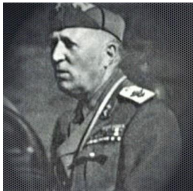
Ο Στρατηγός Βισκόντι Πράσκα.

[6] Ο Ιταλός Στρατηγός Σεμπασιάνο Βισκόντι Πράσκα (1883-1965) συμμετείχε στον Ιταλοτουρκικό πόλεμο το 1911 και στον Α΄ ΠΠ. Έμεινε γνωστός για αποτυχημένη διεύθυνση της ιταλικής επιθέσεως κατά της Ελλάδος.